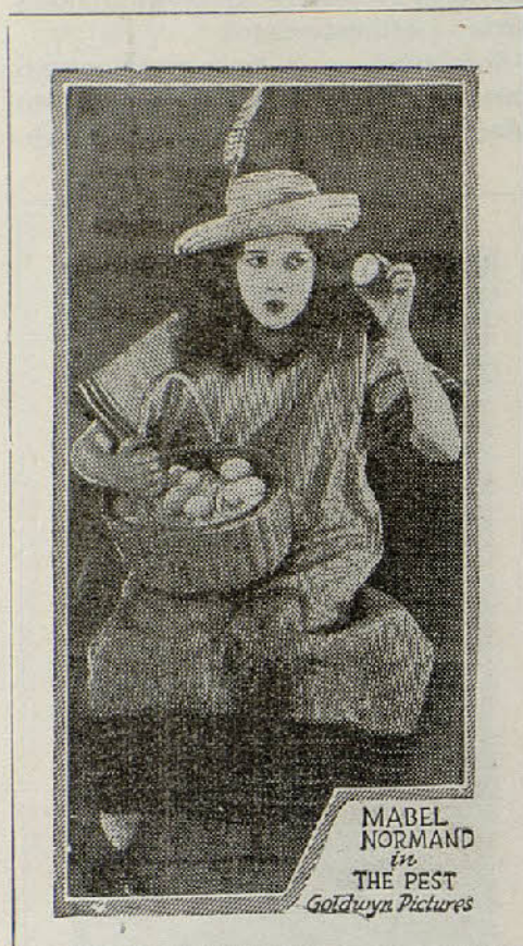
MABEL NORMAND in THE PEST Goldwyn Pictures

Estos dos sujetos, que del vicio vivían, no vieron con buenos ojos la llegada del