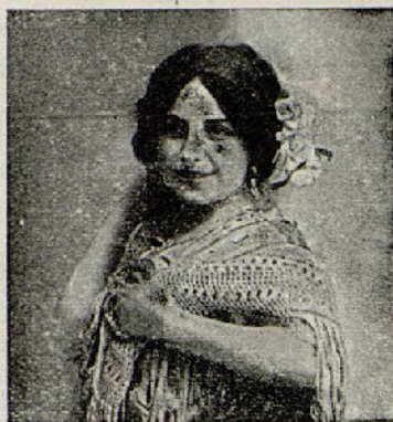
LA IDEAL CHELITO

Entre los números más salientes de la obra hay una Trova de amor , un grupo de Bibelots , una Muñeca inglesa , etc. etc.