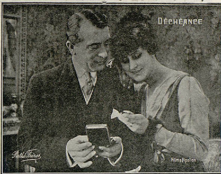
Una escena de la película «Trágico dilema»

Gabriel Gaveston tiene un momento de vacilación. El dilema es horrible. O la deshonra de su cuñada, o su propia des-