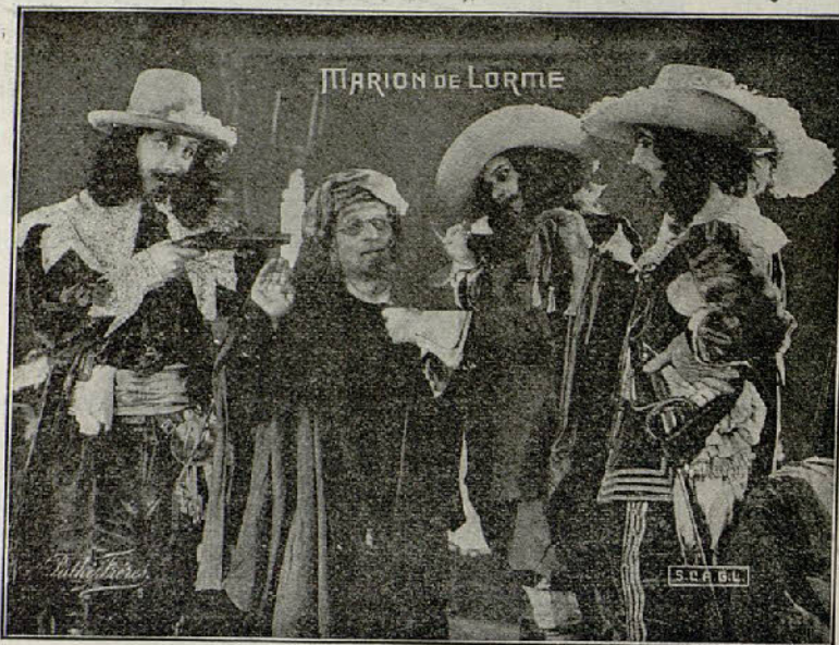
Una escena de la película «Marion de Lorme»