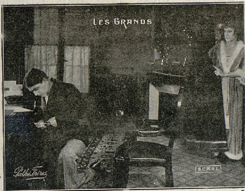
Una escena de la película «Primer amor»

ción oficial de hidro-aeroplanos. El teniente Gaveston se avista con el primer piloto que encuentra, le expone el caso. Y momentos después elevábase en el aire en el poderoso pájaro mecánico.