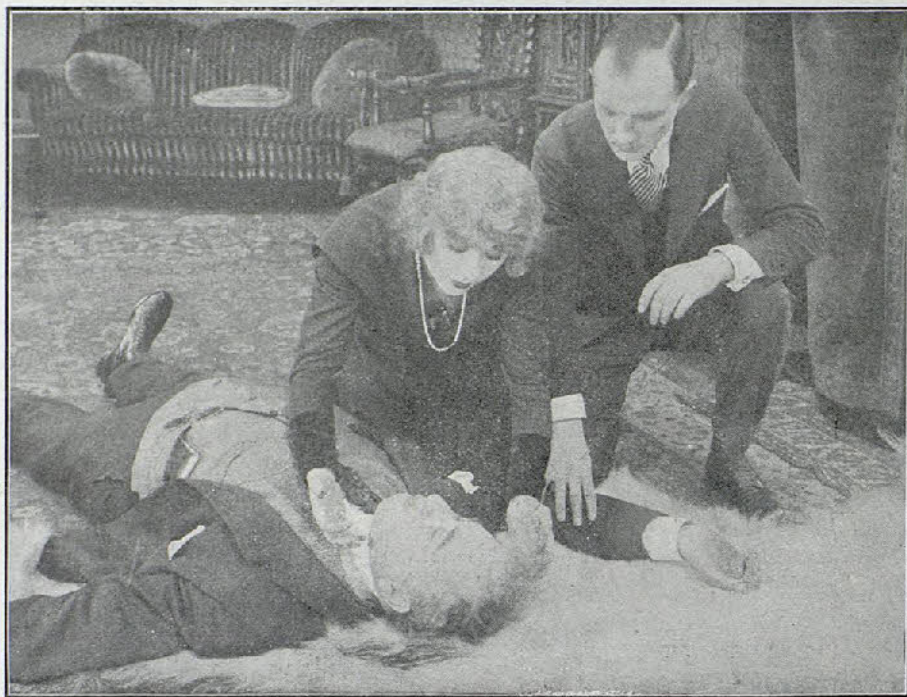
Una escena de «El Misterio de la Doble Cruz»

Vilaseca y Ledesma. —«El crucero acorazado Waldeck-Rousseau»; «El... y la echadora de cartas», comedia; «La venganza me pertenece», drama de 1.200 m. y la de marca Triangle «Rosina ama a un marino».