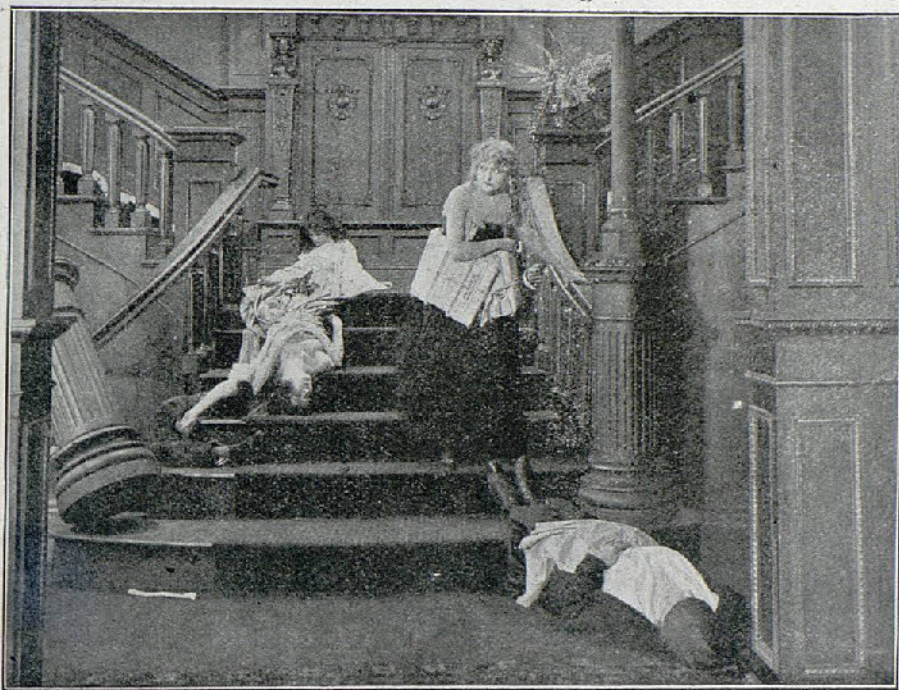
Una escena de «El Misterio de la Doble Cruz»

Desmoralizado completamente por la desaparición de su amiga, Eduardo Hyde se encuentra cierto día en un té lujoso en presencia de la que se hace pasar por Patria Channing. Por primera vez se le ocurre la idea de una mixtificación y la comunica a Manuel Castro; pero éste le disuade de su idea, y designándole a Donald Parr le dice que es el capitán quien ha raptado y oculta a la famosa bailarina.