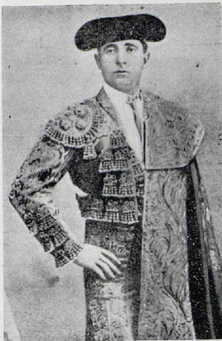
MADRID - Despedida de Cocherito

El pundonoso diestro bilbaino que durante tantos años ocupó dignamente su puesto de segunda fila, al lado de Bombita y Machaquito, de Pastor y el Gallo; el que hace 15 años tomó la alternativa de manos de Fuentes y alternando con Ricardo y Rafael, se despidió el domingo del público madrileño tan dignamente como se doctoró, y alternando con los ases de hoy, como antaño lo hiciera con los de entonces. Estuvo bien en su primer toro, y en el 4.º superior. Faena breve, valiente y torero, y una media estocada superior. Le ovacionó el público y le dieron la oreja. Joselito y Belmonte, haciendo honor al compañero que se va, torearon colosalmente, no cesando de oír ovaciones con los mansos de Salas. José cortó una oreja. Como veremos la despedida de Cástor en Bilbao, aplazamos para entonces la biografía; con los datos completos de su historia profesional.