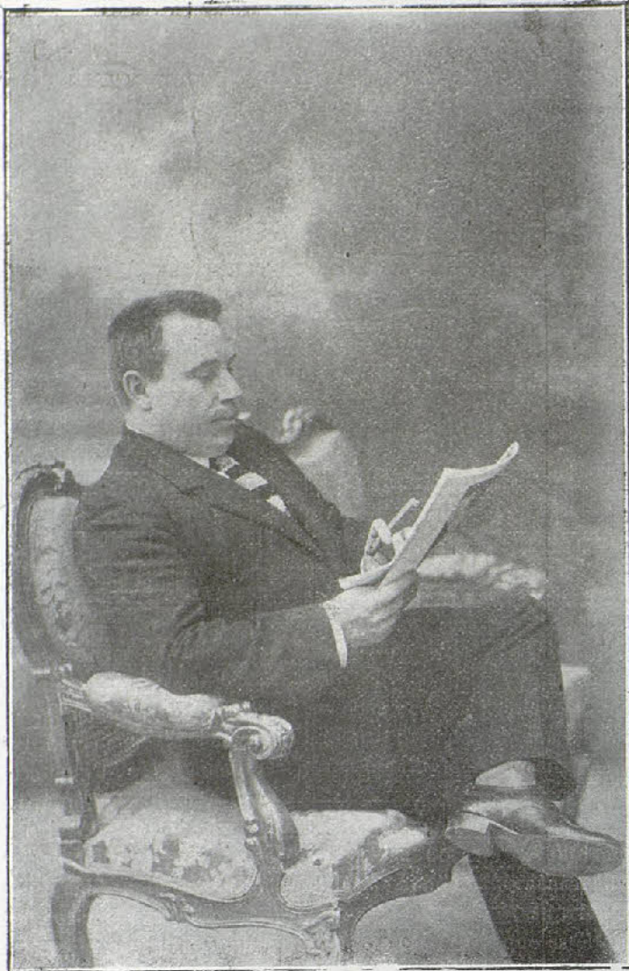
El Maestro Luna

Las dos novedades más importantes de la semana última han sido un estreno de Jacinto Benavente en Lara con ocasión del beneficio del insigne Thuiller, titulado «La honra de los hombres» y una opereta de Luna en el Centro.