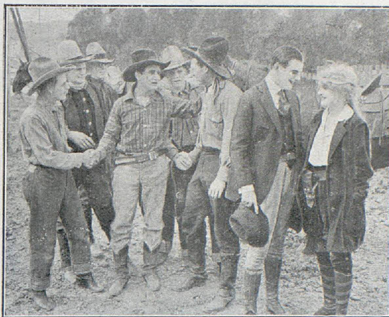
Una escena de la interesante película "El blanco trágico"

Los secuestradores de Beth, lograron ahuyentar el león y la salvaron de una muerte segura. Musa, el fiel criado indio, logró alcanzar a los de la Luna y les atacó por sorpresa. No obstante uno de los indios le dió tan fuerte golpe por la espalda, que le hizo desplomar al