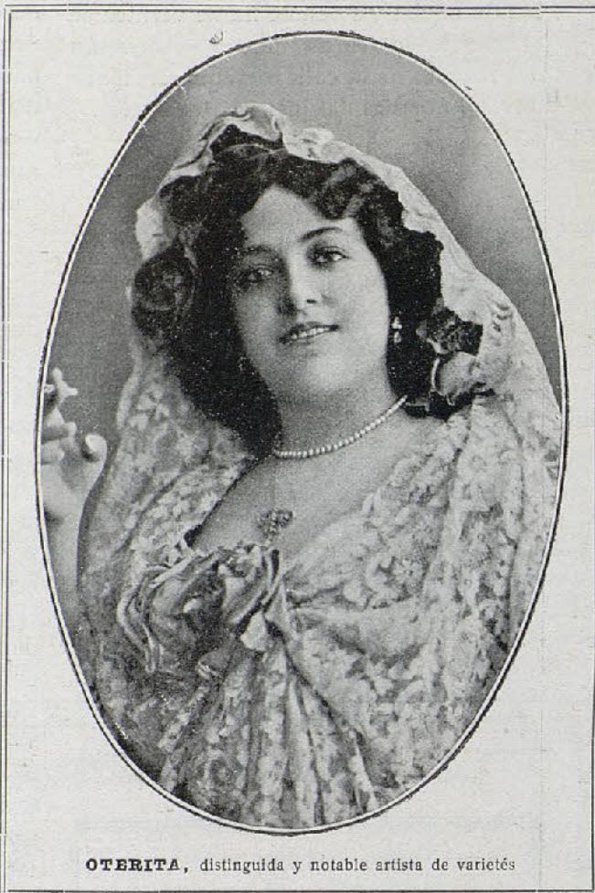
OTERITA, distinguida y notable artista de variedades