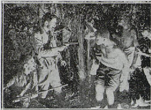
Una escena de la película "Arsenio Lupin"

Egoístas de su dicha inmensa, Pedro y Leda escondieron su amor en una villa lejana; los bellos espectáculos de la Naturaleza, la eterna artista, y las vidas de sus corazones amantes, eran su único mundo. Así vivieron durante algún tiempo, en sublime comunión de amor,