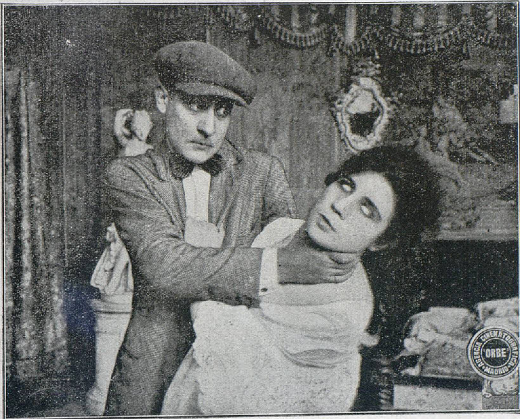
Una escena de la interesante película «La favorita del rey»

Al estallar la guerra mundial, el gobierno del país... convocó a un concurso a todos los fabricantes de aeroplanos, para la adaptación de un modelo veloz. Mister Robert acudió al llamamiento patriótico, presentando los planos de un nuevo modelo de su invención de.