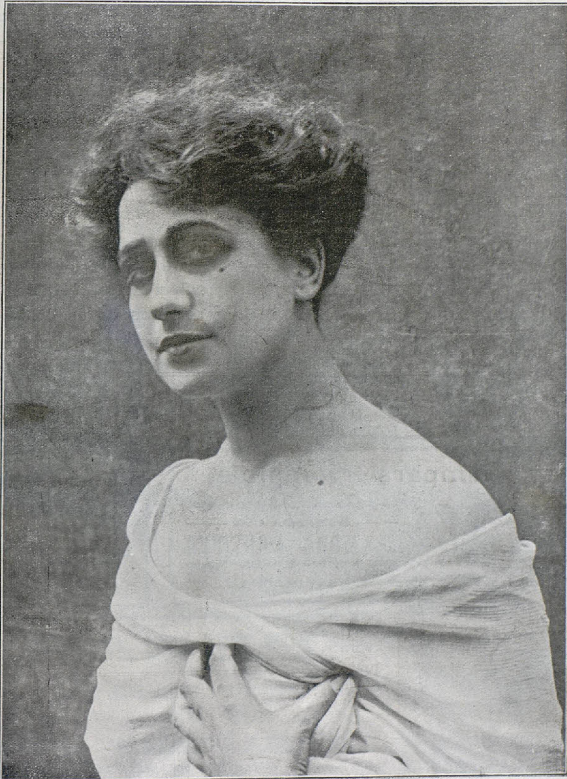
Italia Almirante Manzini

bella y escultural artista italiana que figura al frente de la Itala-Film