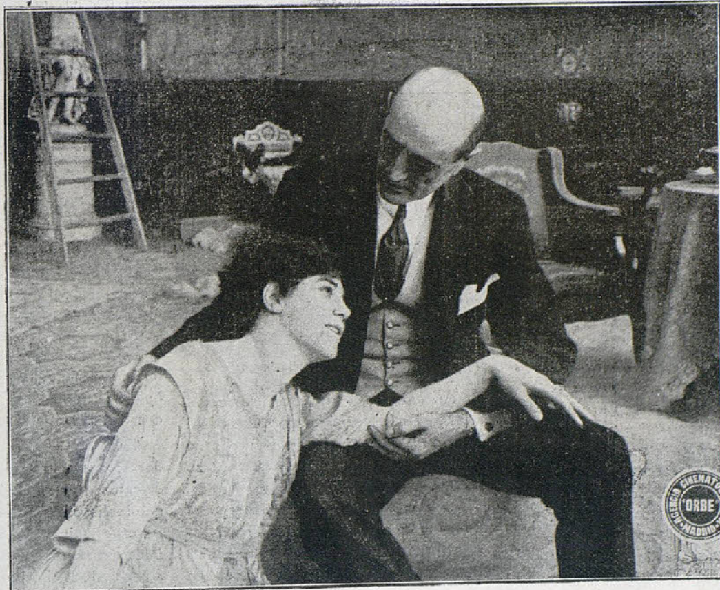
Una escena interesante de la película «La favorita del rey»

Sin dinero ya, sin dinero y sin amistades de pronto, tuvieron que buscar trabajo para poder vivir. Y fué ante los ojos extáticos de un empresario incrédulo, en donde el atleta Castellani recordó sus días de