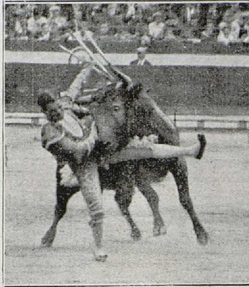
Momento de ser cogido Belmonte al iniciar la faena de muleta en su primer toro.

Al ser cogido Belmonte por el 2.º toro, José cogió los trastos y el bicho,