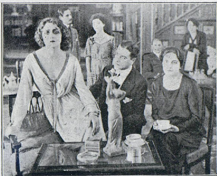
Una escena de la interesante película «La Reinecife Isora»

Y cuando esta escena se desarrolla, el infeliz y terco Guerchard llega al Palacio y se encuentra con que Lupin le ha tomado la delan-