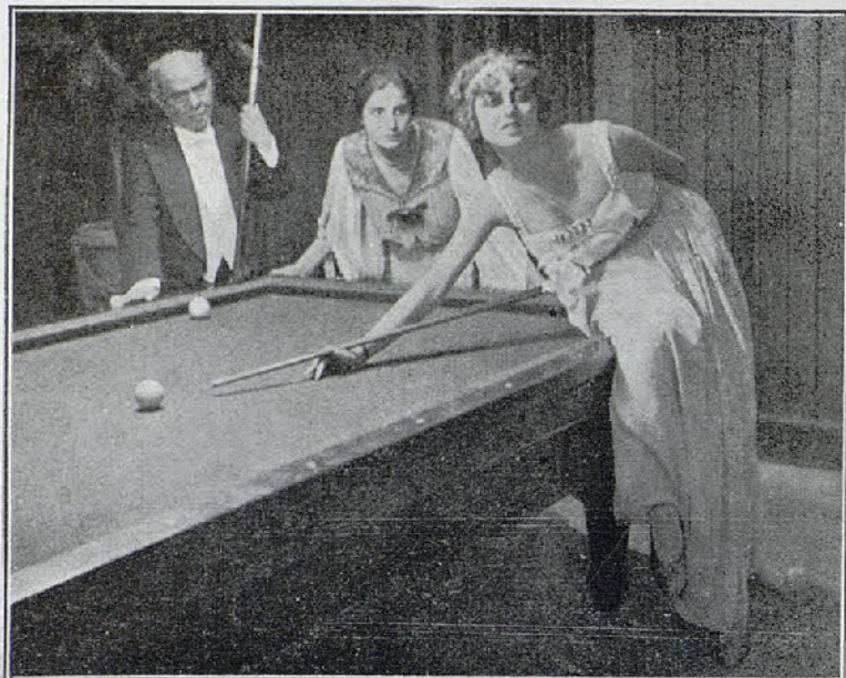
Una escena de la interesante película «La Reinecita Isora»

Debido al rápido desarrollo que en breve