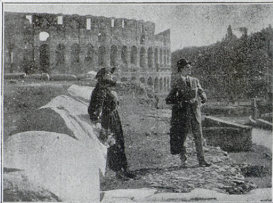
Una interesante escena de la hermosa película «El otoño del amor».

La ornamentación que habrá para armonizar el recuadro de la pantalla cinematográfica con el hemicycle del «Palau de la Música Catalana», ha sido confiada al conocido escenógrafo don Salvador Alarma, quien lo ha dispuesto recordando las dos columnas de bronce, de unos once metros de altura, que Salomón hizo construir por Hiram. Unirá las dos columnas, una imitación del velo sagrado, con bordados de carácter religioso, velo que tapaba el holocausto y candelabro de Moisés el que al descorrerse, dejará al descubierto la pantalla cinematográfica.