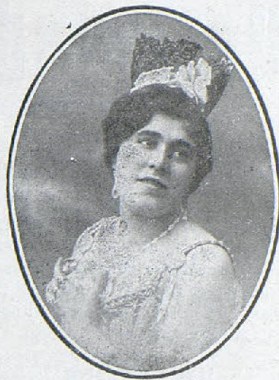
CREACIÓN DE TINA DESMET