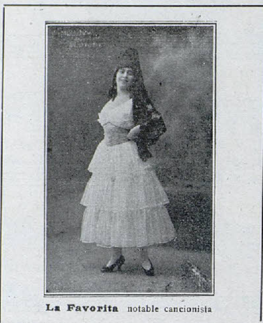
La Favorita notable cancionista

Reciba nuestro querido amigo nuestra entusiasta felicitación.