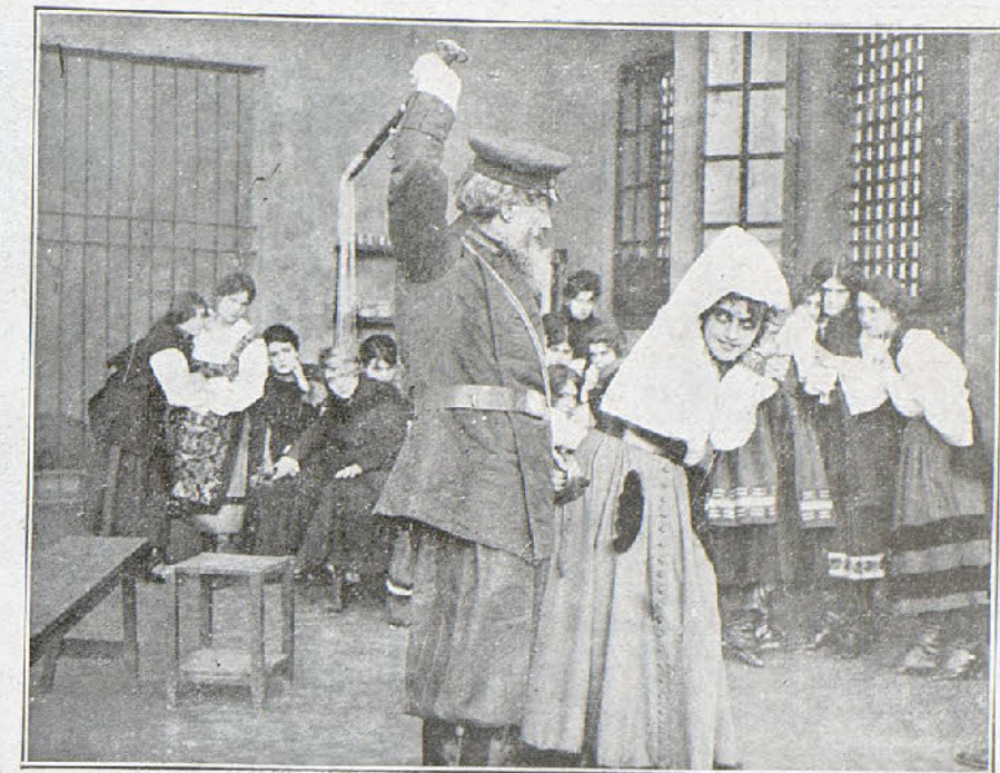
Otra escena de la adaptación cinematográfica de la emocionante novela «Resurrección».

Mientras el terrible desafío tiene lugar y los dos rivales se lanzan a toda marcha uno contra otro, la gentil duquesita Lydia, hija única de los duqueses de Pietanti, sale de su castillo para tomar la limousine que la espera en la puerta en el mismo instante en que los dos rivales se van a estrellar uno con otro, pero temiendo por la vida de la gentil señorita que se ha interpuesto entre ellos y la muerte, por pura casualidad, peran sus máquinas, para no atropellar a Lydia, y descienden para pe-