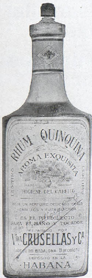
Exijase la firma azul