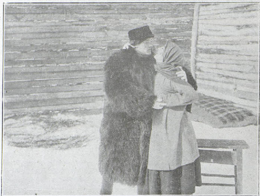
Una interesante escena de la novela cinematográfica «Resurrección».