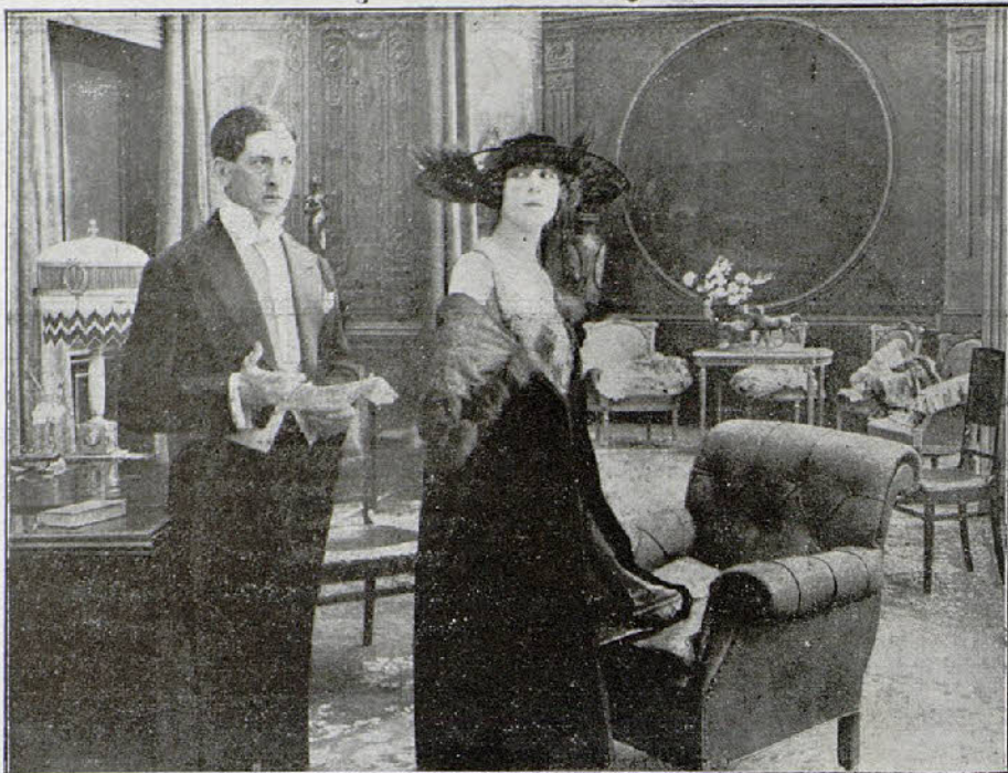
Una escena de la película «Justicia de Bufón»

En este momento Paulina despierta y saltando de la cama se dirige hacia la máquina pensante del profesor Duval de una manera inconsciente como si estuviese atacada de sonambulismo.