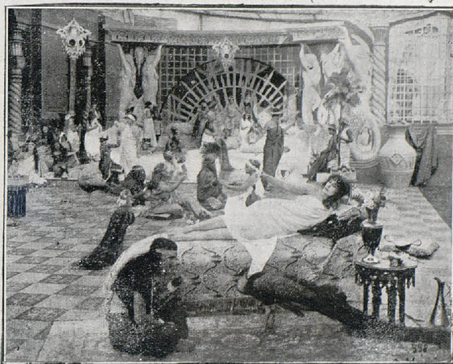
Una escena de la película «La Hija de los Dioses»