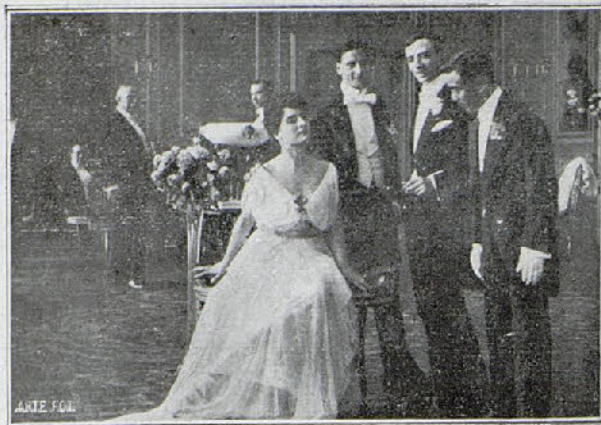
Una escena de la película «Liliana»

Al llegar a casa de sus tías y hallarse ante