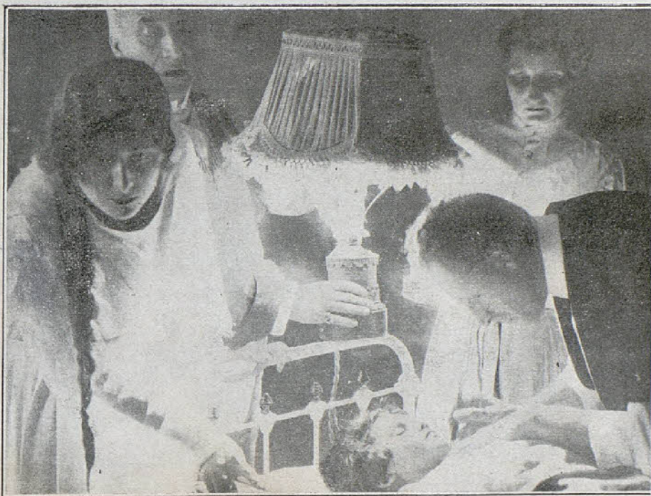
Una escena de la película «El veneno verde» (Intemperancia)

que Judex ha conducido a su prisionero, puede verse en una terraza llena de flores, al exbanquero sentado en un banco contemplando el mar con mirada vaga. Cerca de él se en-