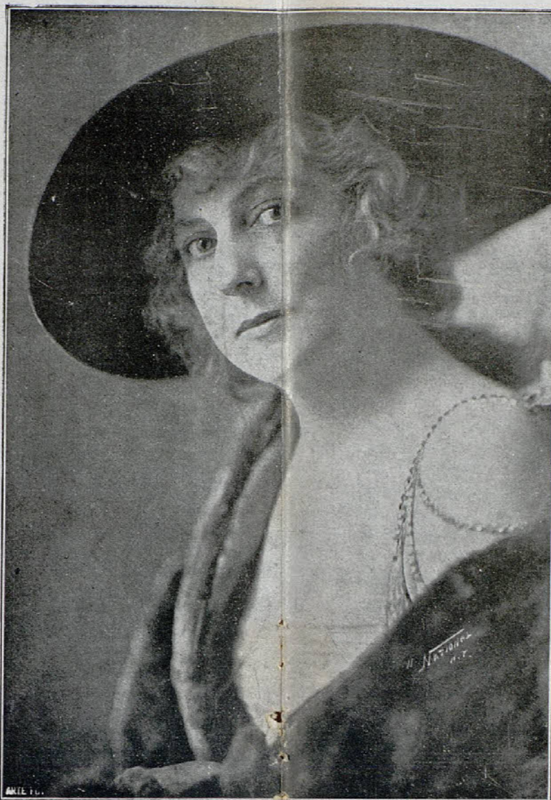
Etna Hunter, genial protagonista de la película «El sello gris»

A la prematura edad de veintitrés años, ha fallecido a consecuencia de un accidente automovilista, la celebrada artista cinematográfica Florerice La Badie.