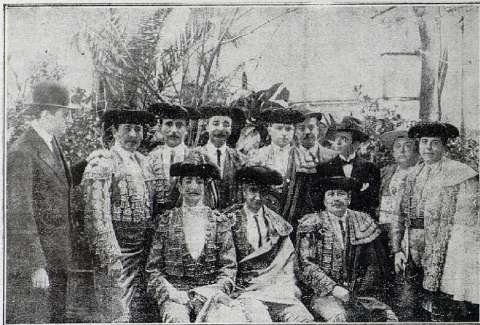
Cuadrilla de jóvenes toreros que el año próximo va a acaparar las contrata. Tienen firmadas corridas en Madrid, Barcelona, Sevilla, Valencia, Bilbao, San Sebastián y Amposta

El Grupo Ojén en la Junta general última, acordó por unanimidad acudir a las próximas elecciones, a cuyo efecto nombrará en breve el candidato que ha de luchar, para ir al Congreso representando una política completamente renovadora.—D. Q.