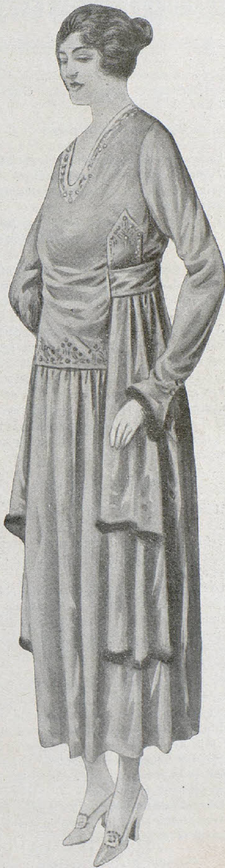
Vestido rosa pálido, cuerpo liso, falda estrecha y faja con doble colgante en los costados. Adornos verdes y morés en la faja y mangas.

Dadas las simpatías con que cuenta este actor,