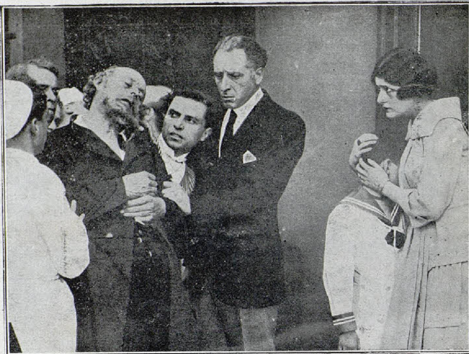
Una escena de la película «El veneno verde»

No hay por qué estarlo,—contesta John y entonces le dá un libro escrito por él mismo titulado «Maternidad.»