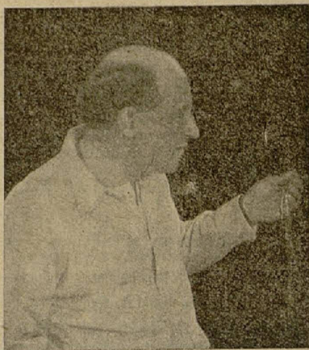
Cecil B. de Mille, el más famoso de los directores de películas de la Paramount

En cambio, hay películas cuyo coste de producción es relativamente económico y los resultados de taquilla obtenidos con ellas no pueden ser más halagüeños. «Humoresque» pertenece a este género de películas. Pocos «films» se