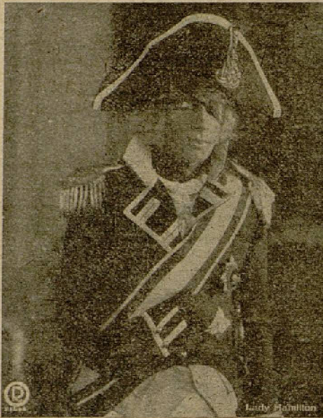
Conrado Veid, intérprete del Almirante Nelson en la película «Lady Hamilton»

Citados para encontrarse en la estación John Harriet recibe un fuerte latigazo que le hace caer sin sentido apenas sale de los umbrales de la casa del detective. Este, se apresura a presentarse en la residencia de los Harriet, teniendo la suerte de que el viejo vizconde ha recobrado el habla y la razón. Y mientras la policía por orden de Mac Allan, persigue a los indios que huyen en un aeroplano, el detective escucha de labios del Vizconde Harriet la siguiente historia: «Donald y yo, conocimos en la India al capitán de buque James Jerome. Eramos íntimos amigos... El Nabab de Bahore, por especiales motivos de agradecimiento, había regalado a Jerome el tesoro íntegro de la diosa Bharani... Recuerdo las palabras que pronunció en aquella ceremonia: Capitán, me has protegido valerosamente contra la secta de los Thag, esos indios feroces y asesinos. Recibe este tesoro en prueba de agradecimiento y de amistad...» Ahora bien, una agrupación de Thag había jurado vengar la muerte de algunos compañeros y recuperar el tesoro de la diosa para reintegrarlo a su templo de la India. Y vuelto a Europa, Jerome recibió la terrible amenaza de los Thags, la hoja de palmera con los signos de la muerte... Con este motivo, nos dijo: «He recibido la hoja de palmera y