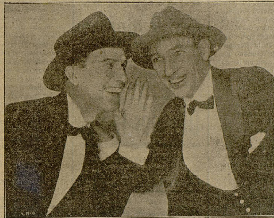
Los aplaudidos cómicos Lians y Moran en «La noche maldita»

Vilaseca y Ledesma. — Se pasaron en prueba «¡Ojo con los papeles!», y los episodios 5, 6, 7 y 8 de la serie «Aventuras de Ruth», que en nada desmerecen de los anteriores.