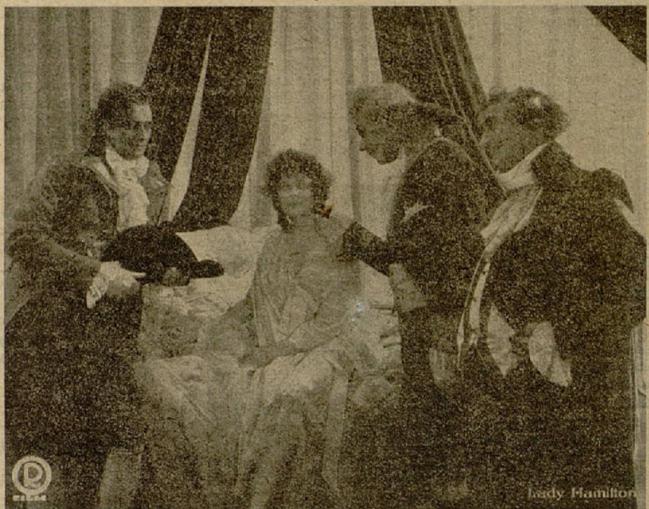
«Lady Hamilton o el alma de Nelson»