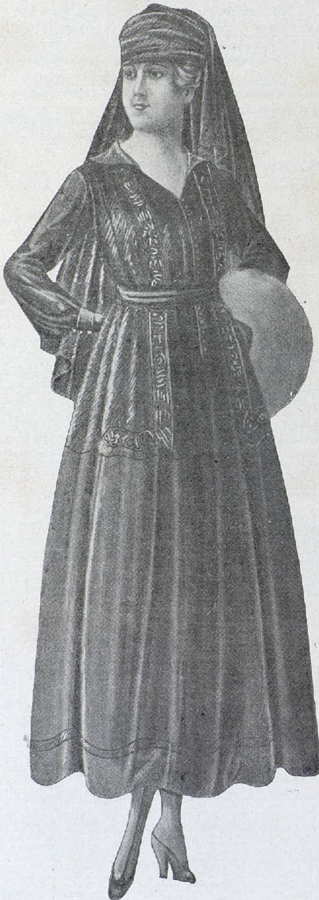
Vestido de luto, de jerga, combinado con crespón inglés y blés de satén bordado de trencilla. Fruncido en la cintura y liso.

En el último acto, Rafaelita llevaba enguanta-