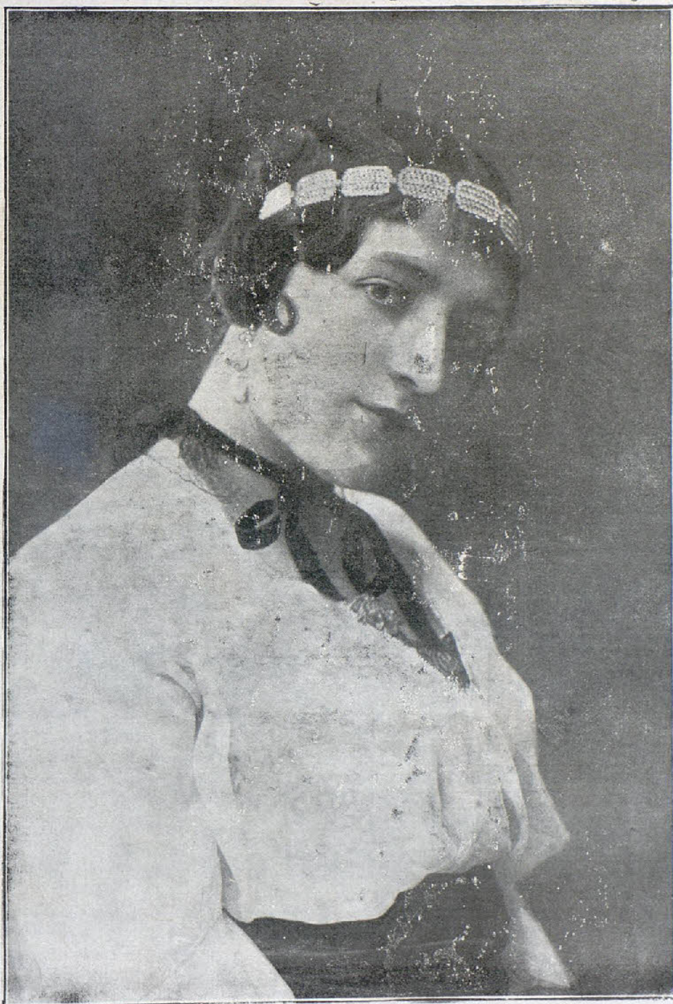
PRECIOSILLA, afamada cupletista, que ha alcanzado grandes éxitos en el music-hall «Monte-Carlo».