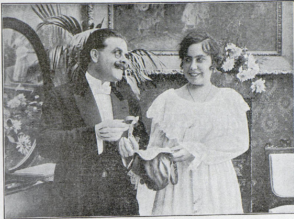
Una escena de la película «Las joyas de la condesa»

Una noche, partió Anita a un baile de más-