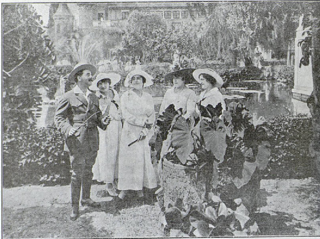
Una escena de la película «Las joyas de la condesa»

Representante: A. AMBROA CLARIS, 80 BARCELONA