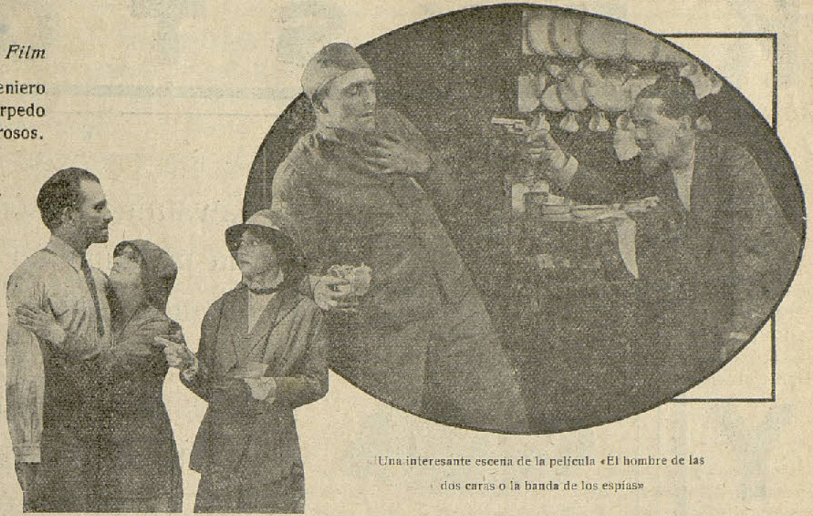
Una interesante escena de la película «El hombre de las dos caras o la banda de los espías»

Un nuevo amigo vela por Lyndon. El espíritu curioso y justiciero de Latimer se interesa por su suerte. Un periódico que lee el detective anuncia que Lyndon, en virtud del ruego de toda Liria, ha sido indultado, que pasará su vida en un presidio. La sagacidad de Latimer adivina, piensa en la Banda de los Espías... Y