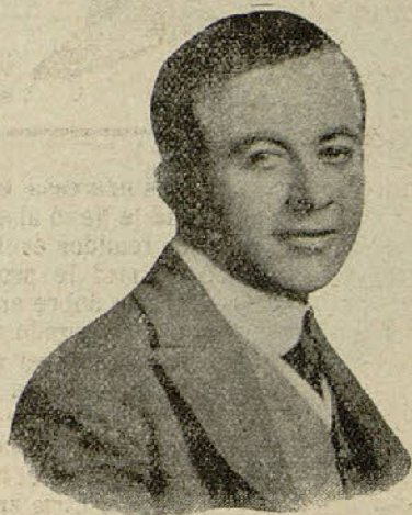
CHESTER CONKLIN, famoso artista intérprete de los Keystone, como es en realidad

A los ensayos de la casa Keystone presentados como películas en una parte, ha conseguido la producción de las verdaderas Keystone en dos partes, obras orgullo de Mak Sennet, el genio revolucionario del arte cómico