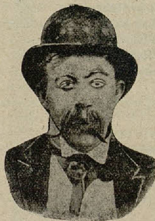
CHESTER CONKLIN en su creación de «JOSÉ» con la cara que el público le admira