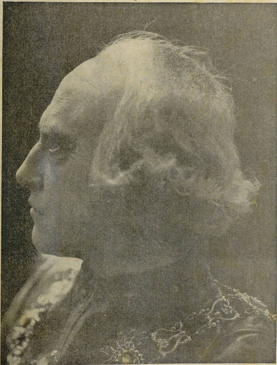
GEORGES WAGUE, profesor de mímica del Conservatorio de París, intérprete de la película