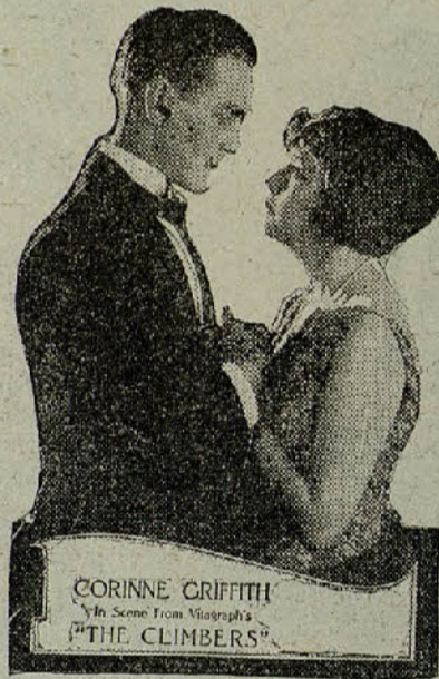
CORINNE GRIFFITH In Scene from Viagraph's "THE CLIMBERS"

Los dos amigos regresan a su posada. Una sorpresa les espera: Carta de Silas Toronthal para Sarcany. Tal vez cause extrañeza que un personaje como el banquero hubiese podido establecer relaciones con un sujeto de tan ínfima categoría. Así era, sin embargo, y estas relacio-