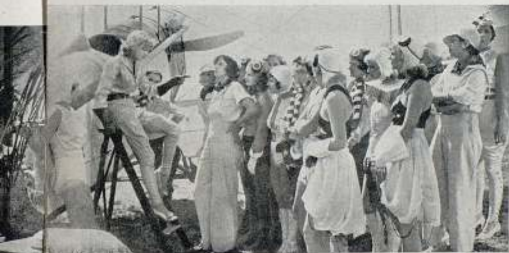
¿Qué dirá Ginger Rogers a estas chicas?

una gran película de Radio-Films que se estrena en breve