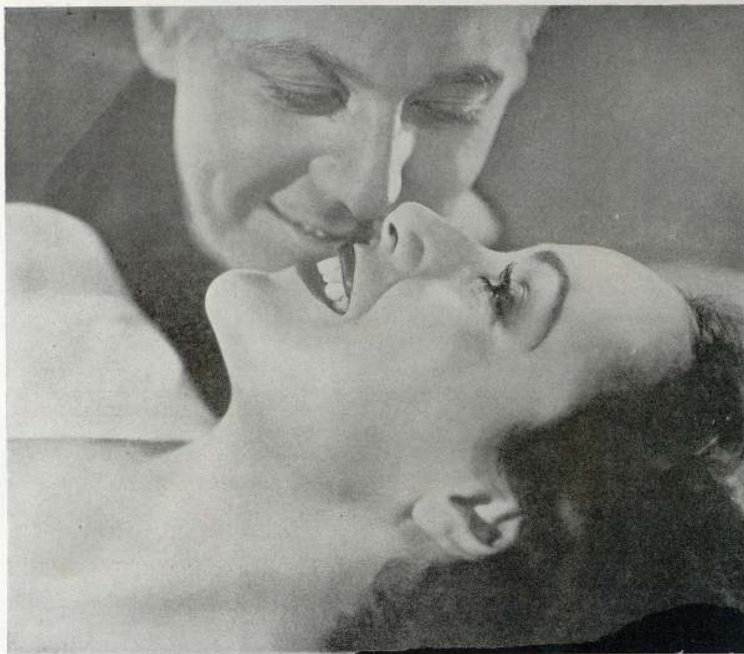
Espíritu y cuerpo patentes en Dolores del Río, con Gene Raymond, en esta foto

Dolores del Río, Raoul Roulien, Gene Raymond, Gingers Rogers, Fred Astaire