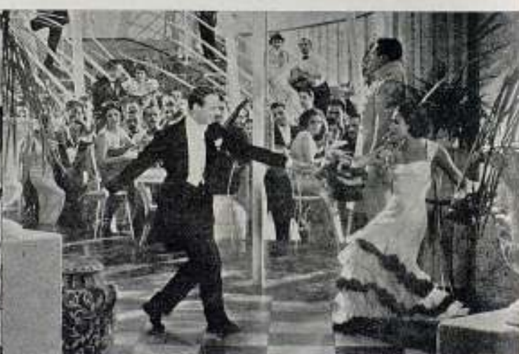
Una exhibición coreográfica de Dolores y Fred Astaire