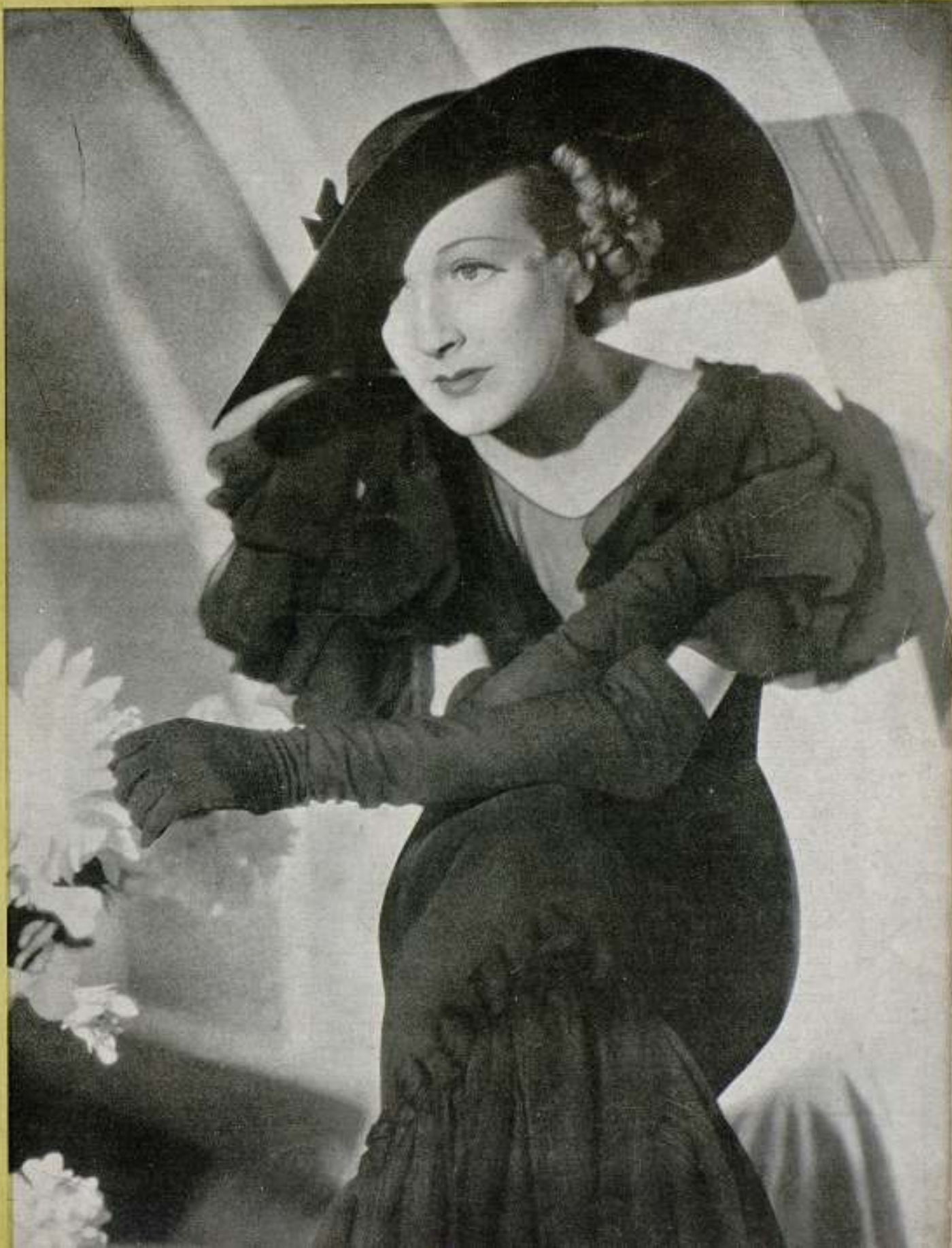
GERTRUDE MICHAEL, bella mujer y pres- tigiosa artista de Paramount