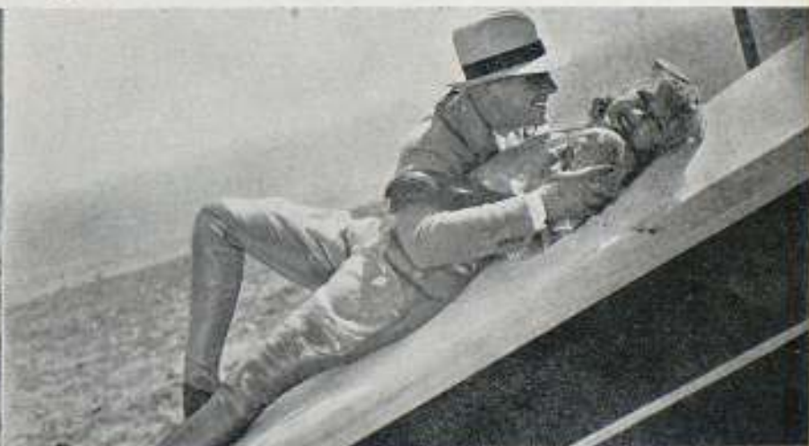
Inaudita escena de amor: Gene Raymond y Ginger Rogers volando...