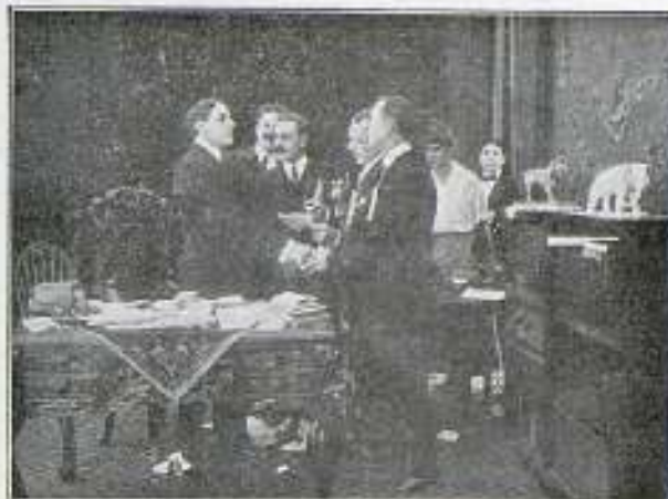
«El altar de la ambición»