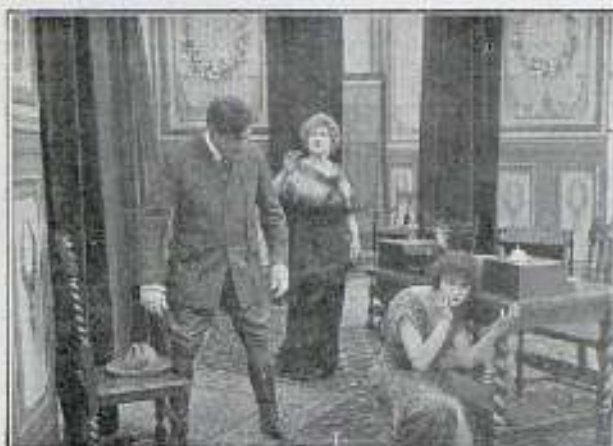
«El altar de la amorición»

El conde de Rimoff, vivió largos años al