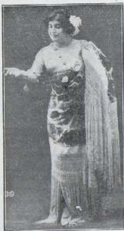
Rosarroción Quijano hermosa y gentil cupletista