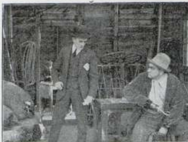
En la senda

Justamente orgulloso, nuestro héroe traba conocimiento con la linda «mecano» y le comu-