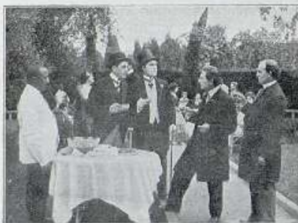
El altar de la ambición.

Al abrir la puerta, una nube de humo acre invadió la estancia, y desde allí asistió horrorizada a las diferentes fases del combate. En la barricada construida al lado de la fuente