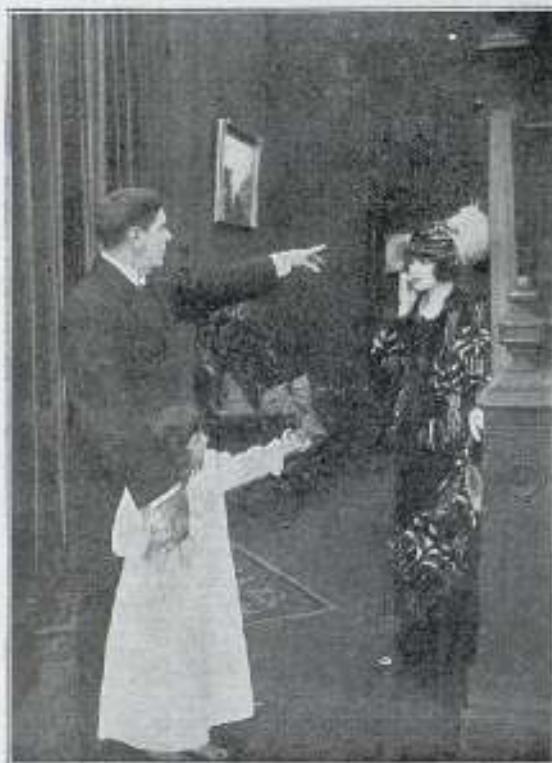
«El altar de la ambición»

Bernard el industrial tiene dos hijos, Claudio y Sergio. Claudio es un calavera empedernido que se gasta en los círculos del vicio cuanto cae en sus manos, y que, para satisfacer las necesidades de su vida licenciosa no tiene inconveniente en falsificar la firma de su padre en una letra de alguna importancia.