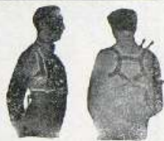
Con Benefactor El Benefactor de espalda

Riera San Juan, 8 - BARCELONA que mandará folleto gratis a quien lo pida.