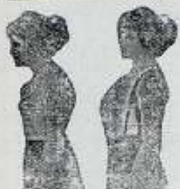
El Benefactor. Con Benefactor

Para los envíos por correo se ha de acompañar al importe 25 céntimos para el certificado