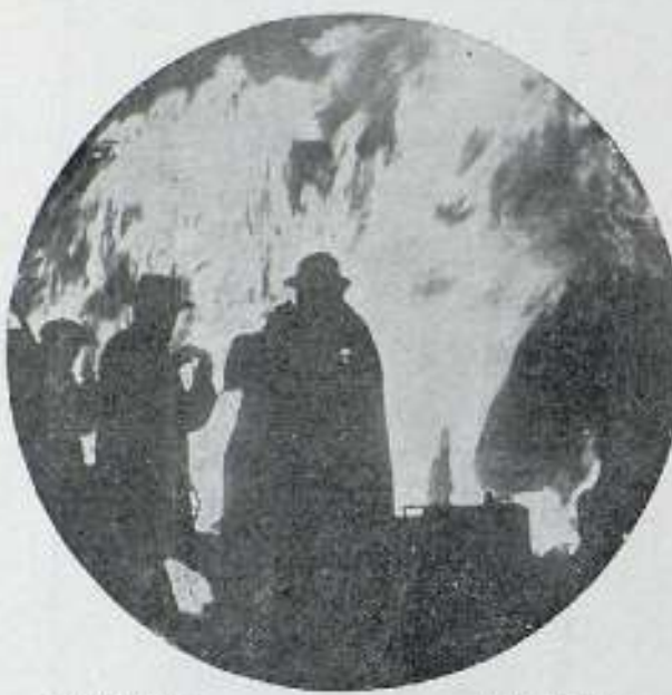
«En mala senda»

El primer cuadro es movido y alegre; el segundo decae, a mi juicio, un tanto; y el mejor, el más interesante, el tercero, con el