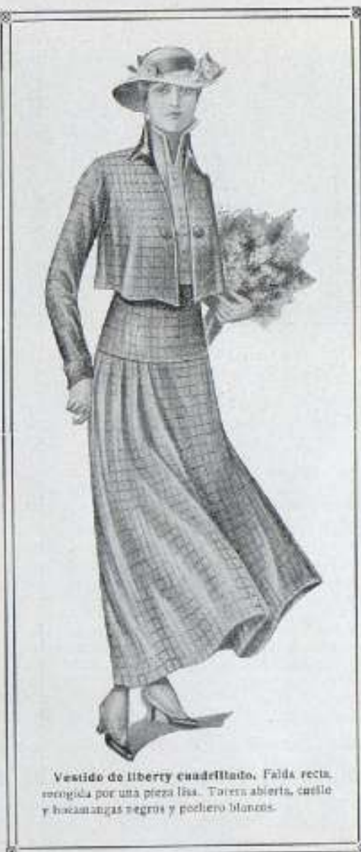
Vestido de liberty cuadrado, falda recta, recortada por una pieza lisa. Torsos abierta, cuello y bocanillas negras y poché blancos.

ÚLTIMA CREACIÓN EN ABRIGOS SECCION A MEDIDA