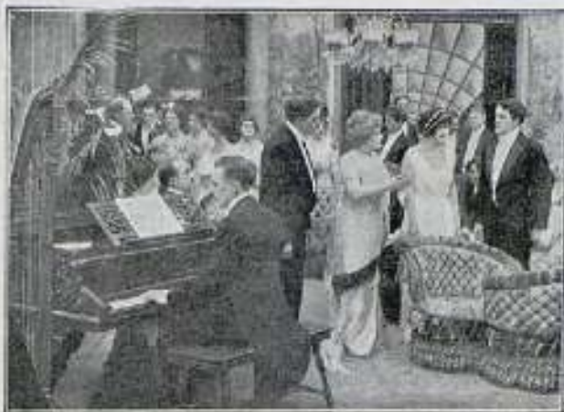
«El altar de la ambición»