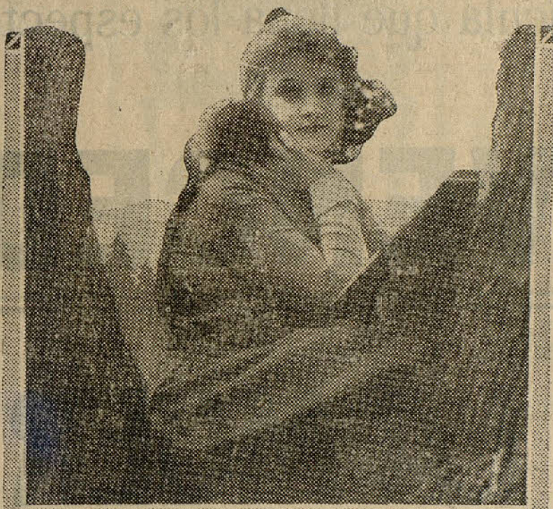
BILLIE BURKE in "Let's Get a Divorce" A Paramount Picture

La simpática María Osborne y su amigo el África dan lugar en esta comedia familiar a una serie de escenas tan deliciosas y de tanto candor, que admiran y distraen a la vez que enseñan cómo puede una niña de talento llevar la felicidad a un corazón y la tranquilidad a una casa, como ocurre a la abuelita de Mary, que siendo una señora de genio adusto y a quien molestaban los chiquillos, después que tuvo en su compañía a su nieta cambió de tal manera en su genio y en sus costumbres que parecía otra señora, hasta el punto que ya no quiso separarse más de su adorable nietecilla.