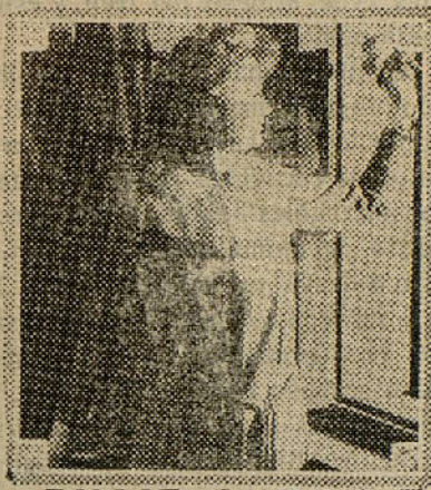
BILLIE BURKE in "Let's Get a Divorce" A Paramount Picture

Sentado en una roca, en actitud de honda meditación, estaba el que poco