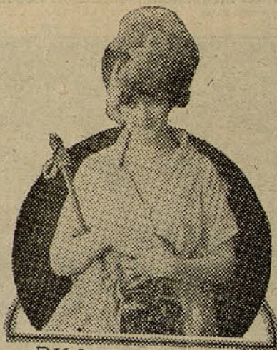
BILLIE BURKE in «Let's Get a Divorce» A Paramount Picture

La mejor prueba de que Locklear se daba cuenta del gran peligro que corría en sus extraordinarios vuelos, es que siempre llevaba consigo una carta «urgente» dirigida a su madre y que jamás se separaba de la placa de identificación