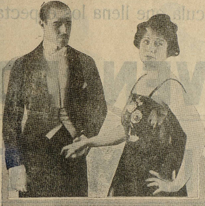
THOMAS HINCE presents DOROTHY DALTON in "Love Me" A Paramount Picture

Ante esto, la señora Appleby, la correcta, la implacable, es la primera de rendirse ante su nuera y pedirle cómo podrán pagarle el favor que les ha hecho. «Amadme», contesta sencillamente Maida.