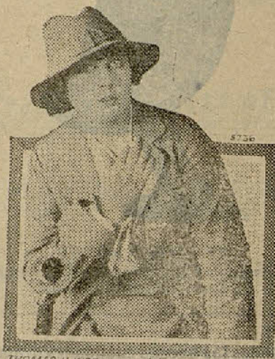
THOMAS H. INCE PRESENTA DOROTHY DALTON in "Love Me" A Paramount Picture