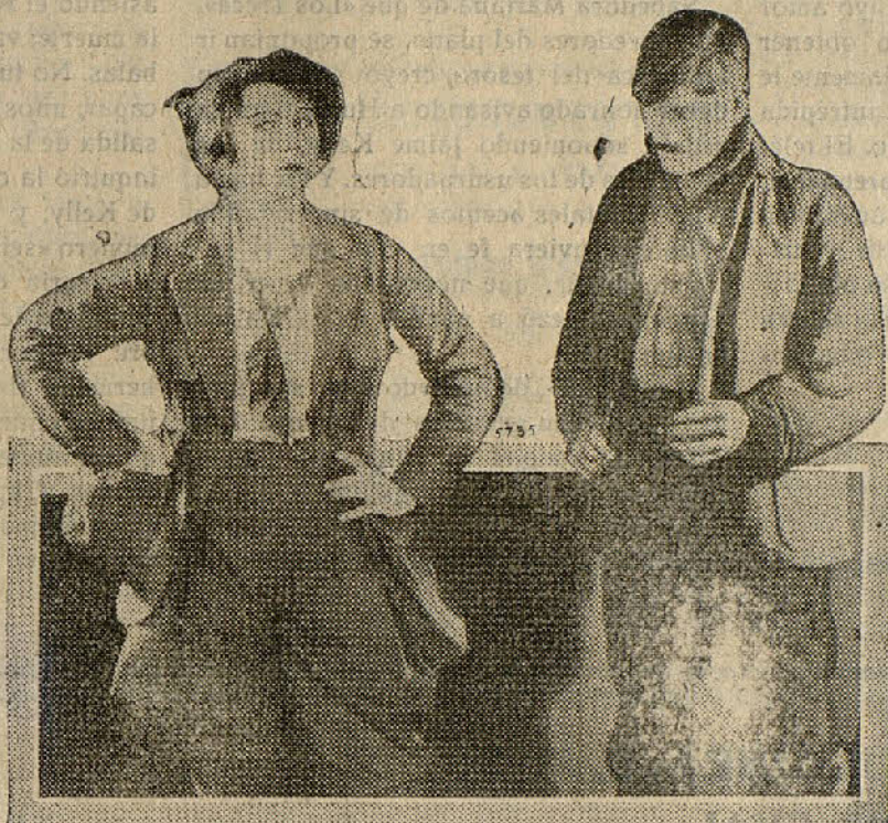
Thomas H. Ince presents DOROTHY DALTON in "Love Me" A Paramount Picture

En la cámara Negra fueron congregándose los «números» de la secta implacable, que parecían surgir de entre las tinieblas como apariciones de ensueño. Un imponente silencio tumbaba en la estancia. Mudas permanecían las lenguas... Órdenes y pensamientos eran transmitidos por escrito... Buscábase un práctico para abrir la caja de caudales que encerraba el plano de la hacienda de Kelly, cuando se observó la presencia