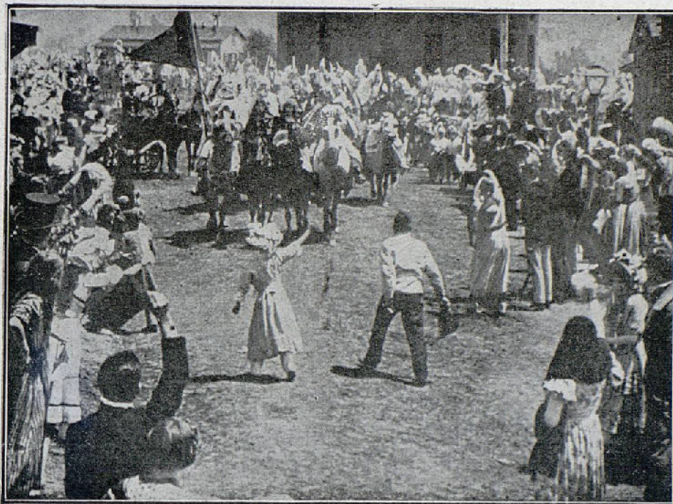
Una interesante escena de «El nacimiento de una nación»

una franca acogida en la casa del obispo, que le dió de comer y le albergó, no sin la muda protesta de su hermana, Baptista, y de su criada, Magloria. Juan Valjean cayó rendido en el mullido lecho; pero de madrugada, despertóse. El recuerdo de los cubiertos de plata que había visto guardar a la criada en una alacena próxima obsesionaba su mente. Levantóse con sigilo, y tomando de su morral un taladro de cantero, dirigióse de puntillas hacia el lecho donde dormía