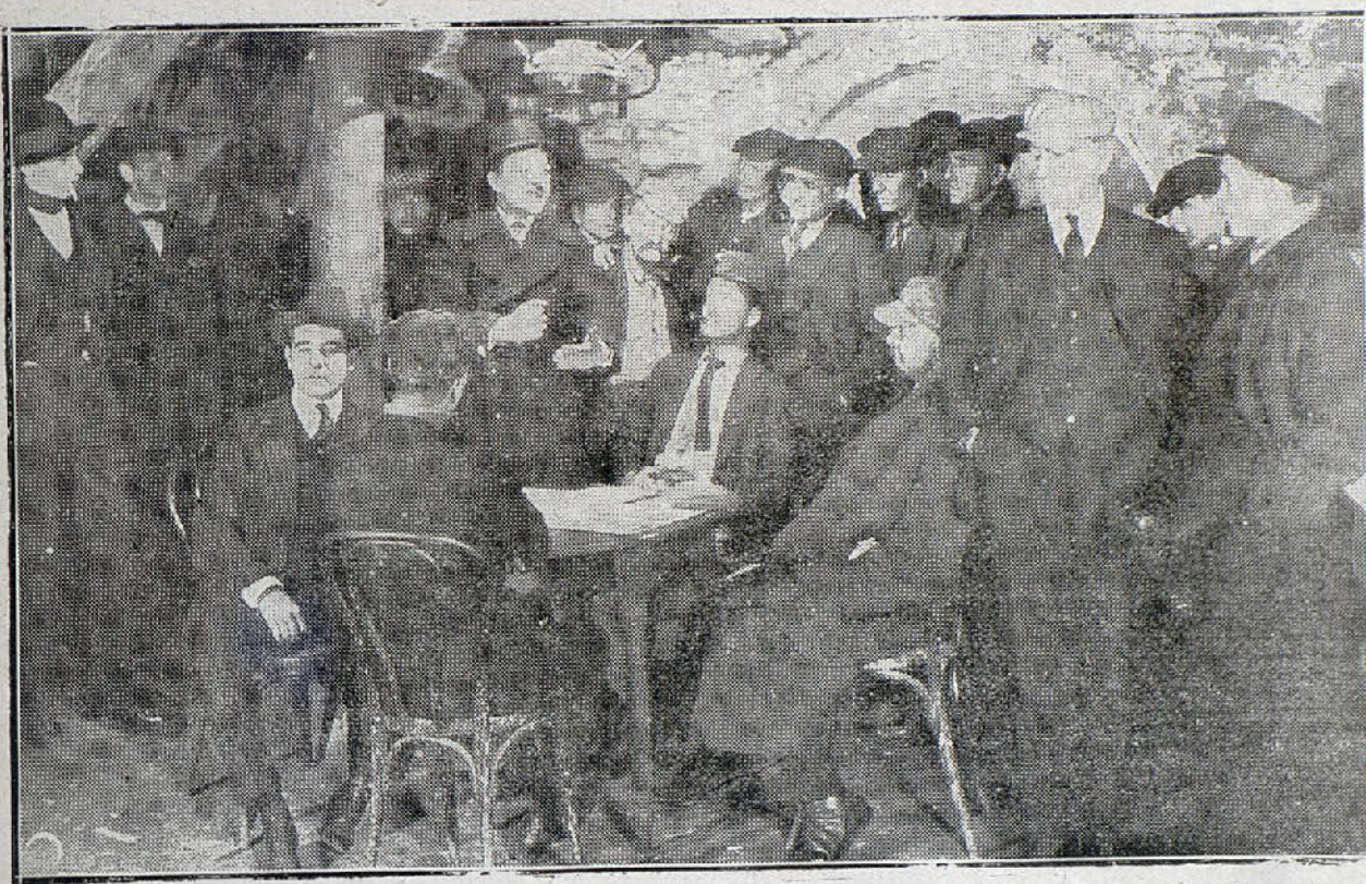
Una interesante escena de la película de series «El caso Carter»

vida ni quitar de ante sus ojos el prisma a través del cual ve un porvenir de tintes sombríos. Oprimido por el miedo su corazón, Carter pasa la mayoría de sus horas en «El Cuarto de los Enigmas», explorando con su telescopio la proximidad de los peligros que amenazan su existencia.