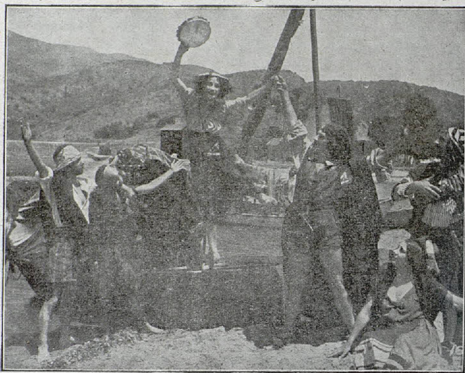
Una interesante escena de la película «La mura de Portaci»

Julio César. —En la sala de proyecciones de esta Casa se pasó «El billete de lotería», preciosa comedia dramática en cuatro partes, en la que figura como protagonista la renombrada actriz alemana Henny-Porten, a la que hacía varios años no teníamos ocasión de admirar.