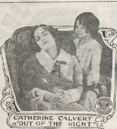
CATHERINE CALVERT IN "OUT OF THE NIGHT"

La estratagema del tutor no da resultado, pues al verla arruinada, Harvey no la abandona y le ofrece la mitad de sus beneficios; pero las obras no se venden, a pesar de que él finge fabulosas ofertas