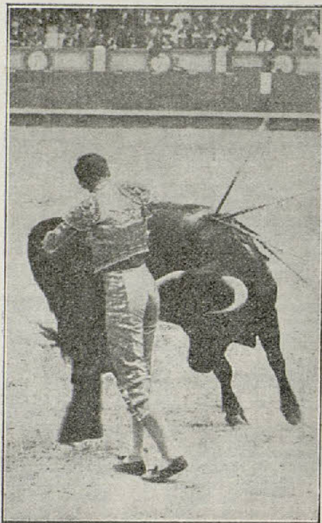
MADRID - Joselito en 1919

El característico pase ayudado por bajo, de Joselito