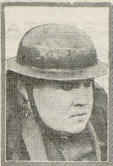
REX BEACH'S TOO FAT TO FIGHT with FRANK MCINTYRE Goldwyn Release

Aprovechando la ocasión de que han venido a cobrar varias facturas de sombreros y vestidos a cargo de June, la llama a su despacho y la dice que por aquel procedimiento, pronto la ruina, con su negro cortejo de fiscales y acreedores, alguaciles y embargadores, llamará a su puerta. La hermosa June se asusta; pero recordando la inagotable inspiración de Harvey, acude a visitarle, acompañada de la esposa del tutor, para proponerle hacer un negocio editorial a base de la