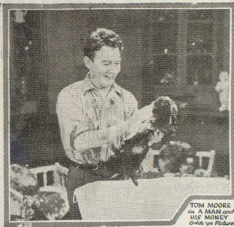
TOM MOORE en A MAN and HIS MONEY Goldwyn Pictures

viniese a renovar el aire de aquellas habitaciones silenciosas y frías. Y en medio de un amor sereno y apacible, entre risas y besos, un año pasó rápidamente. Y llegó por fin el gran día en que las bellas promesas se cumplieron y aquel amor fructificó; nació un niño, poniendo en peligro la vida de su madre. Pero después de unas interminables semanas de angustia y de zozobra, aquellos dos seres tan queridos se salvaron, para labrar la felicidad del hombre triste.