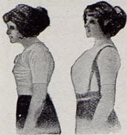
Sin Benefactor Con Benefactor