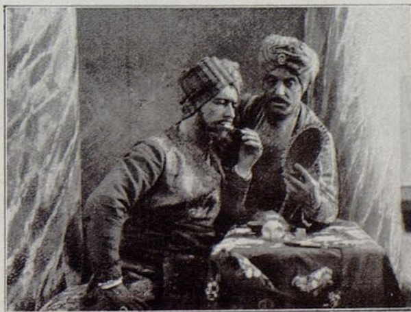
Una escena de la película El beso mortal .