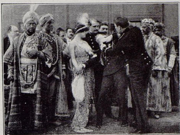
Una escena de la película El beso mortal .