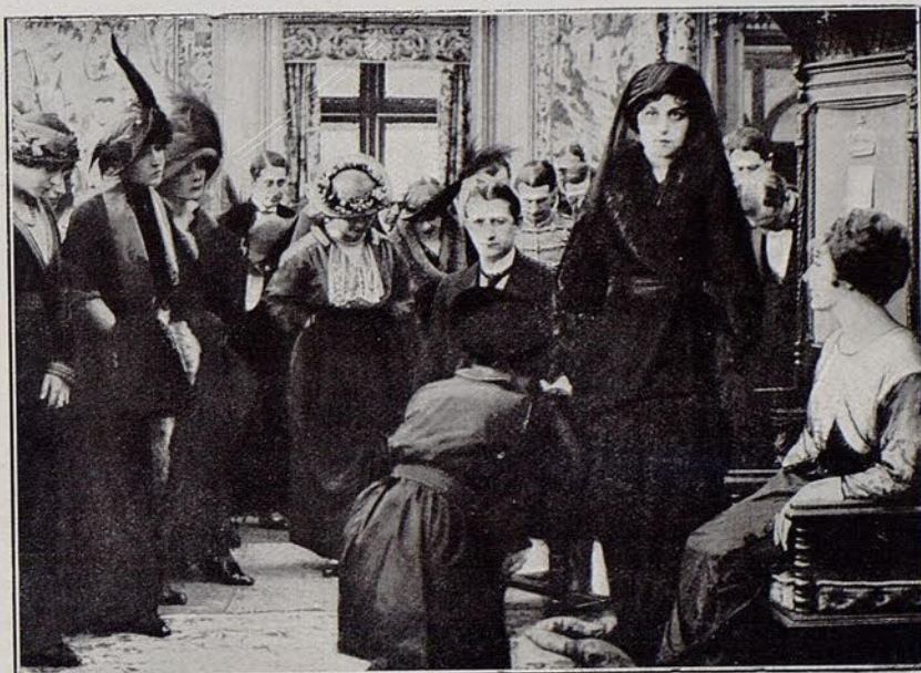
Una escena interesante de la película El calvario de una Reina (Pathé).