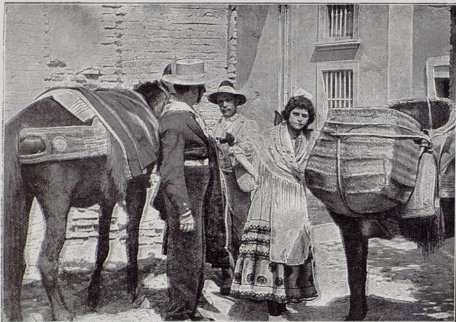
Una escena interesante de la película Pepita la Gitana . (Gaugmont).

go, en verse turbado por el amor exclusivo que la joven madre profesa a su hijo y en busca de distracciones, un azar le hace conocer a la hermosa condesa Yolanda de Chesnaye. El encuentro es fatal para ambos, pues, el amor ardiente y tiránico de su hermosa vecina le lleva mucho más lejos de lo que había previsto. Genoveva descubre su secreto, y ensaya, inútilmente, de reconquistar el amor de su marido. Desesperada por la traición del hombre por el que continúa sintiendo, más que amor un culto exclusivo, y enloquecida al pensar que va a perderle para siempre, Genoveva to-