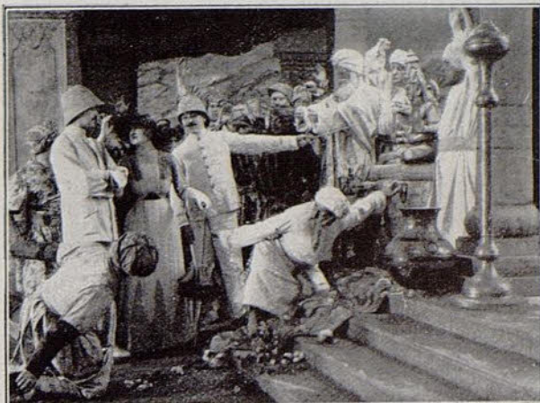
Una escena de la película El beso mortal .

esfuerzo para disimular su sorpresa, y ofrece el brazo a la joven señora para acompañarla a la mesa; luego se sienta a su lado.