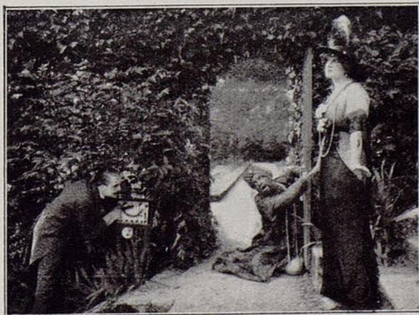
Una escena de la película El beso mortal .