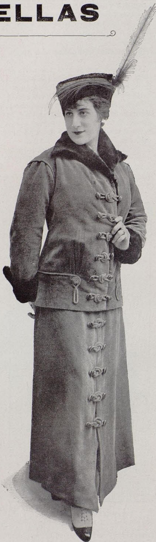
Traje sastre en tigrine, cuello y puños nutria

Por esto el romanticismo, teniendo una base fundamental, el amor, ofrece manifestaciones incontables.