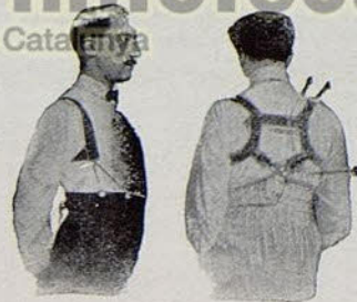
Con Benefactor El Benefactor de espalda