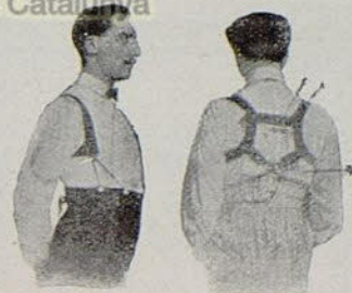
Con Benefactor El Benefactor de espalda

Riera San Juan, 8 - BARCELONA que mandará folleto gratis a quien lo pida