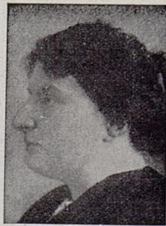
Después del tratamiento

Arrugas, manchas y cicatrices. Erupciones y enfermedades de la piel. Corrección de la nariz. Extirpación eléctrica del vello. Calvicies y caídas de cabello, curación de la obesidad, sin medicamentos, masaje, manicura, etc.—Pídase folleto.—Información gratuita a las 11 y a las 4