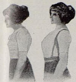
Sin Benefactor Con Benefactor