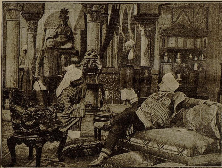
Un día recibió el potentado la visita de despedida de un oficial del ejército inglés... (Gaumont)

de trenes operaba preferentemente en las líneas de las grandes plazas marítimas.