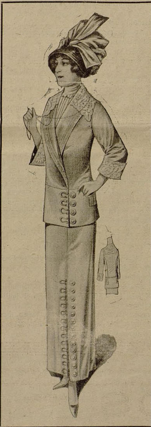
Traje de paseo, en esponja color madera. Falda con un pliegue anterior abrochado por grandes botones. Chaqueta cerrada, con banda en el bajo y botones como en la falda, y cuello y bocamangas de hermoso encaje de Cluny.

Excepción hecha de los trajes prácticos «estilo sastre», más o menos elegantes y guarnecidos; trajes estimados, además, como confortables en los días frescos que tampoco, y por suerte, faltan en verano, casi todas las verdaderas toilettes de vestir siguen siendo de seda.