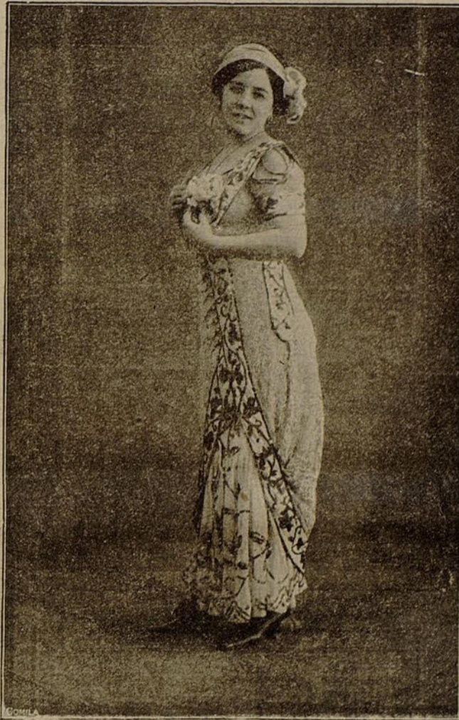
Notable y bella cupletista

cachito de erudición, colado arbitrariamente, por cierto—Raquel escuchaba ambiciosa desde su principado, los riegos a ocultas frondosidades de los principados vecinos.