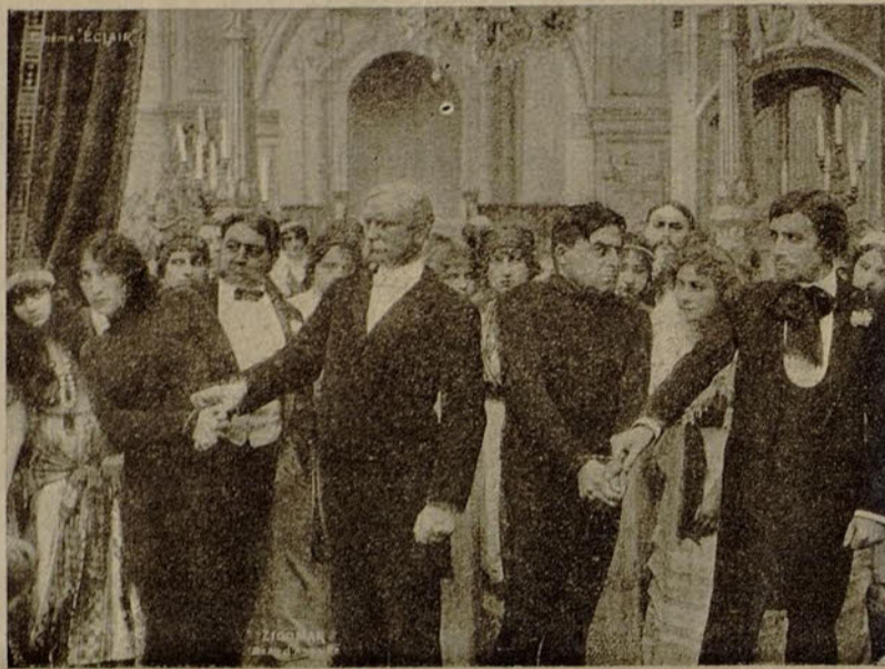
Una escena de la película 'Zigomar'

Rocca, al desembarcar, encontró a Miss Norah, quien le puso al corriente de la