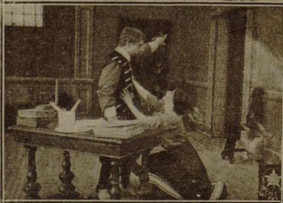
Dos escenas de la película «El espía»

Le felicitamos por la importante representación que ostenta.