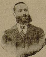
Fundador del Kefirógeno

Especialidad en horchatas y jarabes superfinos, preparado con el zumo de las frutas Expéndice en Droguerías, Colmados, Ultramarinos y Botillerías Caramelos y pastillas de café con leche para Cines y Teatros