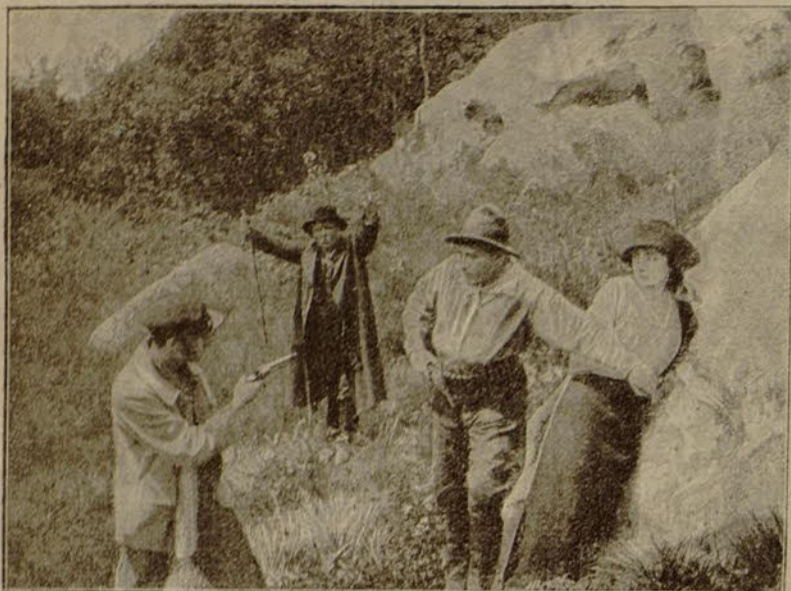
Una escena de la película «Tumba de Oro»

Tras un juicio sumarísimo son condenados a la horca, sordos a los clamores desesperados de la desgraciada Betty, que tiene que asistir