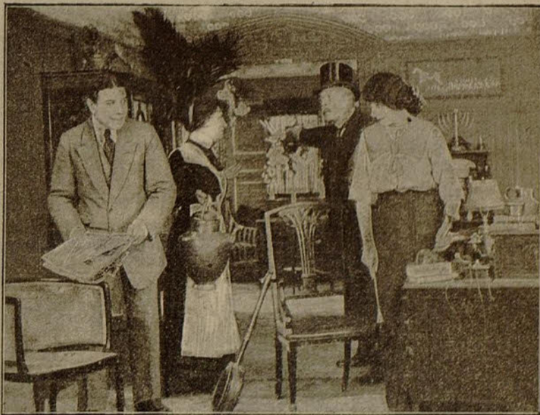
Una escena de la película «La tumba de oro»

En vano buscan aquellos por la montaña el soñado filón, cavando infatigablemente en su suelo duro, pedregoso y esforzándose en arrancarle su secreto. Nada se ha descubierto. Ni la