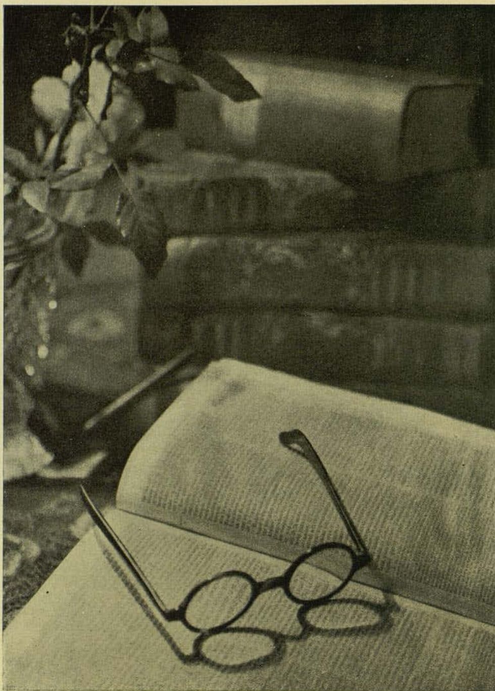
BODEGO (PAUSA) BROMUR