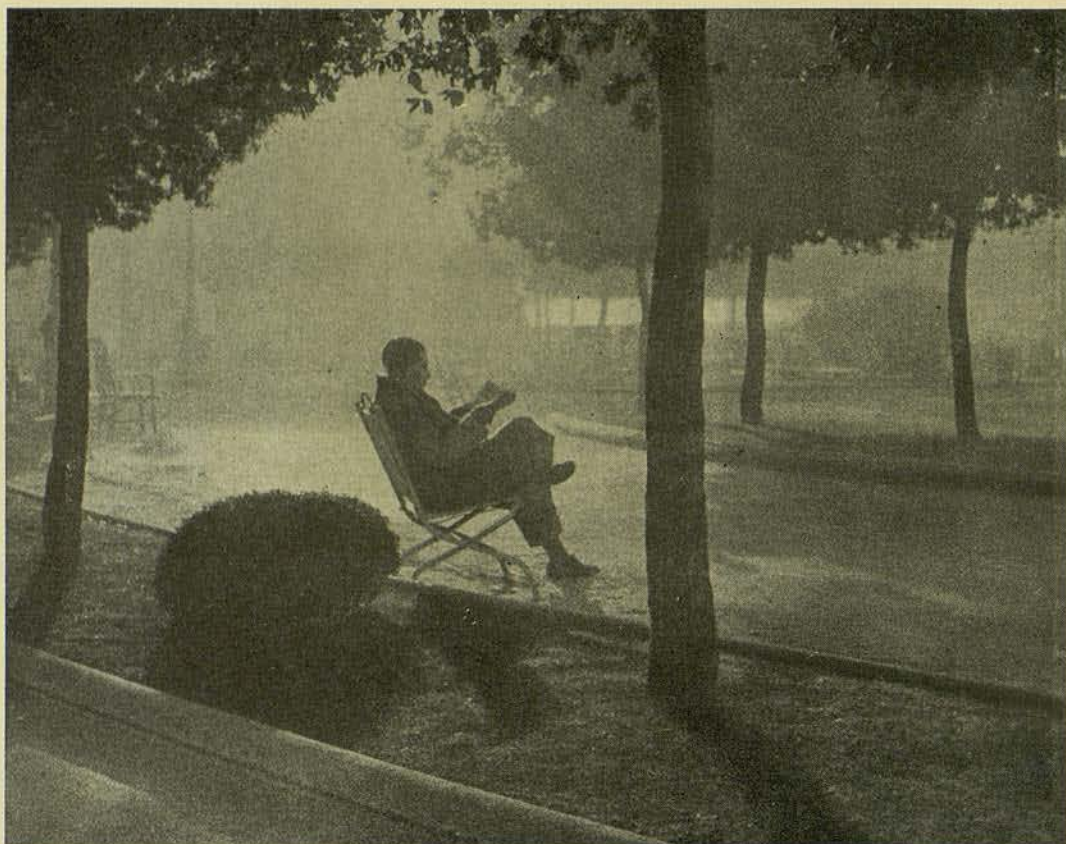
DE BON MATÍ... BROMUR