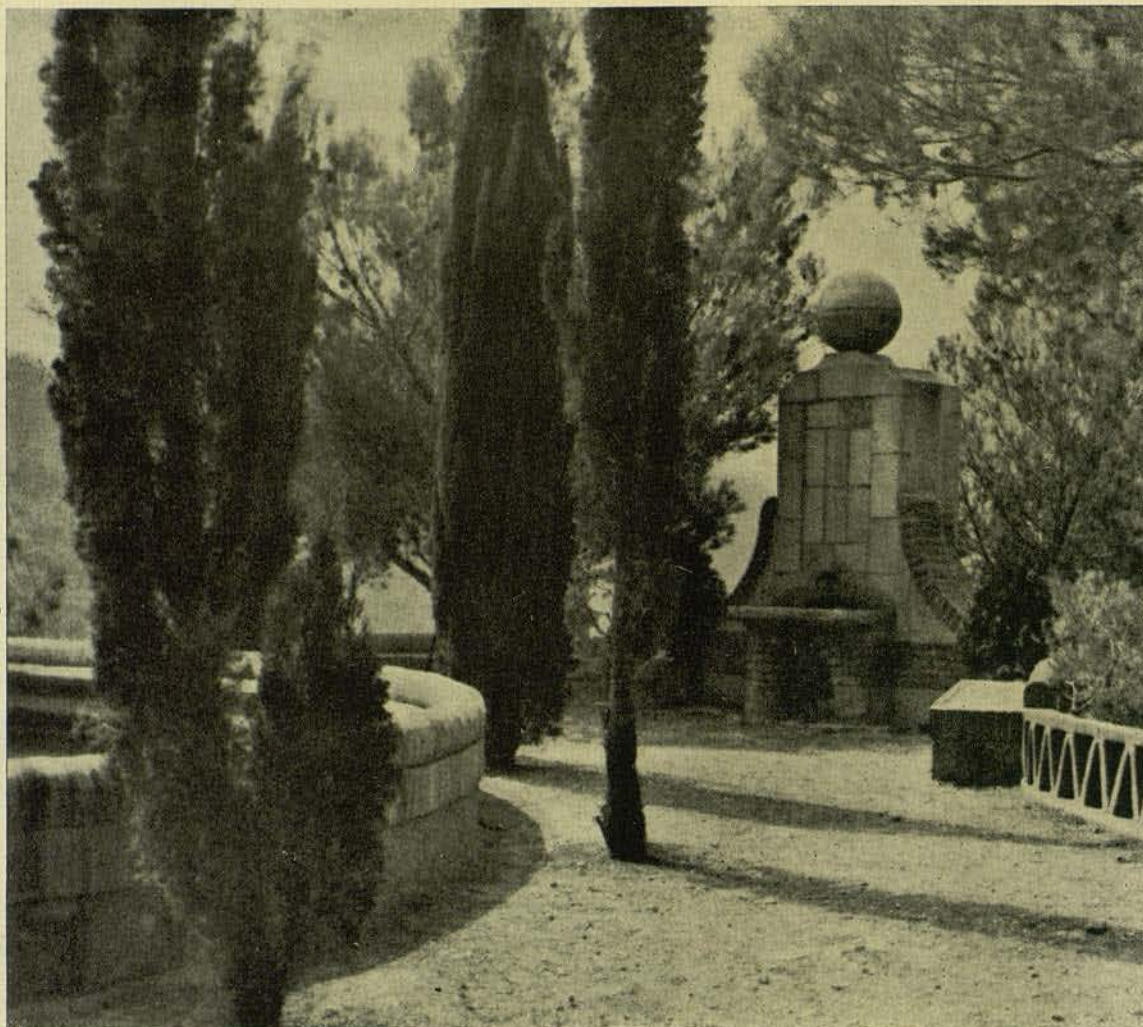
JARDÍ ROSSINYOLENC... BROMUR