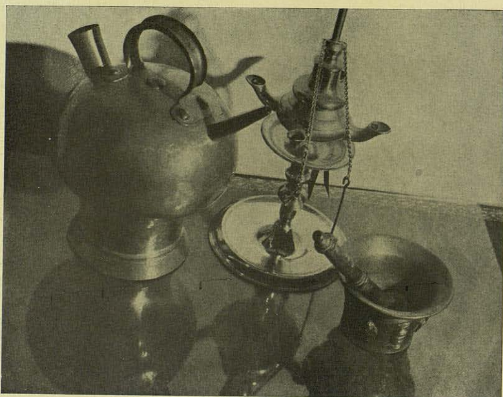
ART VELL BROMUR