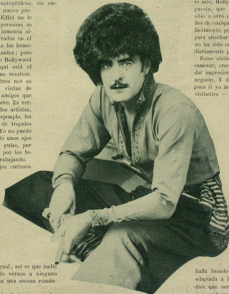
El gran actor John Gilbert en su última película, interpretando un personaje cosaco