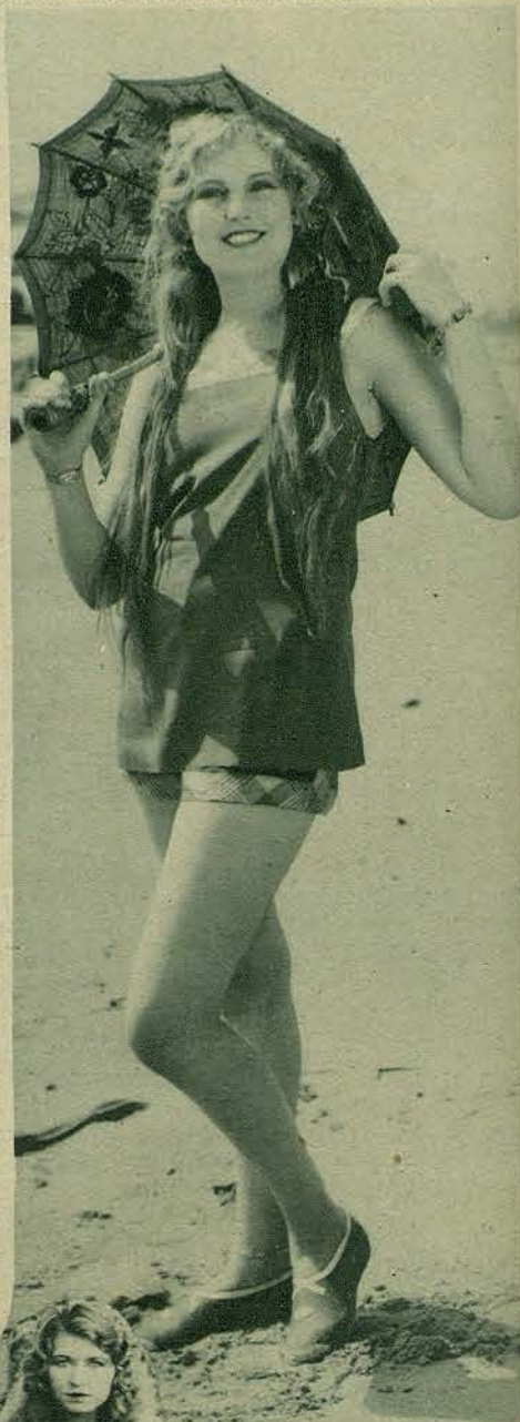
THELMA TODD, EN LA PLAYA

Este número ha sido visado por la censura