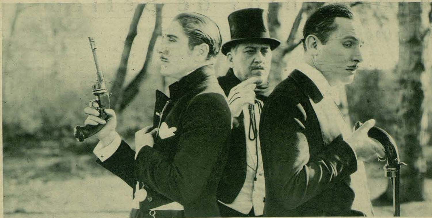
Desafío entre Lew Cody y el que le disputa el amor de Renée Adorée en "El Boulevard" de la M-G-M