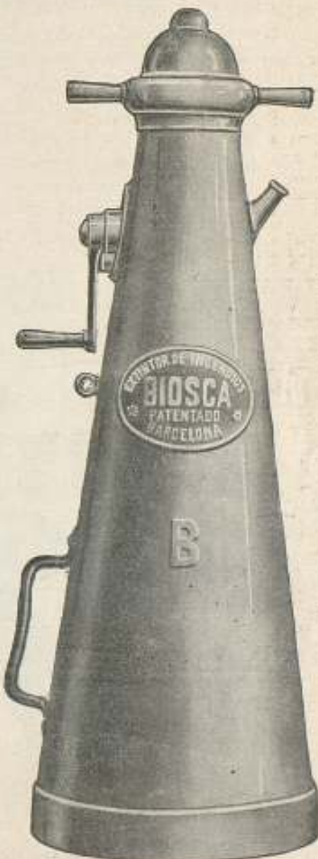
Aparato Modelo B. de 10 litros de cubida, lanza el líquido extintor a 12 metros de distancia.