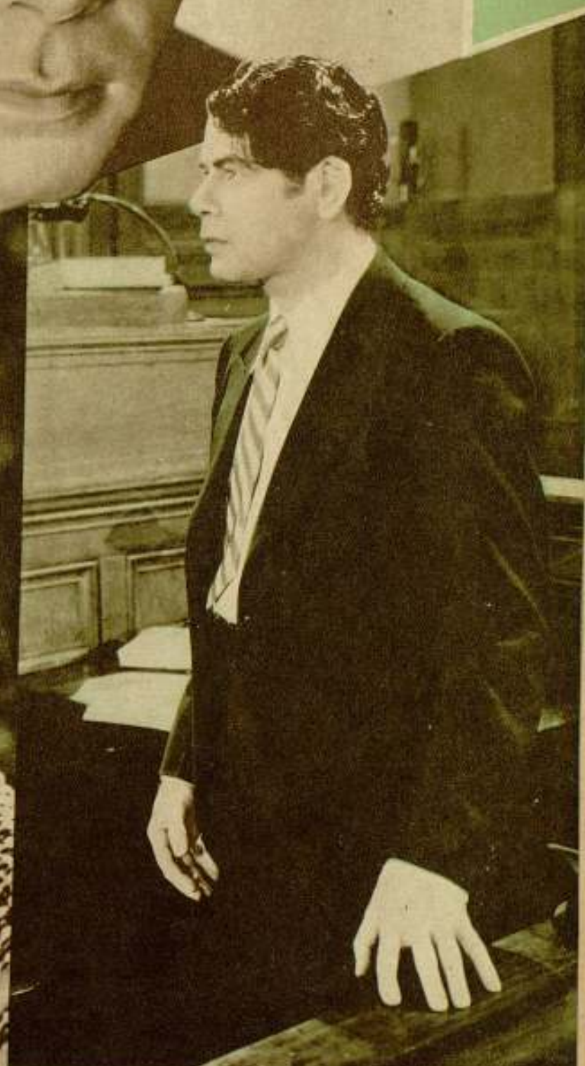
Varias escenas de esta emotiva película de Warner Bros-First National, cuyos principales papeles están interpretados por Bette Davis, Margaret Lindsay y el admirado actor Paul Muni.