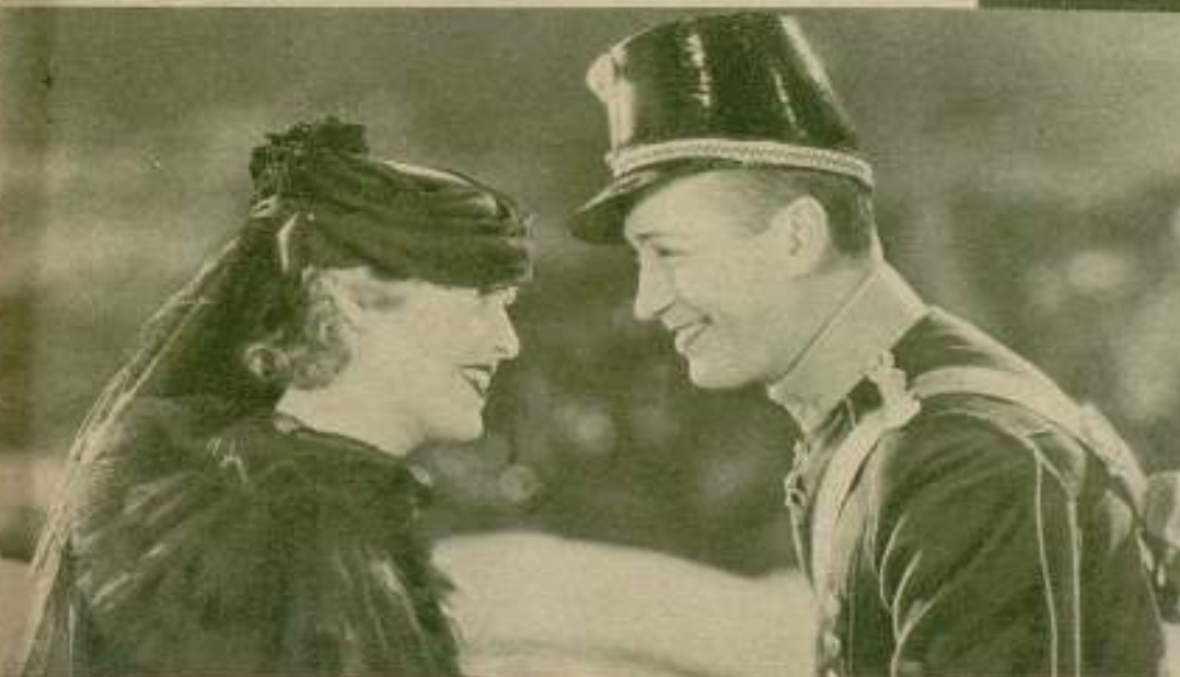
que hubiera mordido el corazón de la Fritzroy.

Jean Harlow y Joan Crawford se detestan. Pero este odio es mas natural si se quiere y no tiene por base los celos profesionales. Joan Crawford no ha podido jamás ver con buenos ojos que su «amigo» Franchot Tone le haga el amor, de manera tan vivida y elocuente a la célebre rubia de platino, Polly Moran y Marie Dressler, a des-