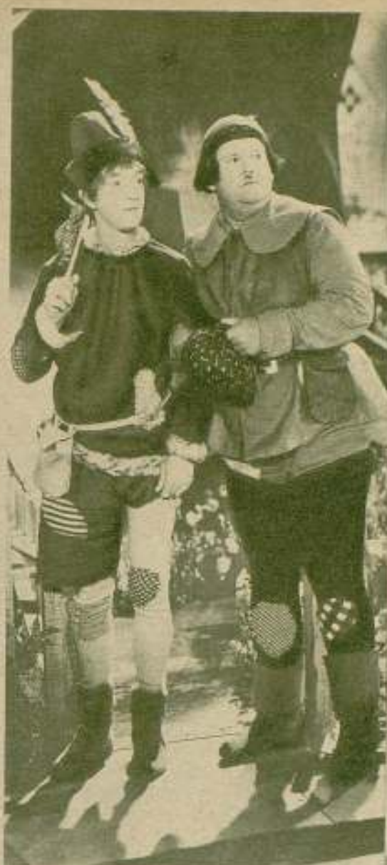
Tan graciosos y buenos camaradas en las películas... pero fuera del lente cinematográfico esta pareja de Laurel y Hardy se va a las manos con frecuencia... (Escena de la película Metro «Din'a Bublery».

También entre directores y artistas surgen grandes dificultades en Hollywood. Nos conformaremos con mencionar algunos casos de los más importantes: Nancy Carroll y el director Ernest Lubitch, que casi se destrozan mientras el director alemán dirige a la pelirroja en la película «Remordimiento», de la casa Paramount. Pola Negri y Herbert Brenon, el «metteur en scène» brillante, a quien se debe «Peter Pan», «A kiss for cinderella» y «Lumox». Mae Murray y el realizador Von Stroheim, que tuvieron su batalla sangrienta mientras se llevaba al celuloide la versión silenciosa de «La viuda alegre». En aquella época Mae Murray era una de las estrellas más famosas de Cincinnati. Contaba con la protección decidida de Marcus Loew, uno de los ejecutivos más preeminentes de la Metro-Goldwyn-Mayer y esta amistad, hay que advertirlo, no pasó jamás los límites de las conveniencias sociales y comerciales, ya que estaba basada en las pingües ganancias que el nombre de Mae dejaba en las cajas del tesoro de la Metro, pues el público hacía cola para ver una de sus películas. Mae Murray tenía sus ideas definidas respecto a de que manera debía ballarse el celuloide valde de la obra de Lehar, y el director Von Stroheim veía la cues-