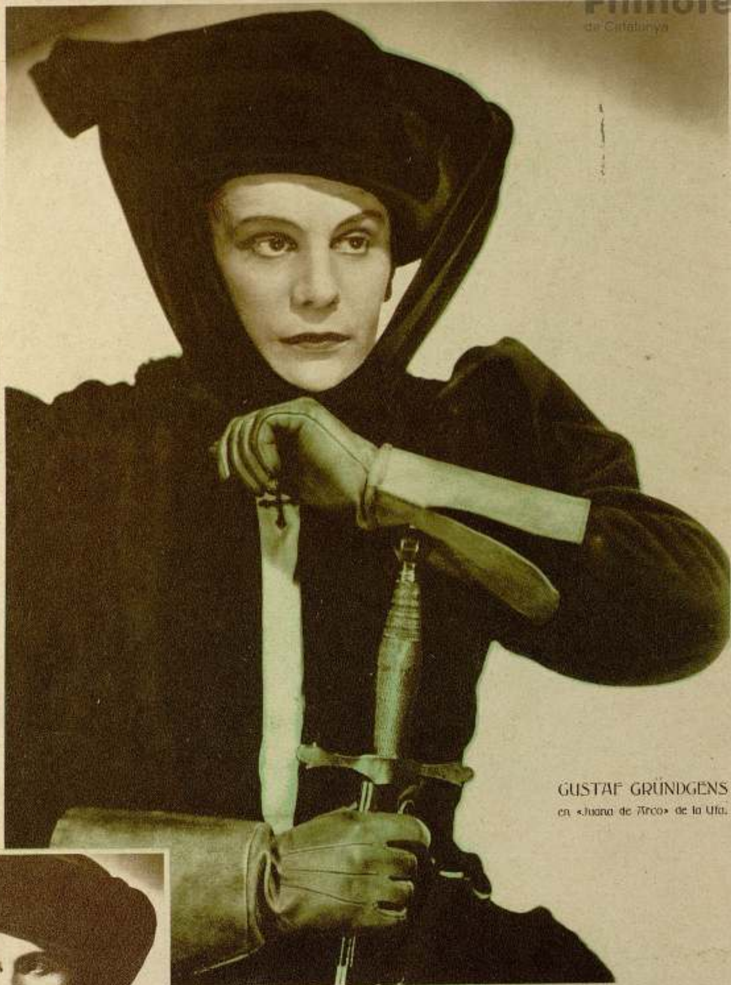
GUSTAF GRÜNDGENS en «Juana de Arco» de la Ufa.