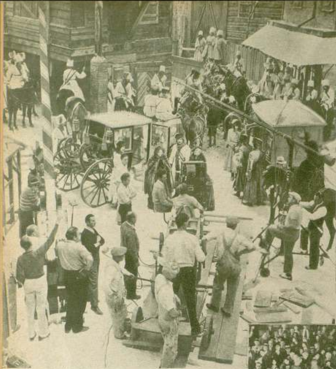
Un momento de descanso durante la filmación de «Capriccio Imperial».