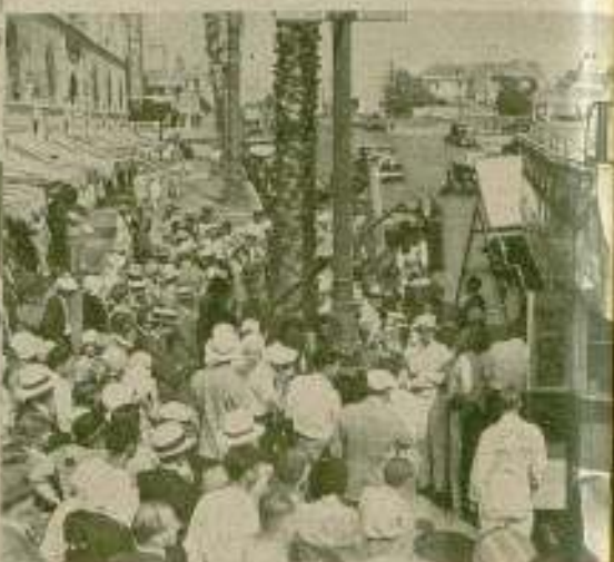
Un grupo de «actores de atmósfera» preparados para actuar ante la cámara.