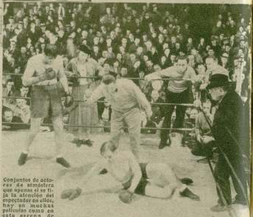
Conjuntos de actores de atmósfera que apenas si se fijan la atención del espectador en ellos, hay en muchas películas como en esta escena de «Su última pelea».

Pero de todas las anécdotas que se cuentan de cómo se valen algunos sandwichmen para obtener publicidad y con ella su entrada en los estudios, acaso ninguna tan pintoresca y melodramática a la vez como le sucedió a William Powell a la puerta del Teatro Chino, du-