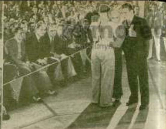
Una escena de «Duro de pelar».