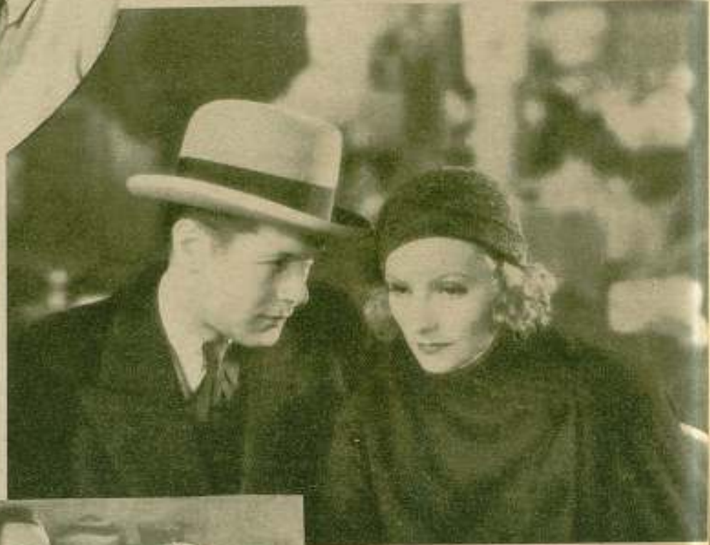
En la película «Inspiration» no era posible advertir la menor animosidad entre Greta Garbo y Robert Montgomery, pero entre ambos hay una hembra infranqueable de incompreensión.

Nancy Carroll y Phillips Holmes se odian. Los vimos trabajar juntos en «Devil's Holiday», «Stolen Heaven» y «Remordimiento», y en más de una ocasión nos preguntamos si una de aquellas escenas de ternura no terminaría con un duelo y la justicia ha-