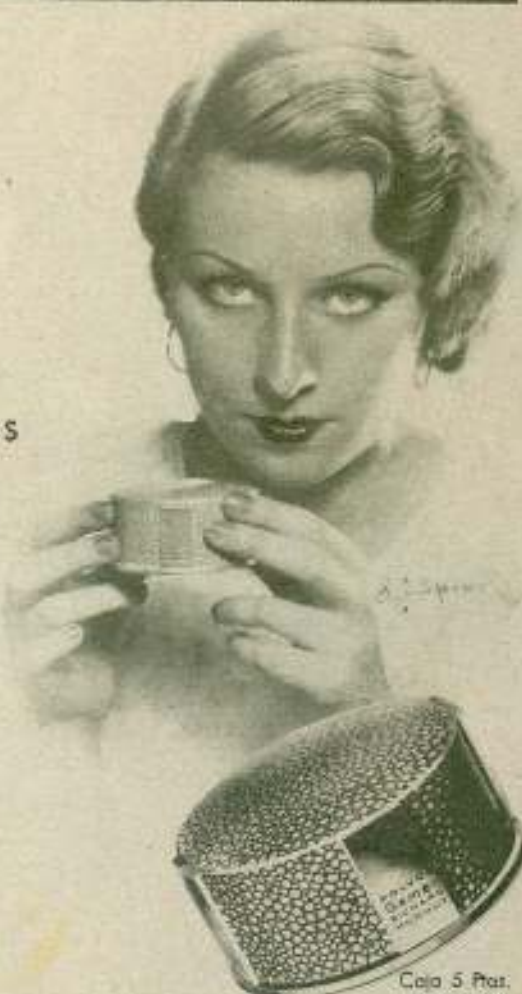
Caja 5 Ptas. (TABLA AFORTE)

Son los polvos de ta- cador ideales por su gran pureza, su finura y su adherencia y por estar perfumados con el legítimo perfume Gemey.