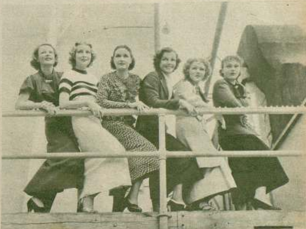
Las candidatas de la Paramount para las Estrellas Rubias de 1935, son Wendy Barrie, Gertrude Michael, Gail Patrick, Ann Sheridan, Grace Bradley y Katherine De Mille.