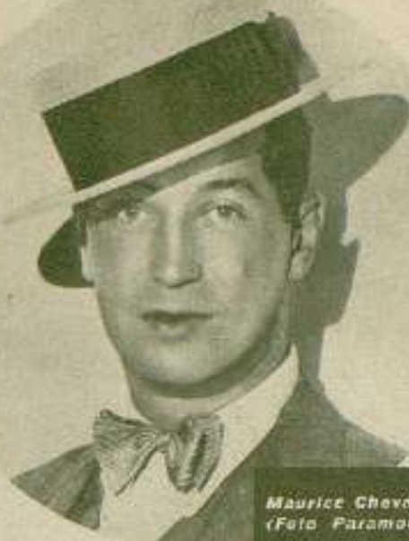
Maurice Chevalier.

B ERTA Singerman, la insigne recitadora y hoy «star» cinematográfica, ha declarado recientemente que en Hollywood nadie es feliz. Ella viene de allá y ha visto a Key Francis menos juvenil y menos magnífica de lo que en la pantalla nos parece, y a Dolores del Río menos bella, y a Maurice Chevalier más melancólico de lo que pudiéramos imaginar en el galán de la perenne sonrisa. Pero estas gentes que en Hollywood no son felices, echan el ancla en Hollywood y no se pueden desraizar de él. Es «el veneno del celuloide». Del