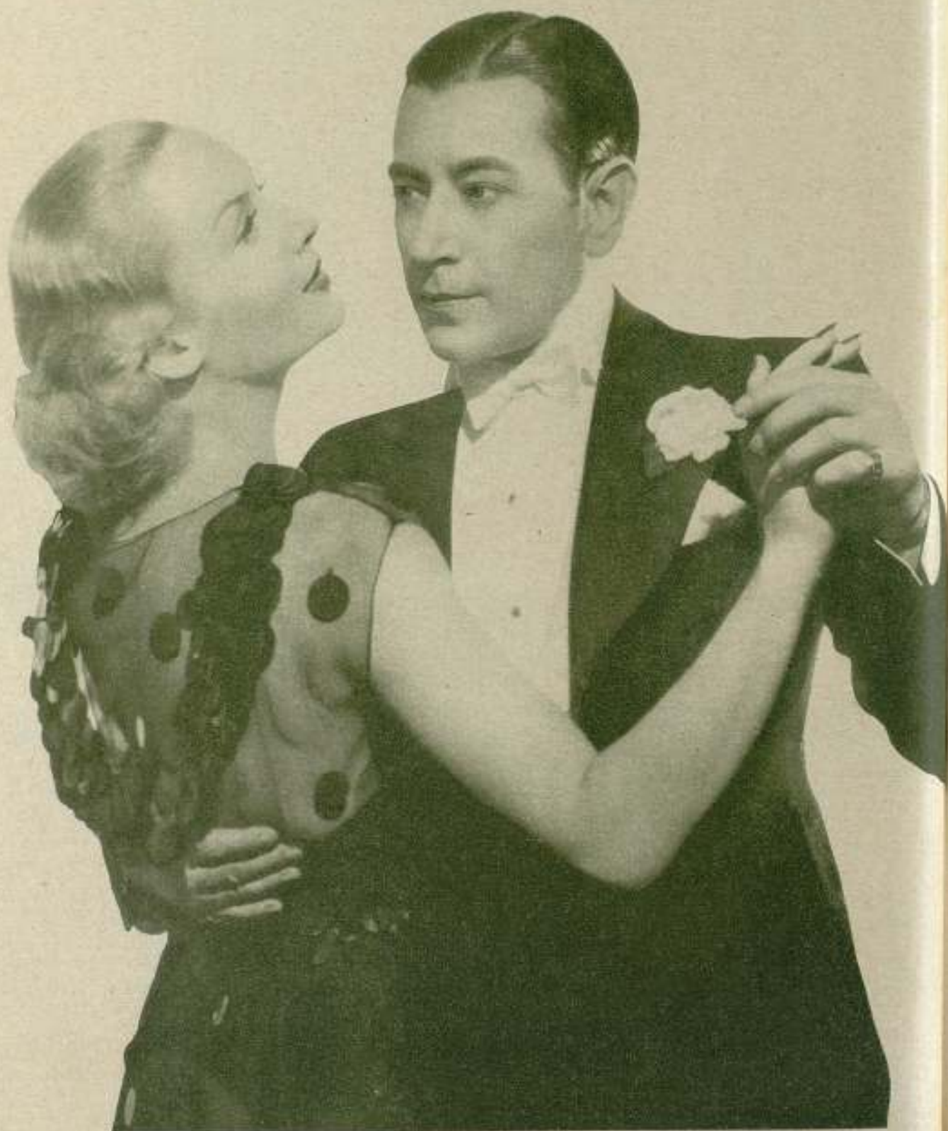
Carol Lombard y George Raft... puede el lector más perspicaz notar la ferocidad de su odio, mientras se mecen acariciados por la melodía africana de la rumba... (Foto Paramount).