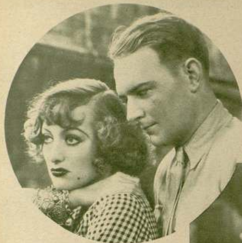
En la película «Rain» (Lluvia), Joan Crawford y William Gargan se adoraban... Fuera del «set» se asesinaban con las miradas y las palabras no dejaban de ser fuertes...

Estos artistas se besaban en la pantalla y se morían y se apuñalaban con los ojos. Triunfaban en los estudios de la First National, mucho antes de que esta empresa se amalgamara con la Warner Brothers, para formar una sola entidad.