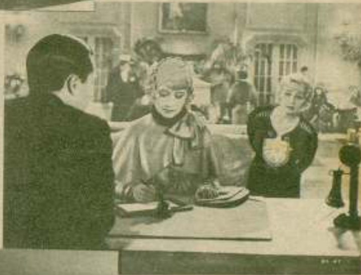
Joan Blondell y Genevieve Tobin, enemigas mortales, cuyo odio terminó como cualquier disgusto de solar, echándose mano al recurso de los cabellos, mientras filmaban «Good-bye again».