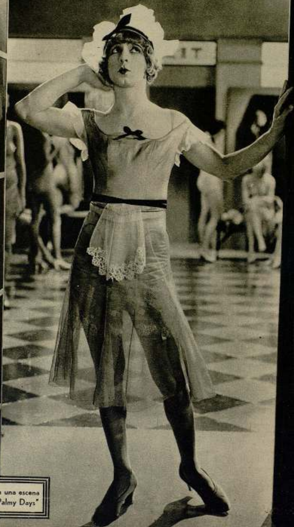
Eddie Cantor en una escena de la película "Palmy Days"