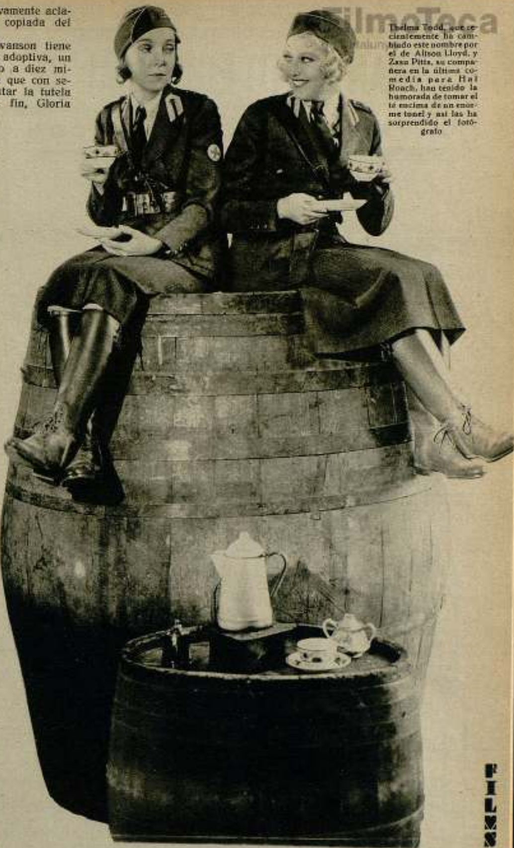
Thelma Todd, que recientemente ha cambiado este nombre por el de Alison Lloyd, y Zasu Pitts, su compañera en la última comedia para Hal Roach, han tenido la humorada de tomar el té encima de un enorme tonel y así las ha sorprendido el fotógrafo.

Algún tiempo después volvió con una nueva película mostrando los resultados