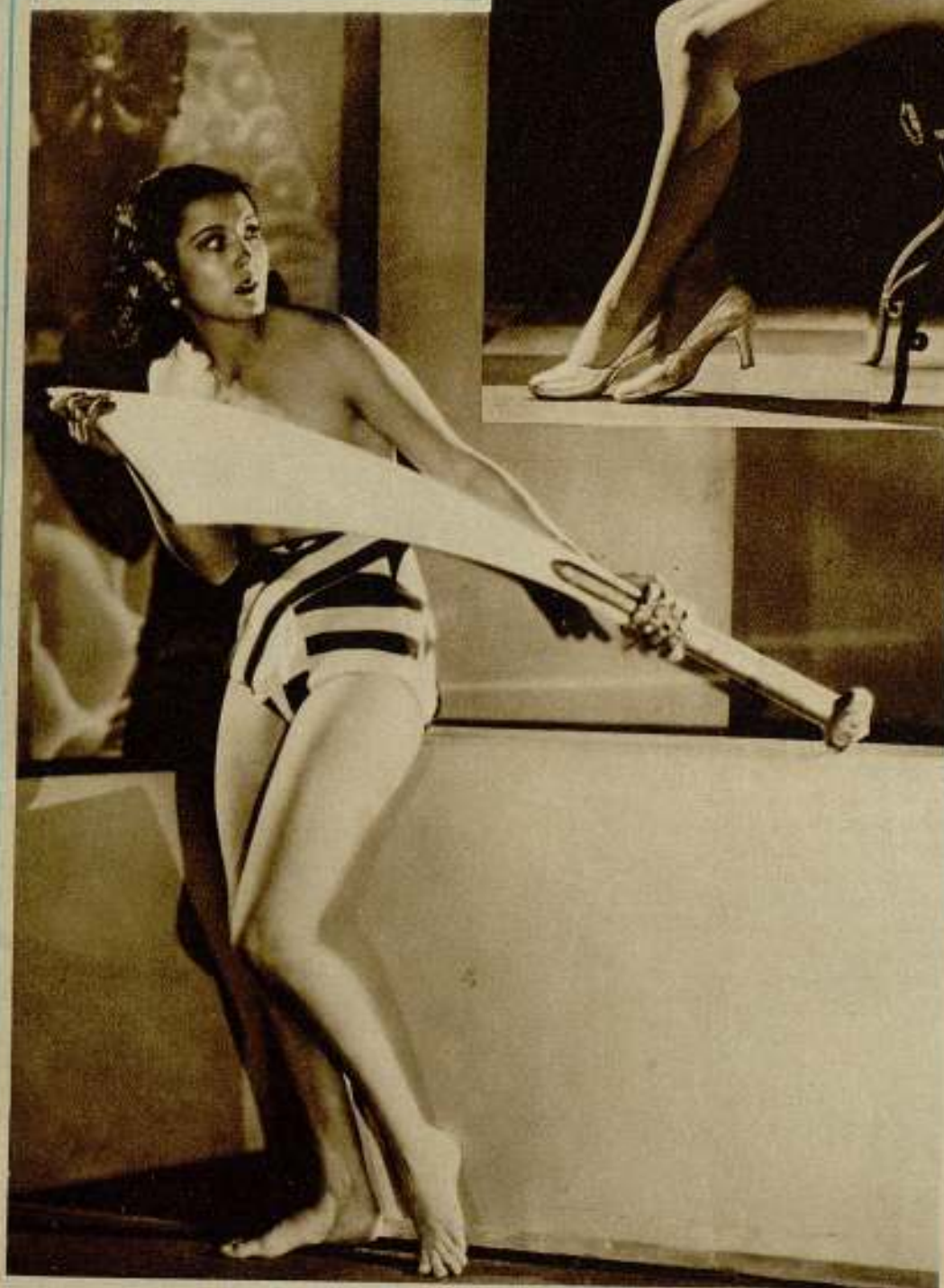
La bella estrella me- jicana Raquel Torres.