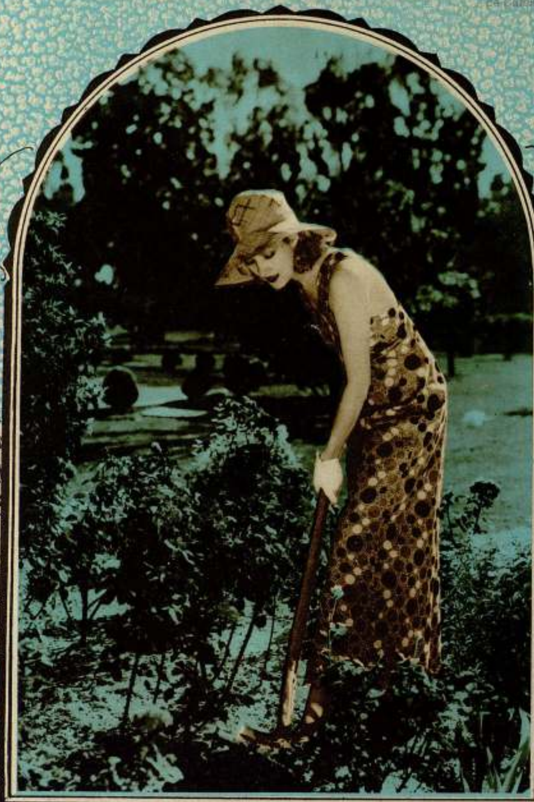
Edwina Booth, la insuperable protagonista de la película «Trader Horn», se dedica a cultivar flores en los jardines del estudio, en los ratos que le deja libres la filmación de películas.