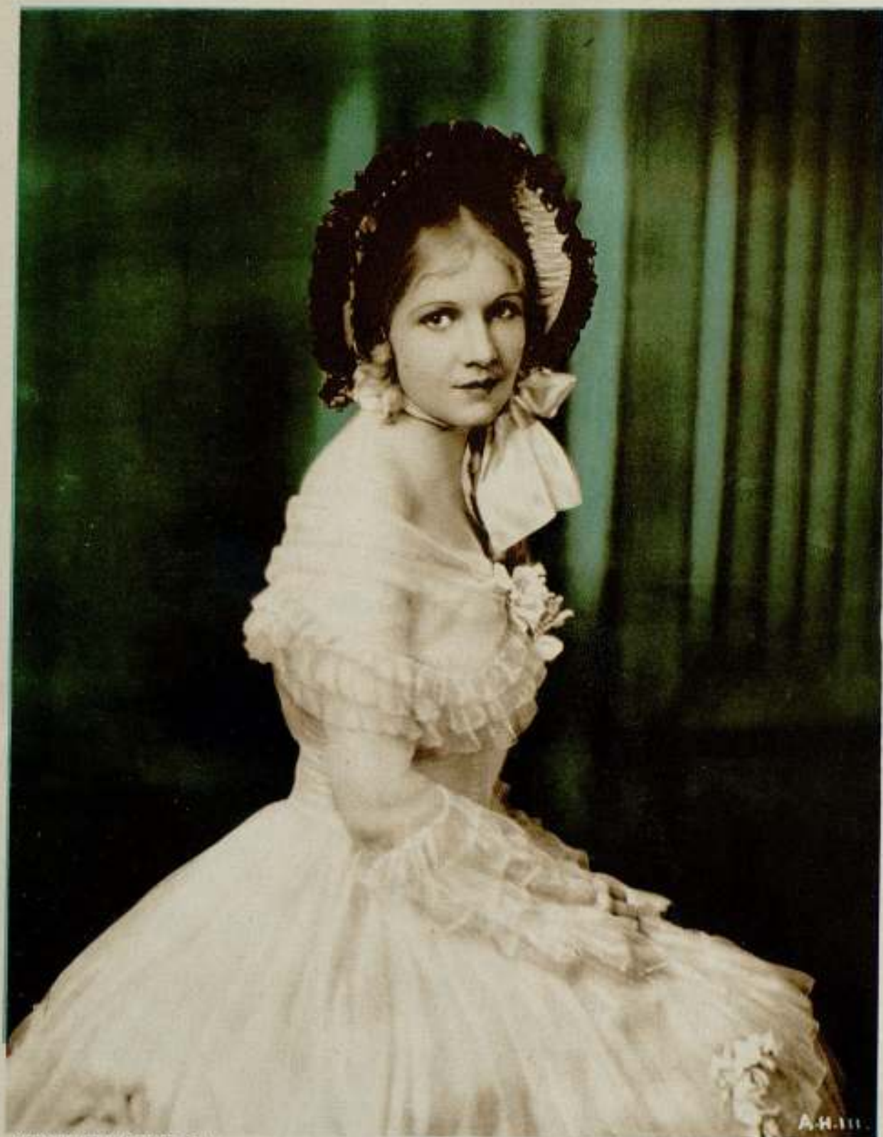
Ann Harding de R. K. O. Pathe