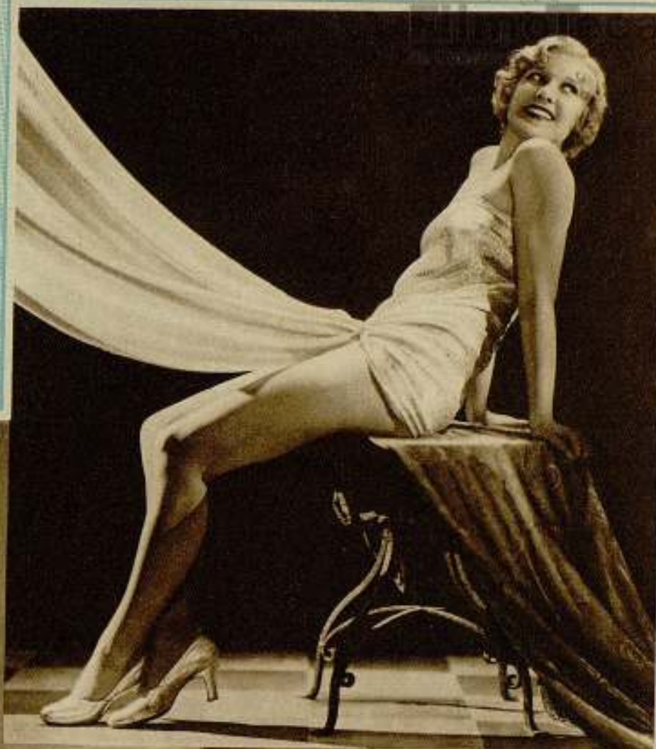
Una artista de la Pa- ramount.