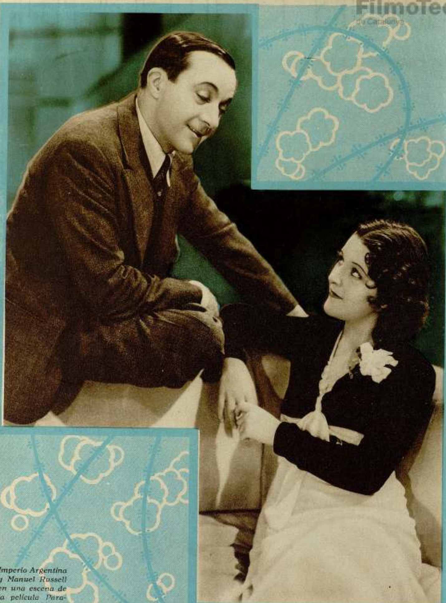
Imperio Argentina y Manuel Russell en una escena de la película Para- mount, «¿Cuándo te suicidas?»