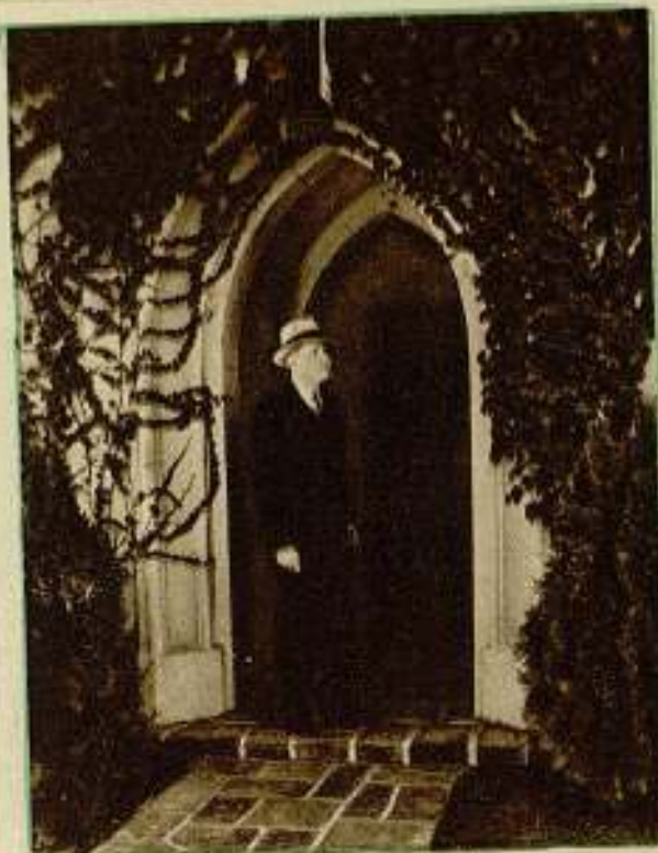
Stuart Erwin en la puerta de su casa