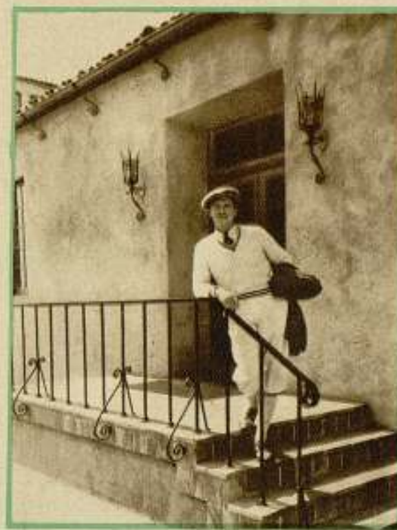
George Bancroft en la entrada de su domicilio