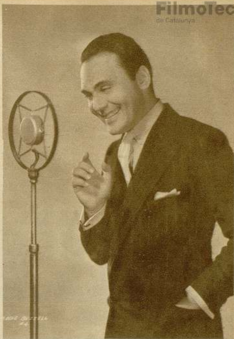
Eddie Buzzell en el acto de filmar una de sus «historietas para personas mayores».

No obstante, los que nos ganamos la vida a caza de estos personajes fantásticos que se mueven como sombras en la pantalla de aluminio, o que aparecen en los escenarios abrumados por el oro y los lujos superficiales, no podemos escoger: tenemos que presentarle al público lo que está de actualidad. Penetrar en las almas, abiertas o herméticas,