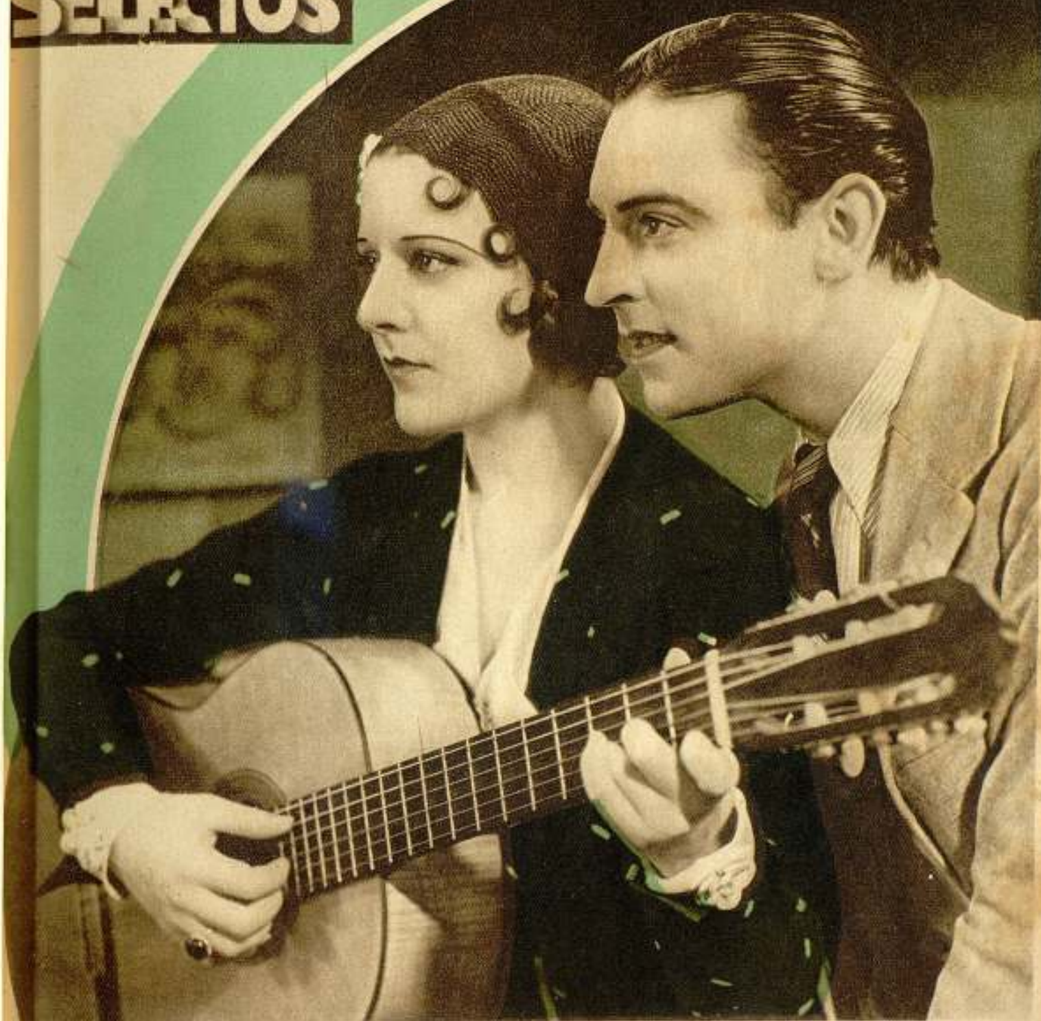
Imperio Argentina y Tony d'Algy en la película Paramount "Lo mejor es reír"