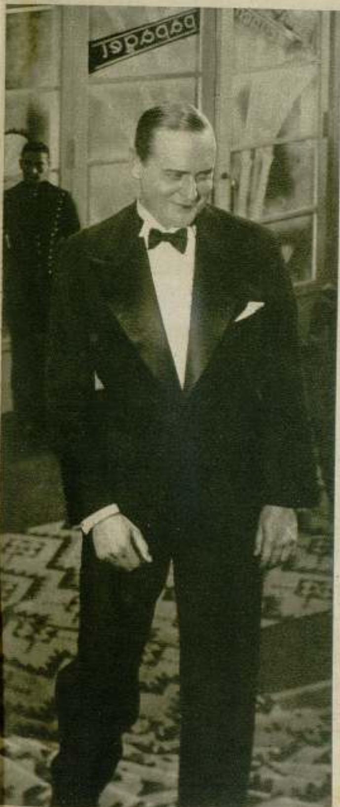
Actitud y expresión muy características de Harry Liedtke

Airo, atlético, de movimientos rígidos y ademanes correctos. Sus ojos azules tienen reflejada la candidez, la ingenuidad; su cabello rubio y su cara anfiada le dan un aspecto de niño encaramado en el pedestal de la popularidad, y que tiene ya cerca de sus manos la golosina de la Gloria. Así me creo ver a Harry Liedtke cuando me recibe en el umbral de su casa, un hotelito, en las afueras de la gran urbe, un