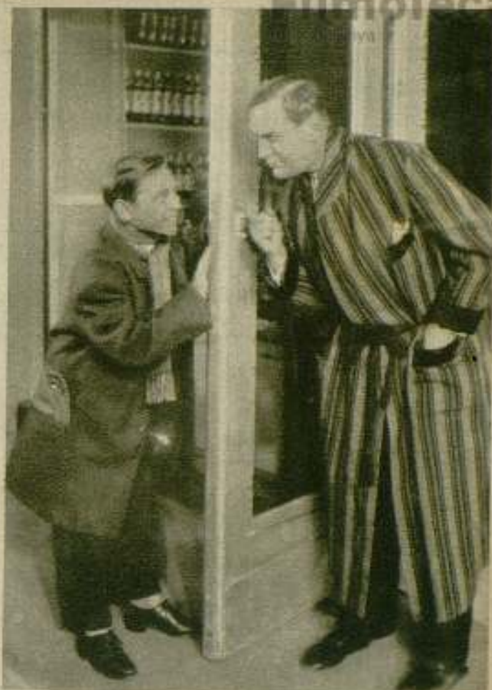
Harry Liedtke en una escena de la divertida película «Delikatessen»

poco barroco y otro poco «kolossal». Me tiende su mano grande de campeón de boxeo, y me expongo a perder la mía. Pero no; Harry es armónico, delicado y atento, dentro de su humanidad de dos metros y pico, y me acoge con afabilidad y sin apretarme la mano. Después, le manifiesto mis temores, y me contesta: