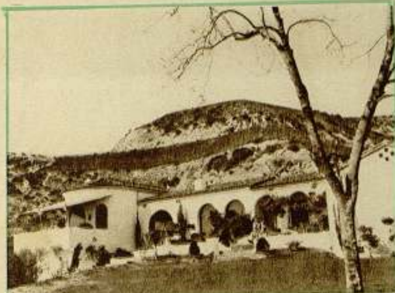
La casa tipo "rancho" de Tom Douglas