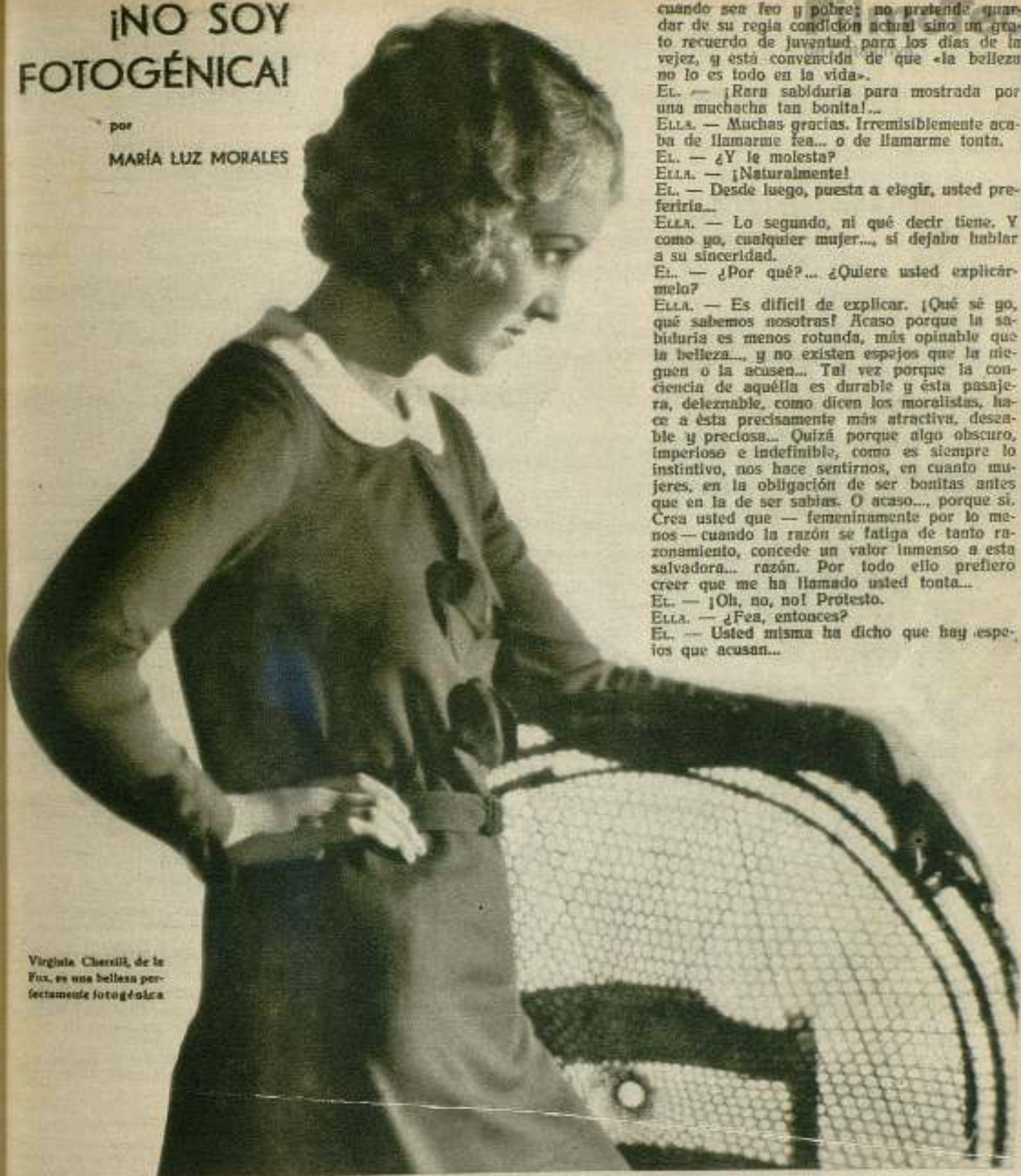
Virginia Cherrill, de la Fox, es una belleza perfectamente fotogénica

cuando sea feo y pobre; no pretende guardar de su regia condición actual sino un grato recuerdo de juventud para los días de la vejez, y está convencida de que «la belleza no lo es todo en la vida».