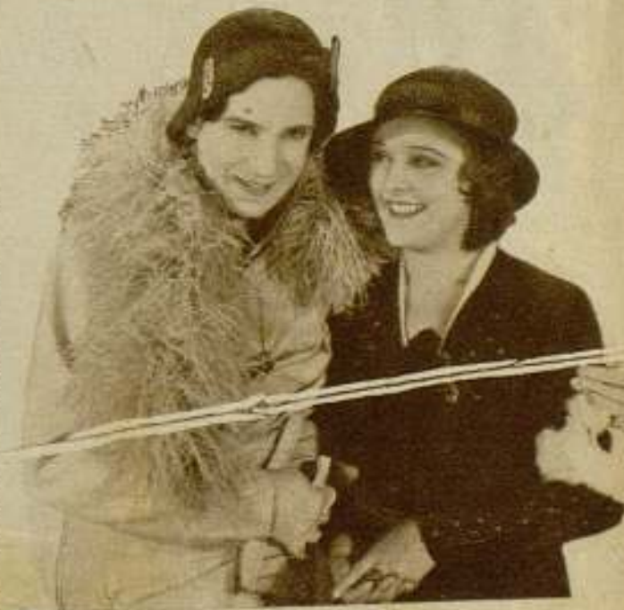
El actor Saint Granier, protagonista de «Bien que la vérité», con la bellísima Imperia Argentina, protagonista de la «Costa Azul», Paramount.

Este, me dije, es un elogio merecido que Francia dedica a Norteamérica.