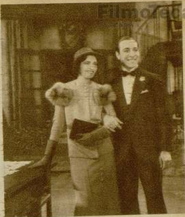
Kay Francis y Ricardo Cortez en una escena de la película «Radio» «The Next Corner» dirigida por Herbert Brenson.

zón, la mujer experimenta aquí muchísimo más, y cada día se acentúa más, la tendencia de Norteamérica a convertirse en líder de la moda mundial.