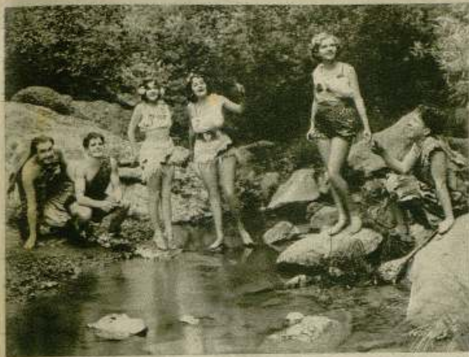
Nuevos tiempos, nuevas costumbres.

papeles de característica, disminuyendo sensiblemente su sueldo.