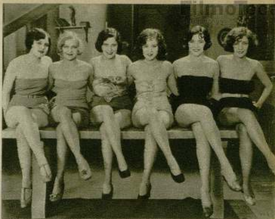
Los directores de escena imponen a las comparsas la reducción del vestuario a la mínima expresión.

Después, los gustos y aficiones han cambiado con pasmosa rapidez. Las estrellas no oponen obstáculo a lucir la totalidad de sus encantos, y los directores de escena imponen el desnudo a