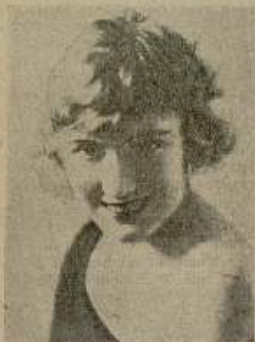
Edna Purviance posee unos maravillosos ojos de rubia; capaces de inquietar al más flemático.

en vuestras vidas, una mirada inolvidable.