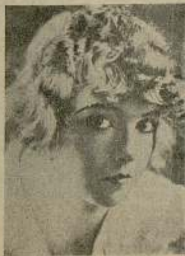
Lillian Gish, la reina, lector. ¿Observas que pupilas tan eloquentes?