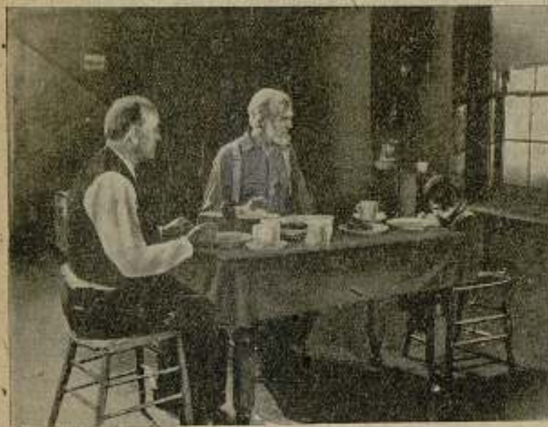
Una escena de la preciosa película CHIQUELIN