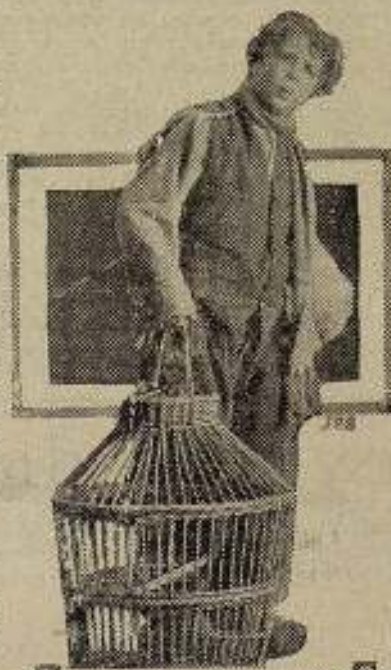
Maeterlinck's THE BLUE BIRD An AIRCRAFT Picture (El Pájaro Azul)

En primero de diciembre último Edna Purviance empezó a filmar bajo la dirección de Charles Chaplin una historia dramática que se compondrá de ocho partes y será presentada en la primavera próxima por «Los Artistas Asociados». Charles Chaplin no empezará a trabajar para «Los Artistas Asociados» hasta que haya terminado el film de Edna Purviance.