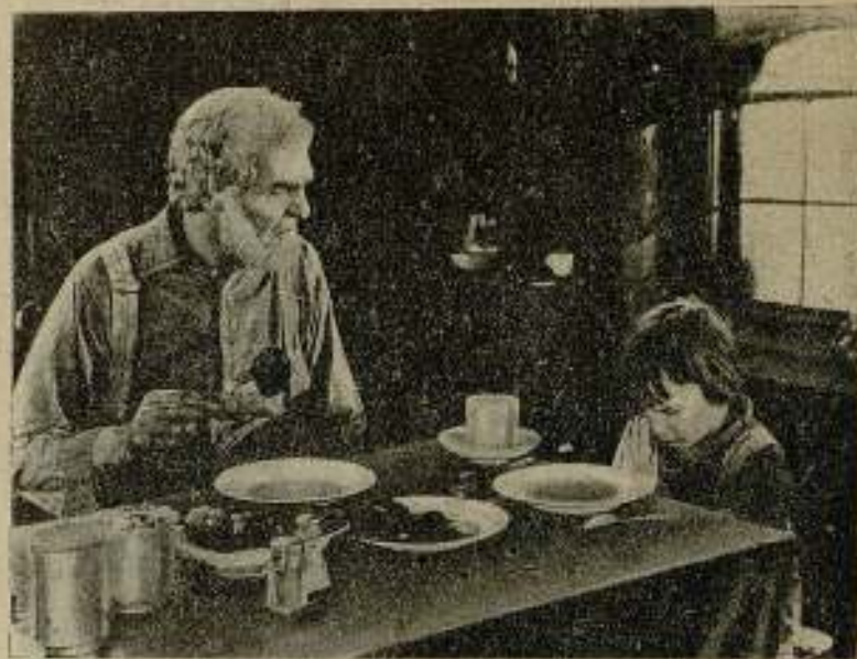
Una escena de la preciosa película CHIQUELIN

En Lisboa ha sido proyectada por vez primera La sirena de