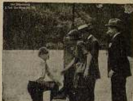
Una escena de «El rey de la plata»