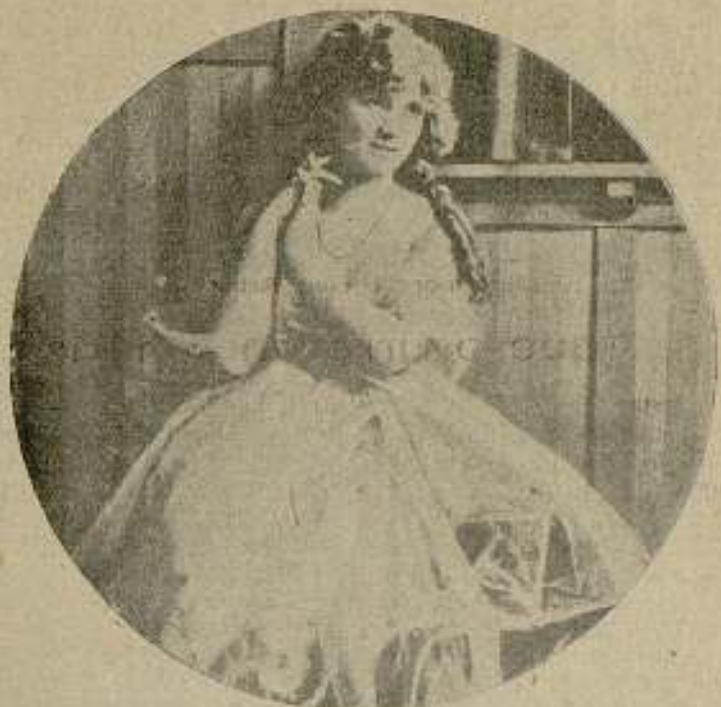
Mary Miles Minter, todo encanto es esa mirada; pero no la fies, no la fies...

Y siendo el cinematógrafo pasatiempo en el que el amor, motivo único y fundamental que