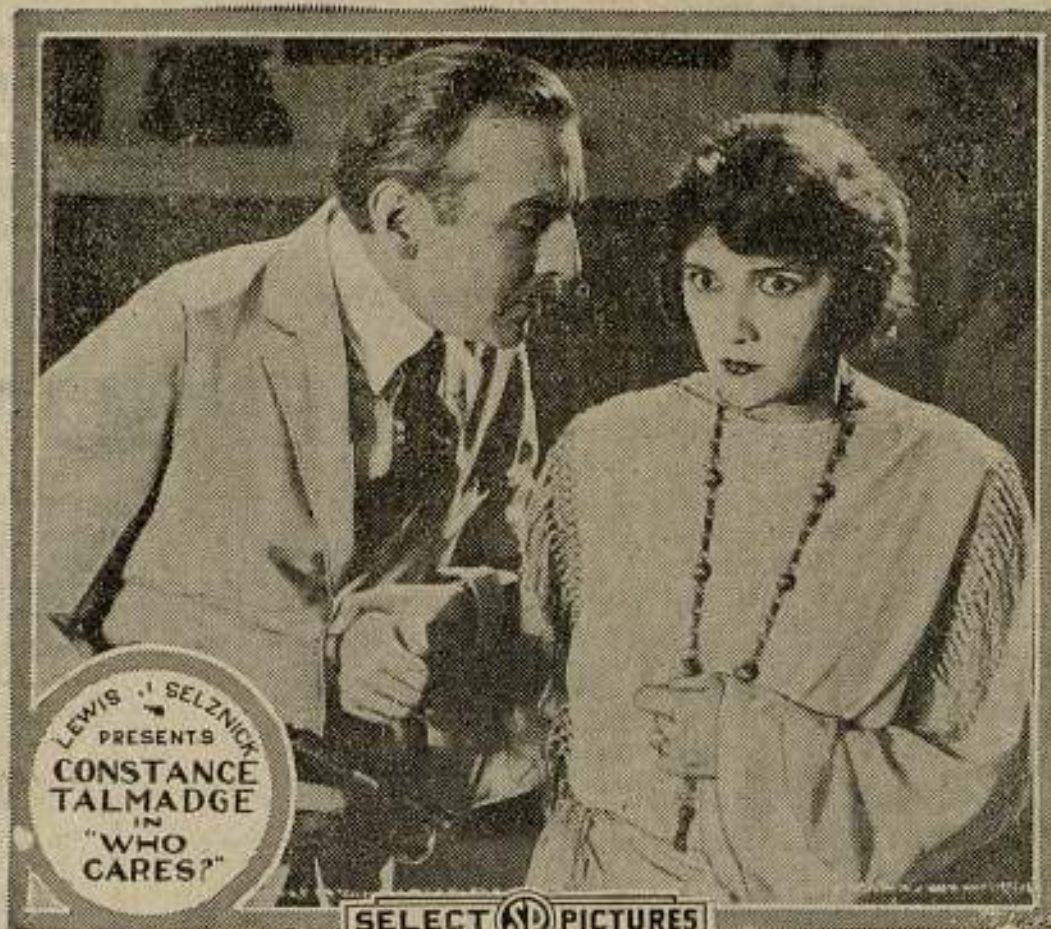
Una escena de la película «¿QUÉ IMPORTA?»

Monsieur Alapetite, Alto Comisario de Alsacia y Lorena ha mandado una circular a los alcaldes de ambos departamentos, encareciéndoles que den las oportunas órdenes para no permitir la entrada en los cines a los chicos menores de 16 años, que no vayan acompañados de sus padres.