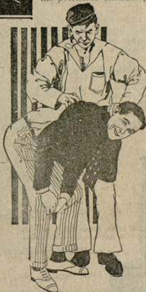
RUPERT HUGHES Scratch my Back A GILBERTSON PRODUCTION MADE BY GOLDWYN

Con esta competencia, es el público quien sale ganando, pues gracias a ella, en la actualidad estamos ya saboreando bellísimas obras de arte y cada revista extranjera nos anuncia una nueva sorpresa.