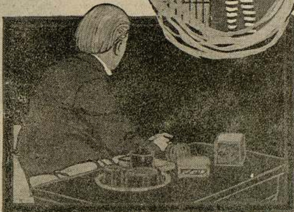
"The Street Called Straight" by Basil King An Eminent Authors Production Made by Goldwyn

Y, por último, en el género francamente cómico, podemos saborear la gracia irónica