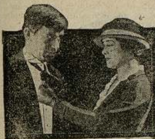
WILL ROGERS in The Strange Boarder GOLDWYN PICTURES

Los Estados Unidos continúan lanzando al mercado películas notables, como temerosos de que alguna nación les dispute su primer puesto en la cinematografía universal.