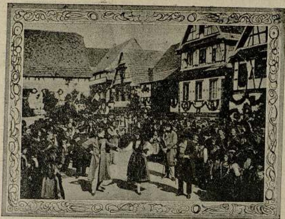
Una escena de la hermosa cinta «EL AMIGO FRITZ»

Vino el cinematógrafo, y todo se echó a perder. Desde que en la lámina blanca se movió la primera imagen, la humanidad conoció el pecado, diga lo que diga el «Génesis». Y para aplastar la cabeza de esa serpiente se han coaligado todos los filisteos del Universo; desde los que mandan hasta los que mordan. La