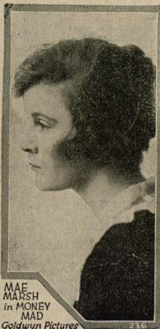
MAE MARSH in MONEY MAD Goldwyn Pictures

Tris Park y Royal Cine. —Componen el programa presentado por estos cines las películas que citamos a continuación: «Lisa Fleuron», «El idiota», «Corazones y llamas», «Las arañas negras», «Por rivalidad».