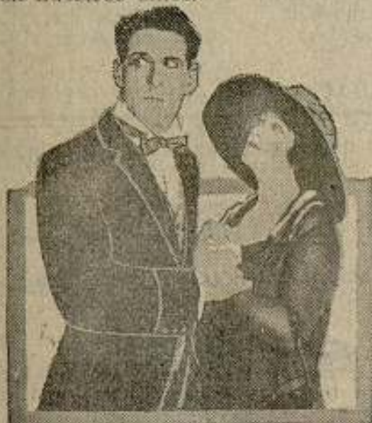
PAULINE FRÉDERICK in The Loves of Letty GOLDWYN PICTURES

Al mismo tiempo, estas noticias anticipadas que nosotros brindamos a nuestros lectores les serán provechosas, pues, seguramente, no pasará mucho tiempo sin que estas cintas vengán a España y se proyecten en nuestros cines.