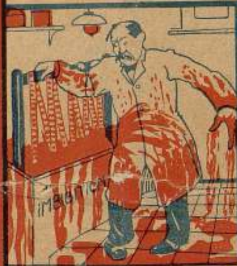
El pobre chico no conoce...

El fastidioso entintado pasó ya a la historia empleando nuestro film de color.