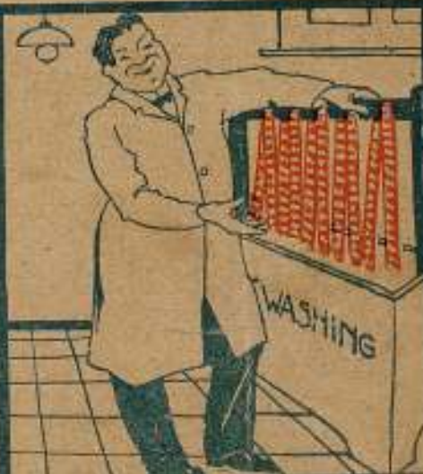
el film Gevaert coloreado.

El fastidioso entintado pasó ya a la historia empleando nuestro film de color.