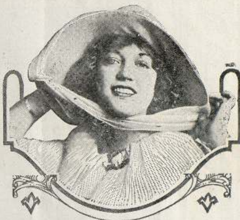
Marion Davies, preciosa artista de la Paramount, intérprete de muy notables películas

Titulanse «La señorita inútil» y «Amor y fe». Ambos films son fotodramas de largo metraje, cuyos argumentos interesantísimos dan lugar a escenas de alta intensidad dramática. La interpretación ajustadísima que le prestan cuantos actores intervienen, demuestra hasta la saciedad que han hecho un detenido estudio de sus roles