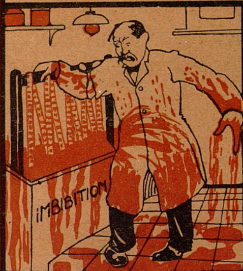
El pobre chico no conoce...

El fastidioso entintado pasó ya a la historia empleando nuestro film de color.