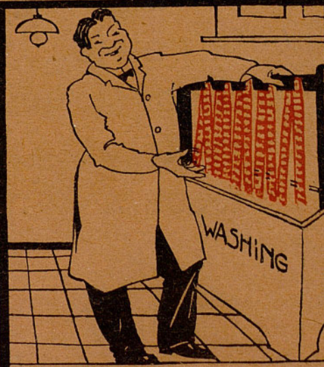
el film Gevaert coloreado.

El fastidioso entintado pasó ya a la historia empleando nuestro film de color.