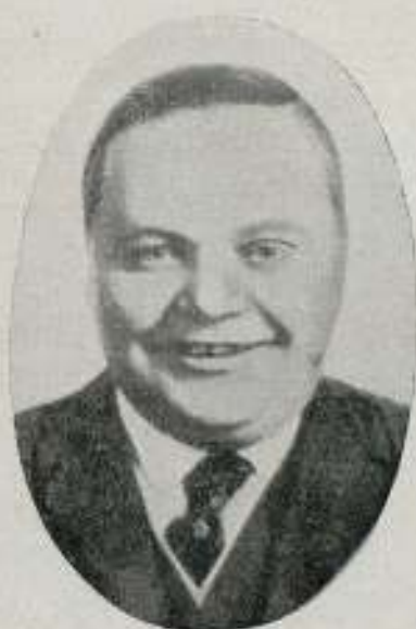
ROSCOE ARBUCKLE (FATTY)

Soy concesionario exclusivo de las producciones 1919-20