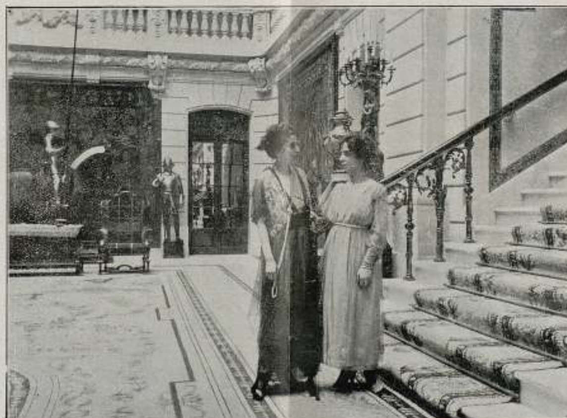
Una escena de la película "LA DICHA AJENA"

: EDICIÓN, VENTA Y ALQUILER DE PELÍCULAS PROPIAS : EDICIÓN DE PELÍCULAS DE ENCARGO - TIRAJE DE POSITIVOS TÍTULOS - AMPLIACIONES Y TRABAJOS FOTOGRAFICOS PARA CINEMATOGRAFIA