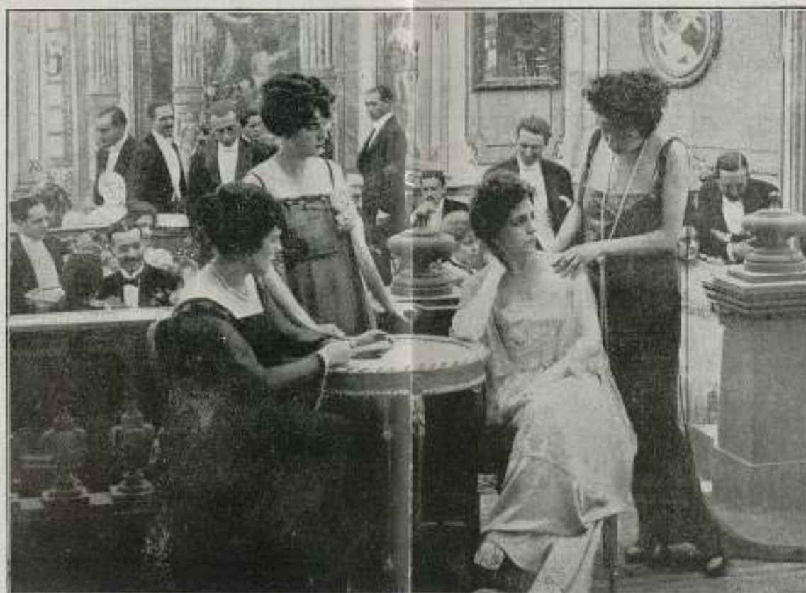
Una escena de la película "LA DICHA AJENA"

: EDICIÓN, VENTA Y ALQUILER DE PELÍCULAS PROPIAS : EDICIÓN DE PELÍCULAS DE ENCARGO - TIRAJE DE POSITIVOS TÍTULOS - AMPLIACIONES Y TRABAJOS FOTOGRAFICOS PARA CINEMATOGRAFÍA