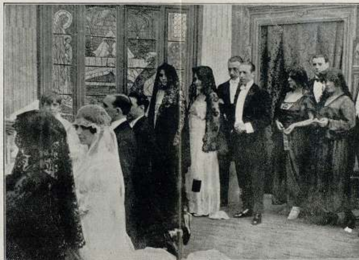
Una escena de la película "LA DICHA AJENA"

: EDICIÓN, VENTA Y ALQUILER DE PELÍCULAS PROPIAS : EDICIÓN DE PELÍCULAS DE ENCARGO - TIRAJE DE POSITIVOS TÍTULOS - AMPLIACIONES Y TRABAJOS FOTOGRAFICOS PARA CINEMATOGRAFÍA