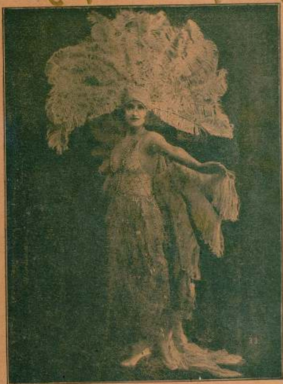
Mlle. GABY DESLYS

Bella y elegantísima artista francesa, protagonista de la película BOUCLETTE