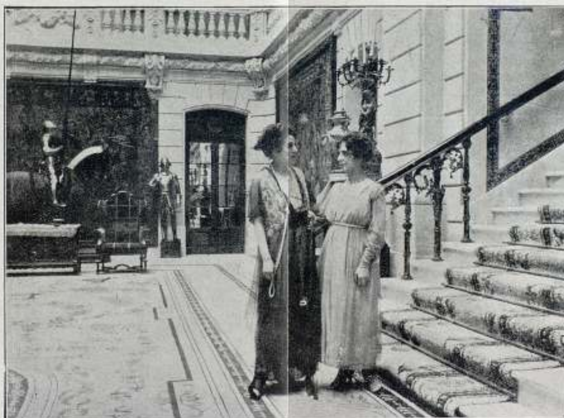
Una escena de la película "LA DICHA AJENA"

: EDICIÓN, VENTA Y ALQUILER DE PELÍCULAS PROPIAS : EDICIÓN DE PELÍCULAS DE ENCARGO - TIRAJE DE POSITIVOS TÍTULOS - AMPLIACIONES Y TRABAJOS FOTOGRAFICOS PARA CINEMATOGRAFÍA