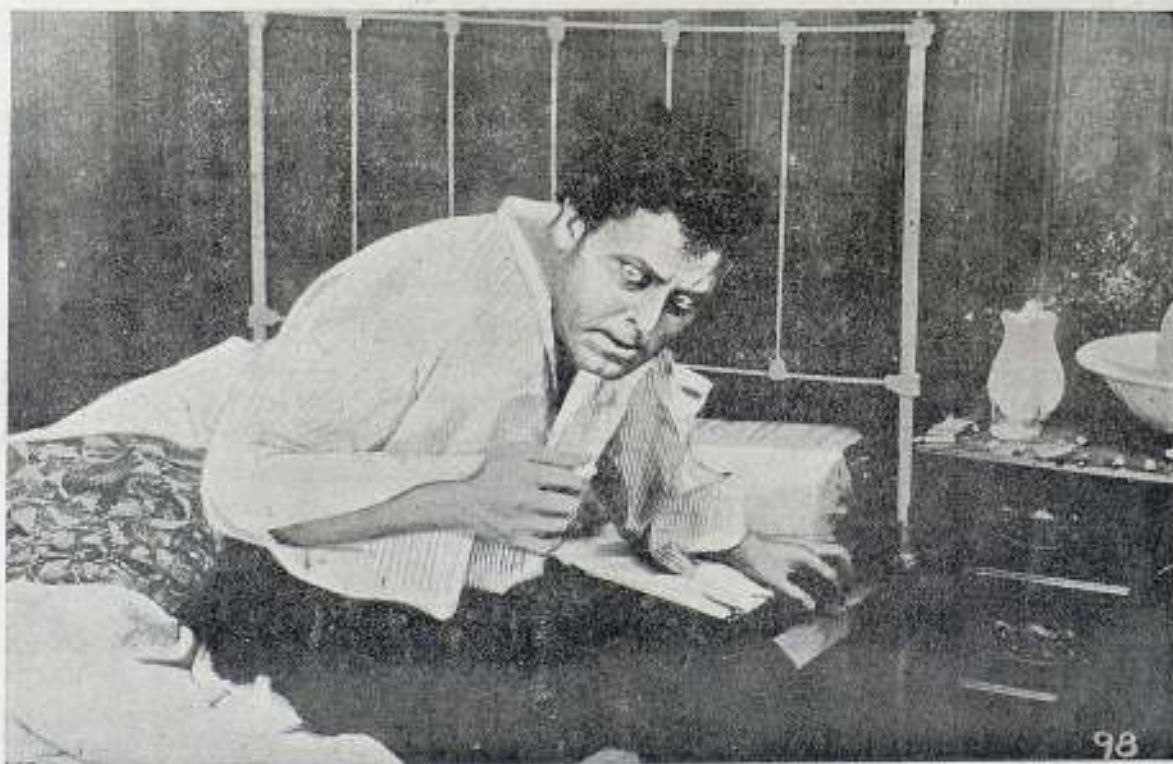
Una escena del drama UNA AVENTURA EXTRAORDINARIA