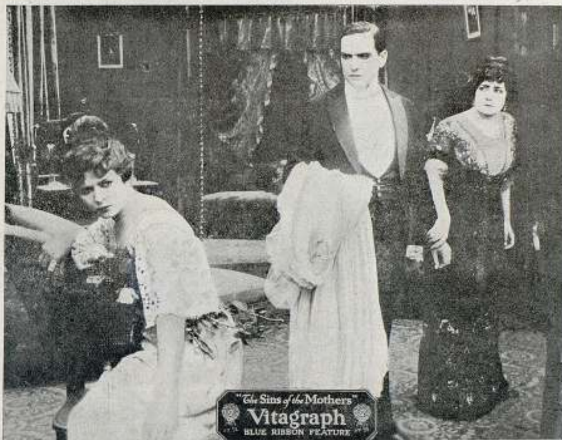
Una escena de la hermosa película LOS PECADOS DE LAS MADRES

¡CONSTITUIRÁ UN VERDADERO ACONTECIMIENTO! el drama de gran sensación, marca Vitagraph