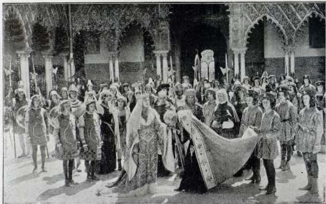
Una escena de la película La Vida de Cristóbal Colón

Fué la reina Isabel siempre decidida protectora de Colón; por esa clarividente perceptibilidad de