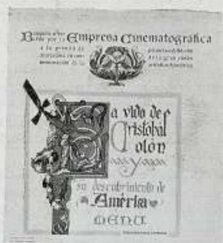
Facsimil del MENÚ del banquete ofrecido por «Empresa Cinematográfica» a las Autoridades y Prensa de Barcelona, con motivo de la prueba de La Vida de Cristóbal Colón .