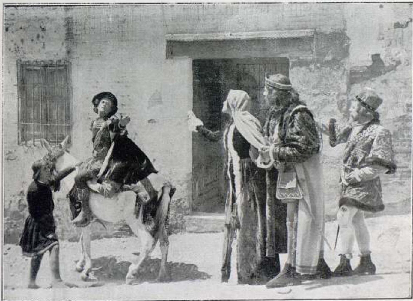
Una escena de la película La Vida de Cristóbal Colón

Nos hemos alargado demasiado en estas cuartillas y justo será darles fin, — confiados en que la opinión del público confirmará la nuestra el día del próximo estreno — haciendo remarcar que en este artículo de alabanzas — ninguna vez tan merecidas — no ha influido para nada nuestra vanidad de españoles alentada por la grandexa de los paisajes históricos reproducidos. Solamente, eso sí, lo declaramos con orgullo, nos halaga que los aplausos — no por muchos bastantes — sean el premio de méritos tan señalados e indisputables.