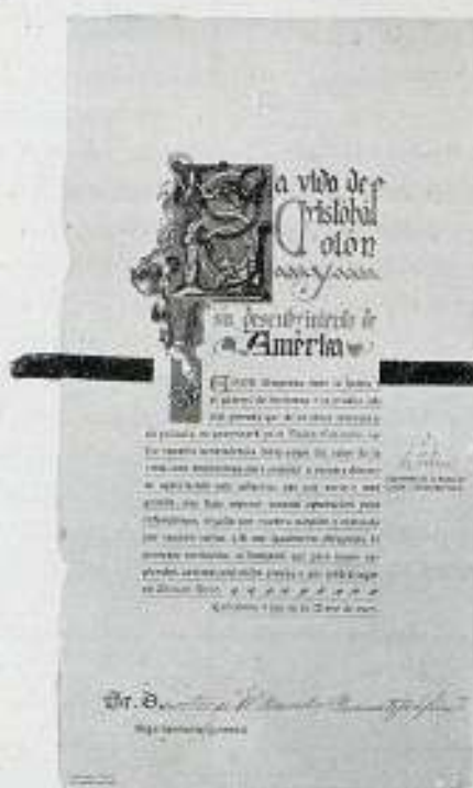
Facsimil de la invitación a la prueba de la película La Vida de Cristóbal Colón