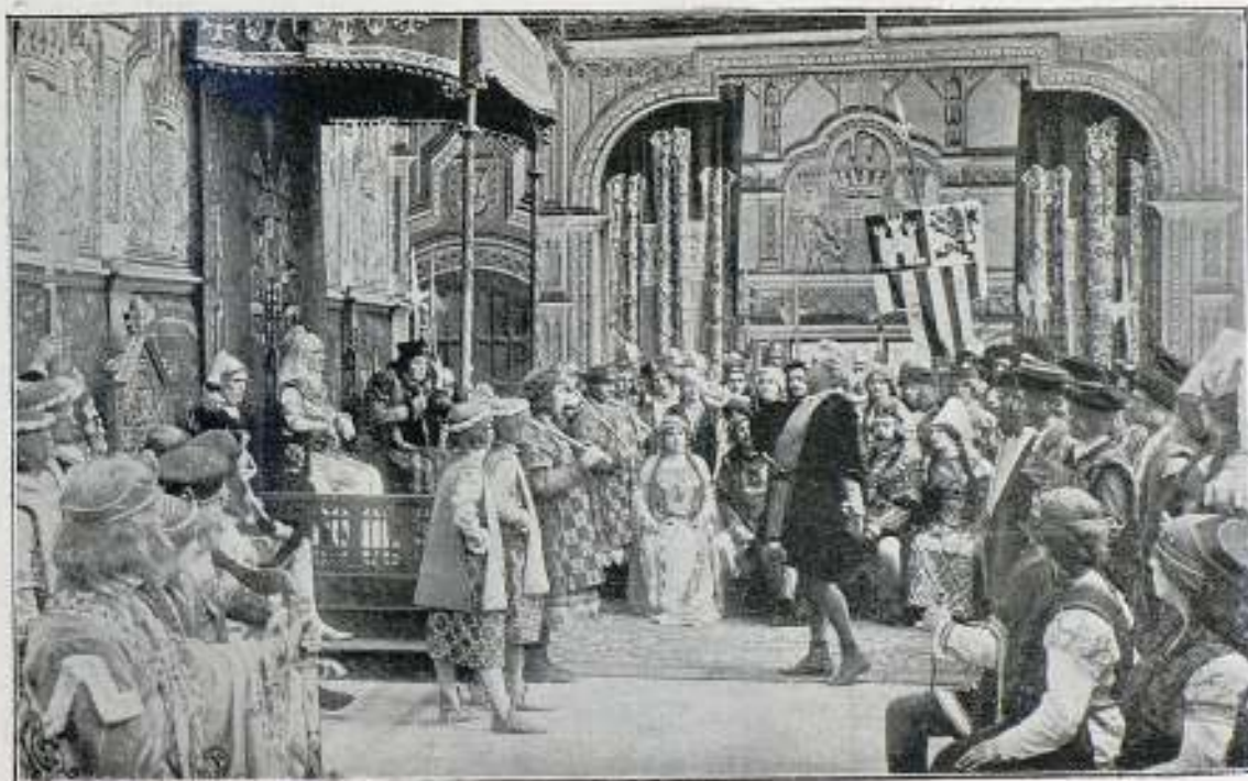
Una escena de la película La Vida de Cristóbal Colón

Al amanecer del viernes 3 de Agosto de 1492, enarbolando arrogante el estandarte real de Castilla, salía la flotilla del puerto de Palos en busca de lo