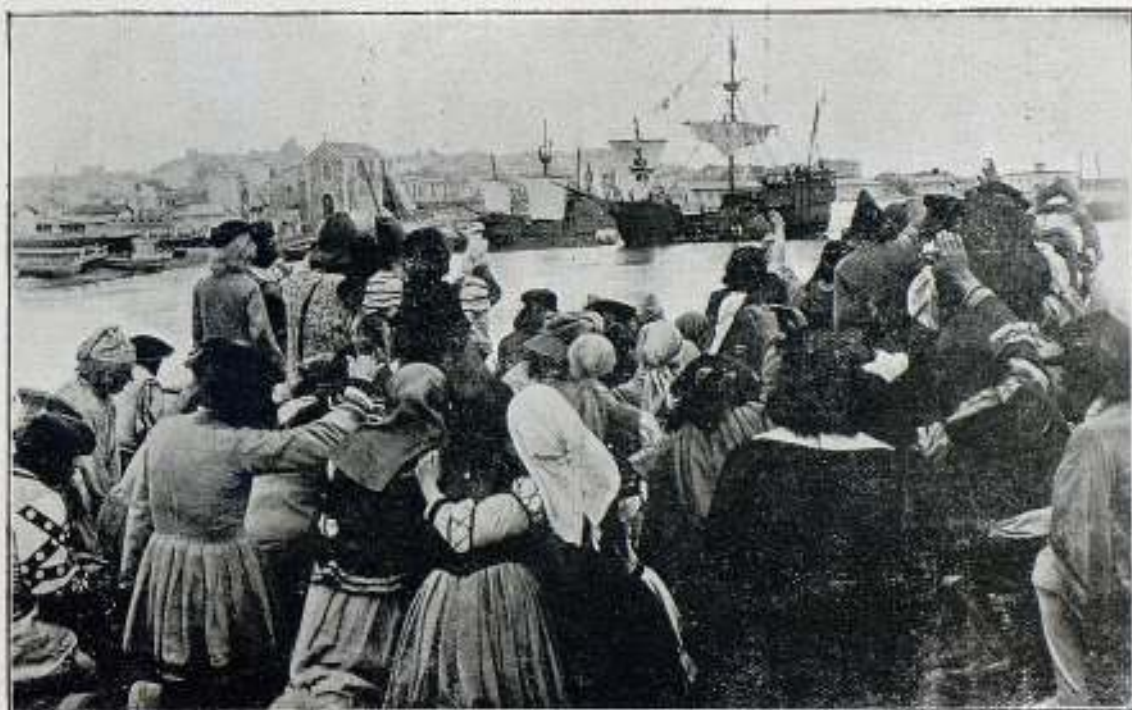
Una escena de la película La Vida de Cristóbal Colón

A los pocos días tuvo que luchar con una horrenda tempestad y, por fin, el 15 de Marzo de 1493