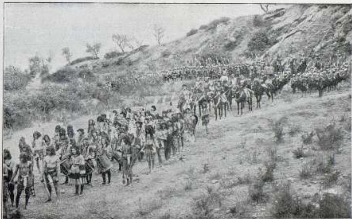
Una escena de la película La Vida de Cristóbal Colón

A las cinco de la tarde terminó la simpática fiesta, que tan grato recuerdo habrá dejado a todos los concurrentes, los cuales repitieron sus felicitaciones a los propietarios de «Empresa Cinematográfica».