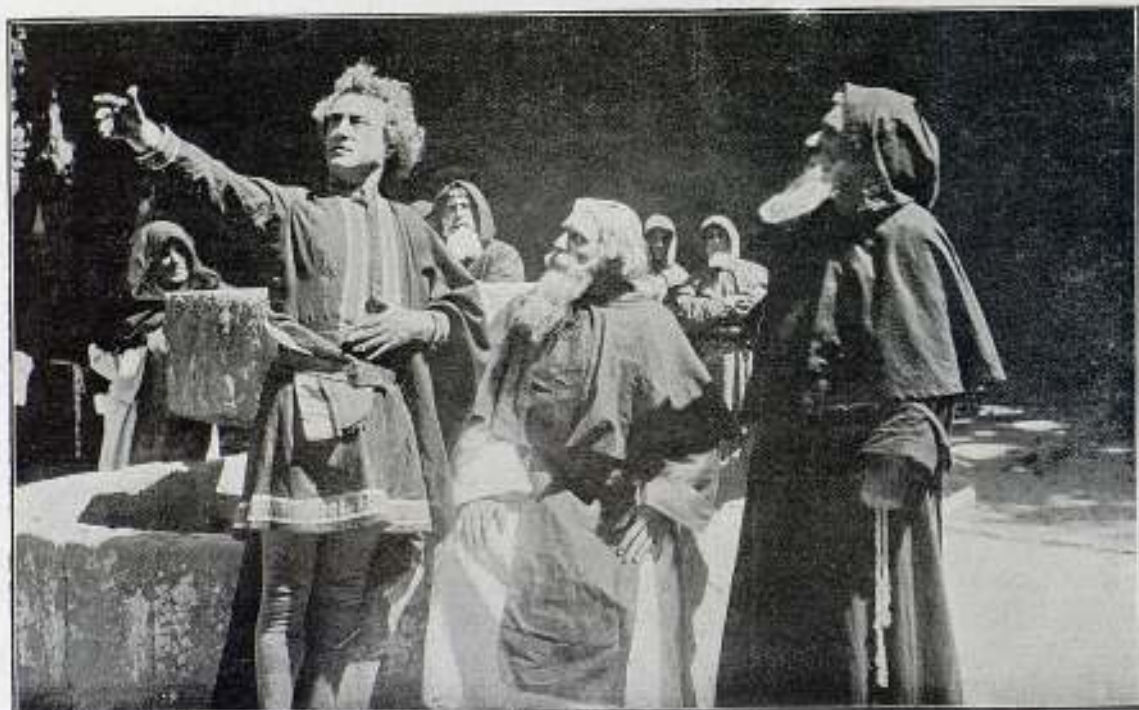
Una escena de la película La Vida de Cristóbal Colón

Y fué en Noviembre de 1486 cuando en el colegio de San Esteban de Salamanca, los más renombrados sabios de la época, después de esenchar atentos las explicaciones de Colón sobre la esfericidad de la tierra, entre burlas y manifestaciones de incredulidad, dieron por irrealizable el proyecto, considerando al genovés como un iluso presumioso. No obstante, propusieron a Colón la modificación de sus planes, a lo que éste se negó, y entonces la junta, por una-