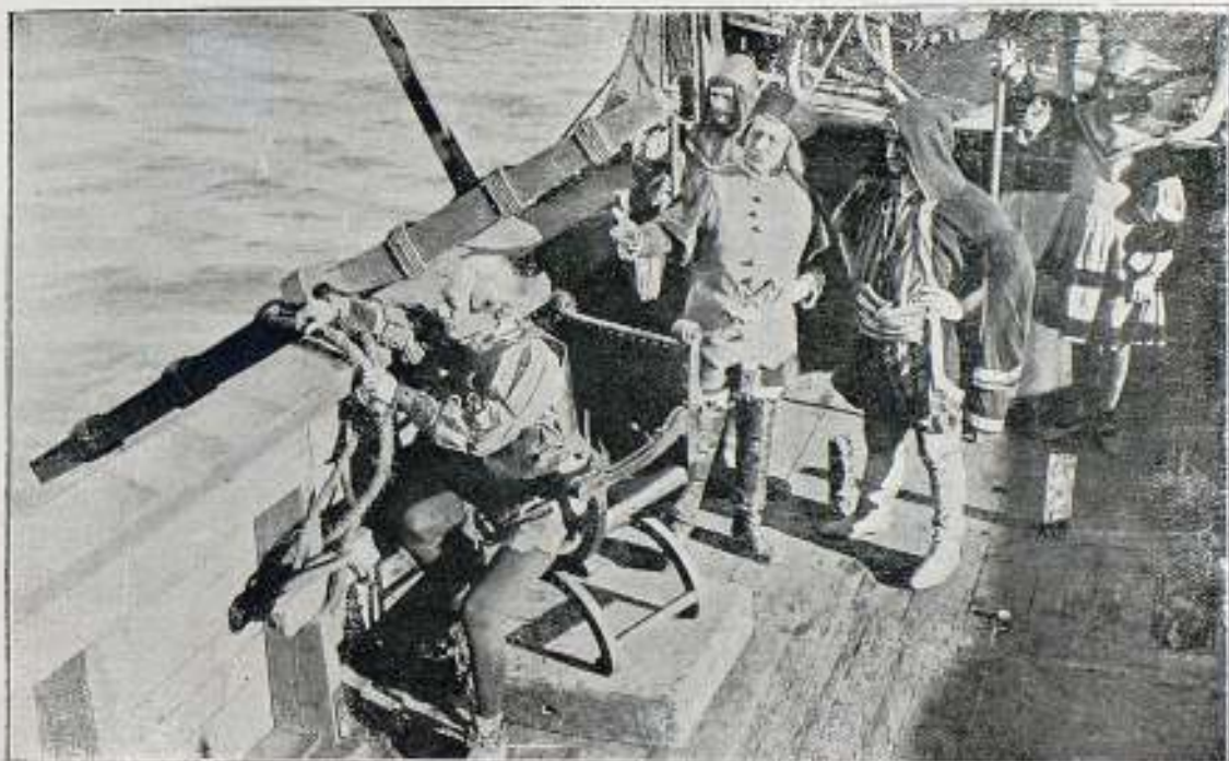
Una escena de la película La Vida de Cristóbal Colón

Llega la película al final de la historia del gran hombre. El 17 de Mayo de 1506, Cristóbal Colón hizo nuevo testamento, y tomando un pequeño bre-