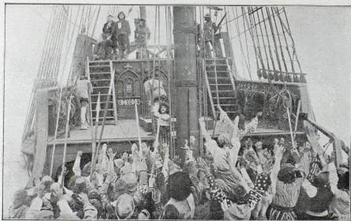
Una escena de la película La Vida de Cristóbal Colón

Después de explorar las costas de la «Isla de Cuba» y descubrir «Jamaica», llegó a la «Española»