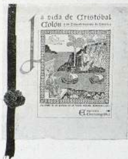
Reproducción facsimilar del dibujo al frente de la invitación