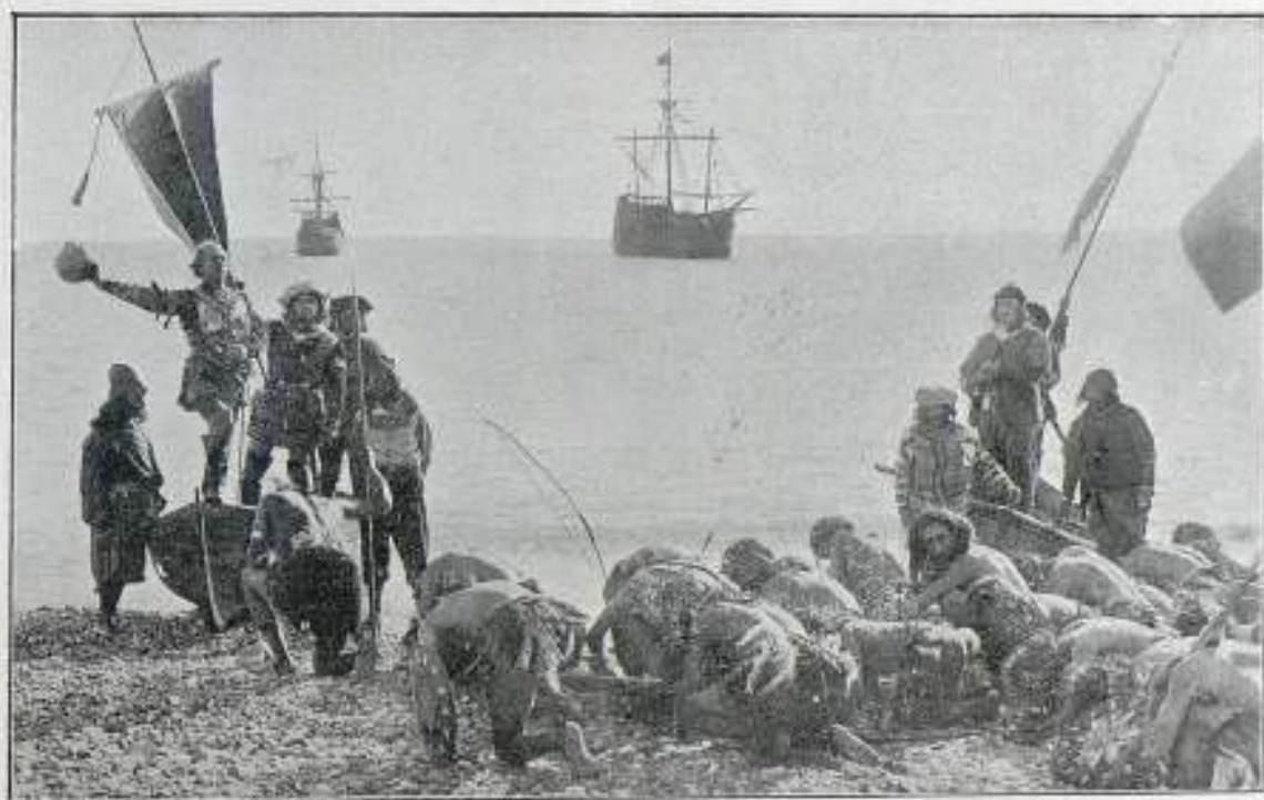
Una escena de la película La Vida de Cristóbal Colón

La campaña de difamación de los enemigos de Colón, capitaneados por Margarit, seguía su curso; acusándole de haberse querido erigir Rey de los paí-