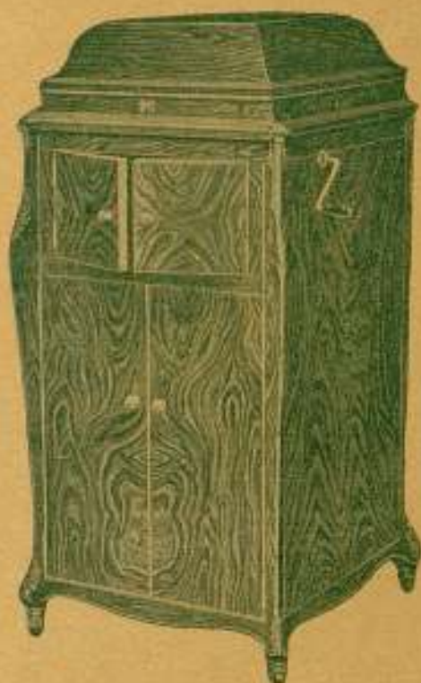
"GRAMOLA" Modelo n.º 28

En nogal circasiano; Precio: 1.500 plas.