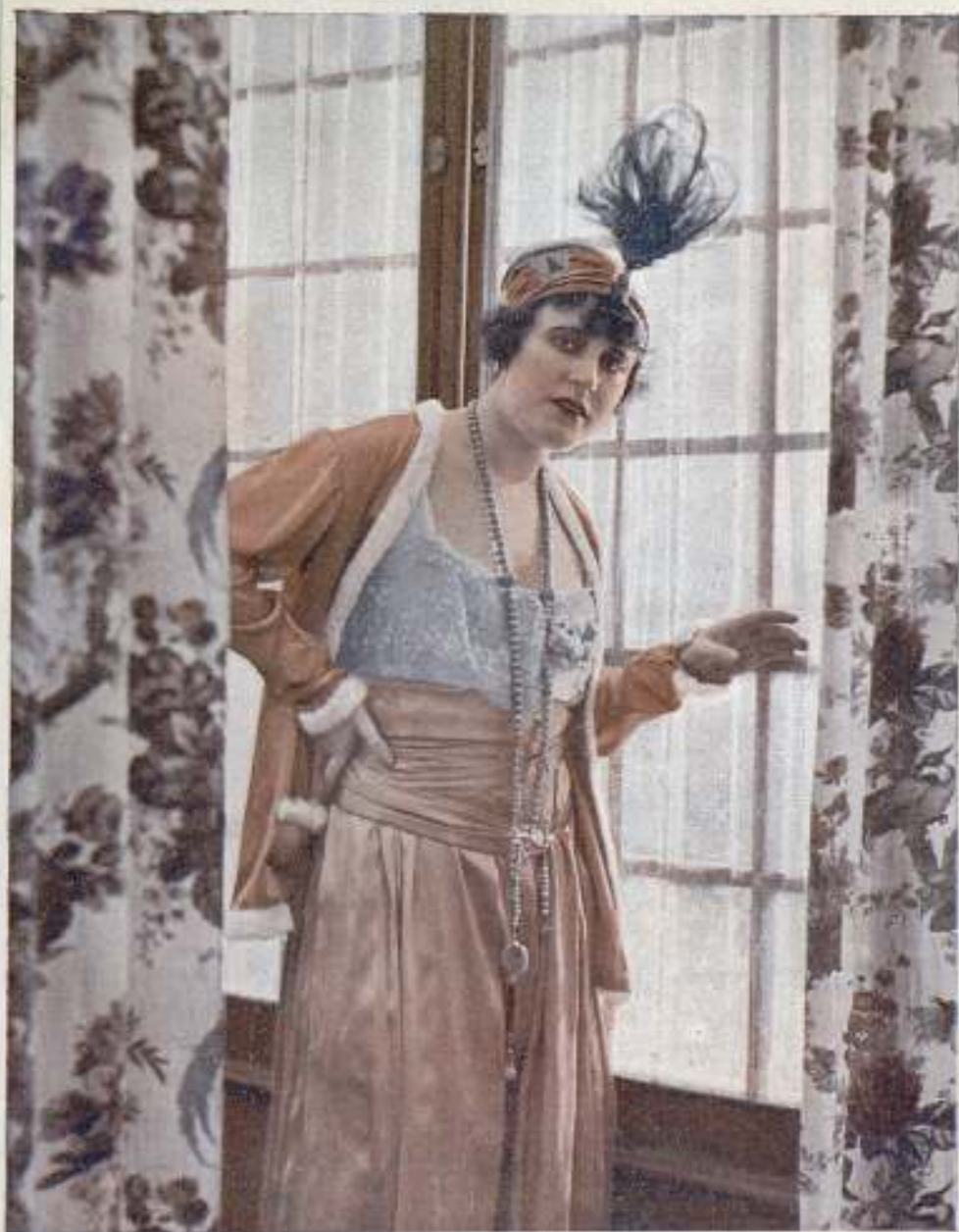
KITTY GORDON, Intérprete de la película "LYDA D'OR"