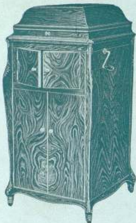
"GRAMOLA" Modelo n.º 28

En nogal circasiano; Precio: 1.500 ptas.