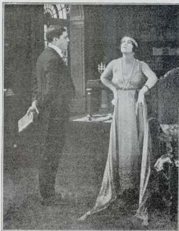
Una escena de la película «La Rosa de Granada»