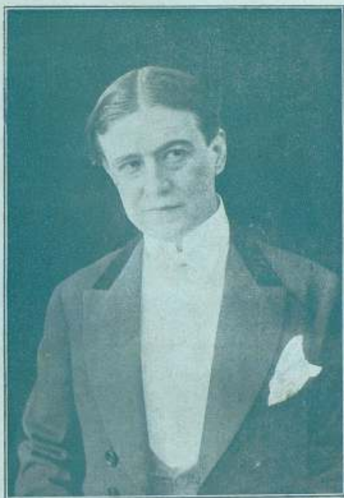
ABELARDO FERNÁNDEZ ARIAS (El Duende de la Colegiata)

Autor y protagonista de la emocionante película "EL YUGO"