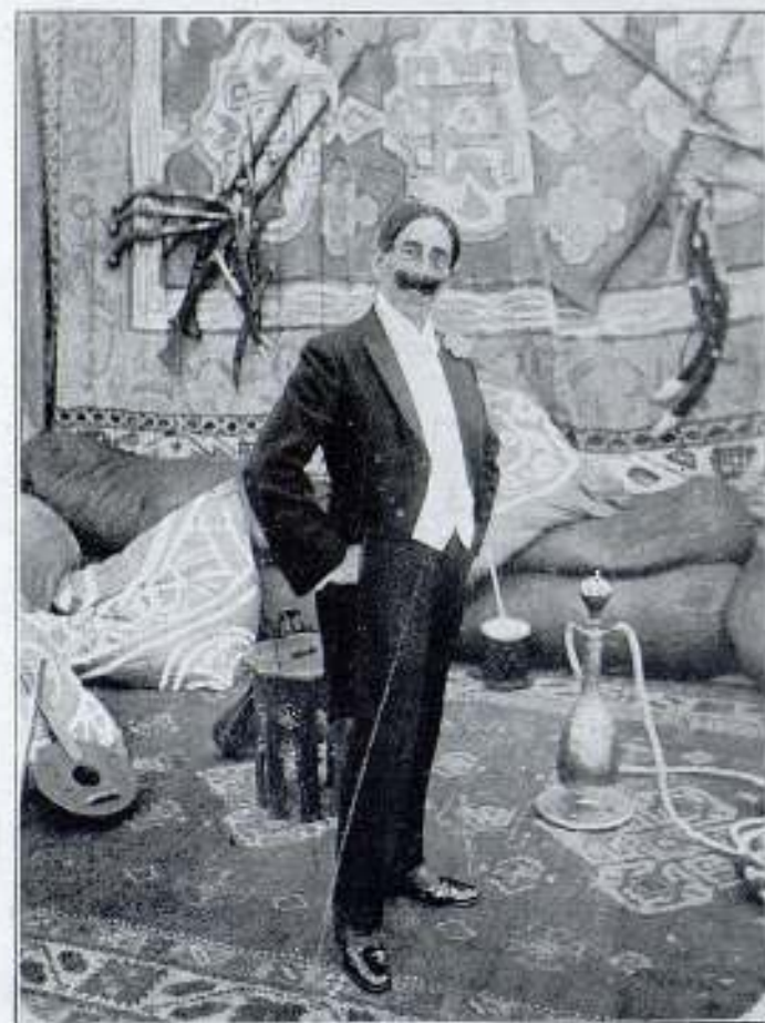
D. MARIANO DE LARRA en el protagonista de la obra