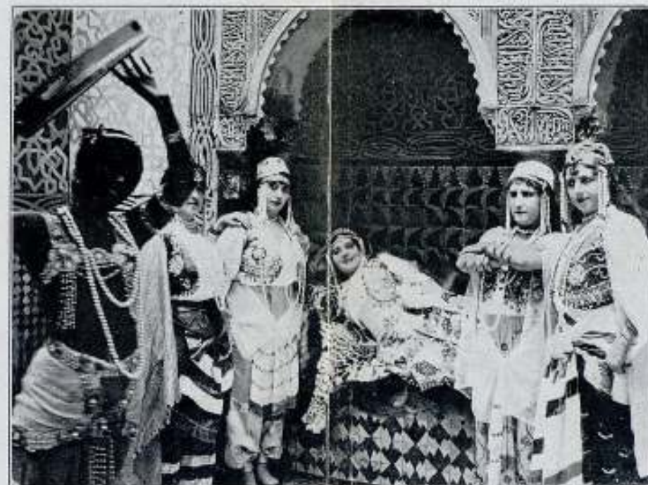
Reposo de la Sultana