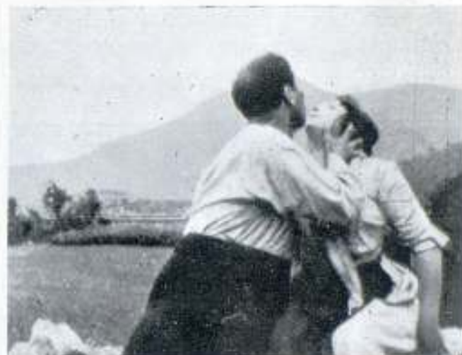
Un escena de MISTERIO DE DOLOR

Silvestre disimuló cuanto pudo el asombro que lo ocurrido le causaba, y decía entre sí: ¡no es lo que ellos creen, no; es que nos vió, es que nos vió!!