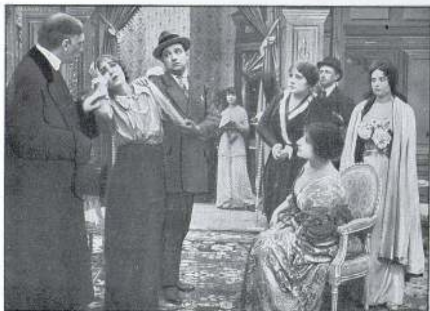
Una escena de la película LOS BUITRES DE PARÍS

piarse o este lo que cueste. Los Buitres no omiten ninguno de sus medios habituales para conseguir sus fines: los escrúpulos les son desconocidos, y los raptos, secuestros en los calabozos de un viejo castillo, y otras escenas del mismo jaez, se suceden sucesivamente en la pantalla, llevando al colmo la emoción del espectador, que espera, lleno de zozobra, el desenlace final, y en él, como es natural, el triunfo es para el valeroso detective, que ha sabido arrostrar todos los peligros para descubrir los crímenes de los "V" y apoderarse definitivamente de Los Buitres de París .