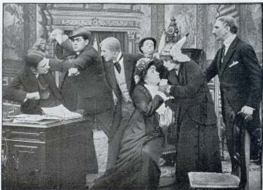
Una escena de la película LOS BUITRES DE PARÍS

La acción se desarrolla alrededor de una herencia de 10 millones, que los "V" han resuelto apro-