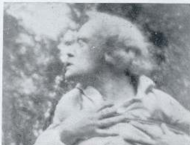
Das escenas de EL ALCALDE DE ZALAMEA