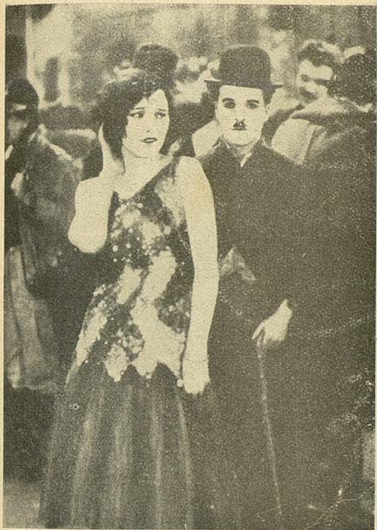
Una escena de «La quimera del oro»