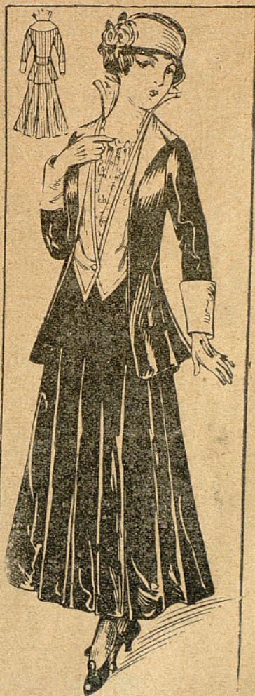
Lindísimo traje tailleur

El Agua de Colonia, el aguardiente de espliego, el agua de Portugal, el agua de rosas, la tintura de benjui y la esencia de violeta, son perfumes muy sencillos y agradables. Podéis hacer además, según vuestro capricho, armoniosas combinaciones. Disponed la dosis a vuestro gusto, pues es difícil determinar las cantida-