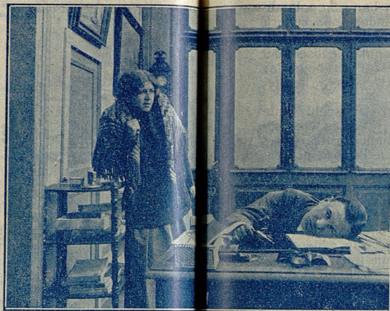
Tres escenas de la notable película EL PRIMER MANDO

Pocos días después se sabe que el «Buena Esperanza» ha naufragado con todo su equipo. La desesperación de Rosa no tiene límites, pues dentro de poco será madre y se ve en la necesidad de dar la noticia a sus padres.