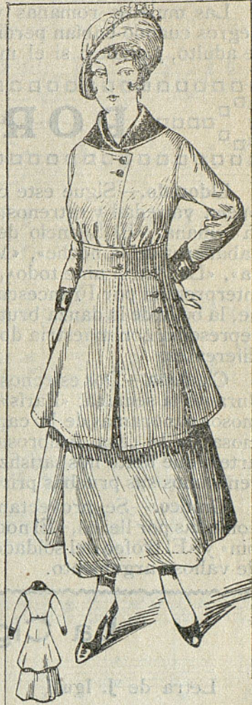
Traje de paño o de velutine con falda acampanada

Grecia descubrió una nueva y curiosa expresión del dolor. Las plañideras debían arañarse el rostro. Aun hoy día, las polinesias enlutadas se arrancan los dientes. Más radical era la costumbre india,